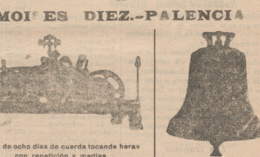
Reloj de ocho días de cuerda tocando heras con repetición y medias

Unica fábrica de su género en España, dotada de maquinaria de gran precisión y motores a vapor y eléctricos; se construyen relojes para iglesias, Casa consistoriales, colegios, cuarteles, etc., etc.