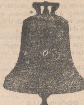
Todas mis campanas suenan la NOTA justa convenida construcción esmeradísima ya garantía 10 años.

Se refunden las rotas a precios muy económicos, siendo de mi cuenta los portes de ferrocarril a toda España.