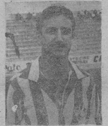
ALORDA es probable reaparezca frente al «Manacor»

Después de varias jornadas en las que los alaroneses nos venían deparado buenas tardes de fútbol y acumulando puntos en su casillero, se tropezó frente al otro as-