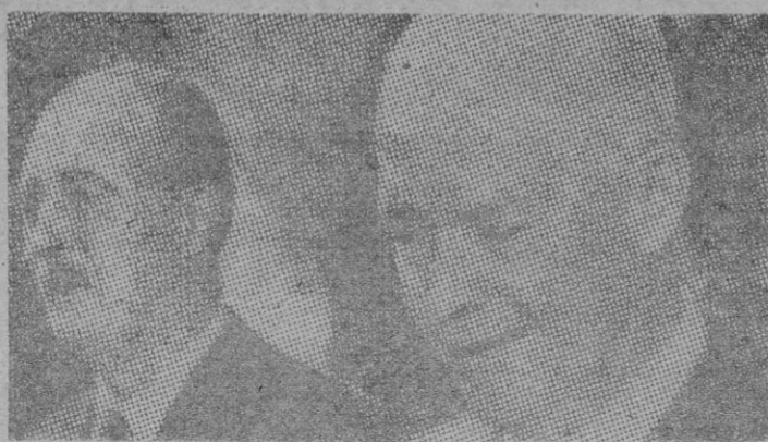
He aquí a los dos políticos anglosajones durante su reciente conferencia en Campo de David.