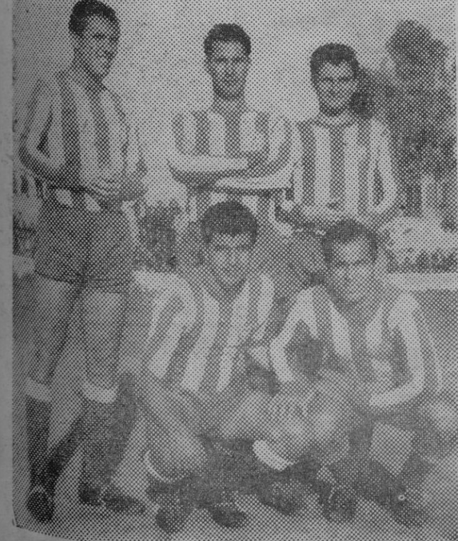
Los cinco canarios del Atlético Baleares