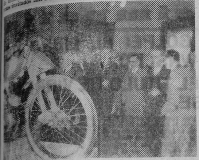
Después de los invitados al acto, admirando el nuevo ciclomotor «Gimson», que fue exhibido en el Hotel Terminus.

Ayer por la tarde y en los salones del Hotel Terminus, fue presentado oficialmente en España el nuevo ciclomotor «Gimson».