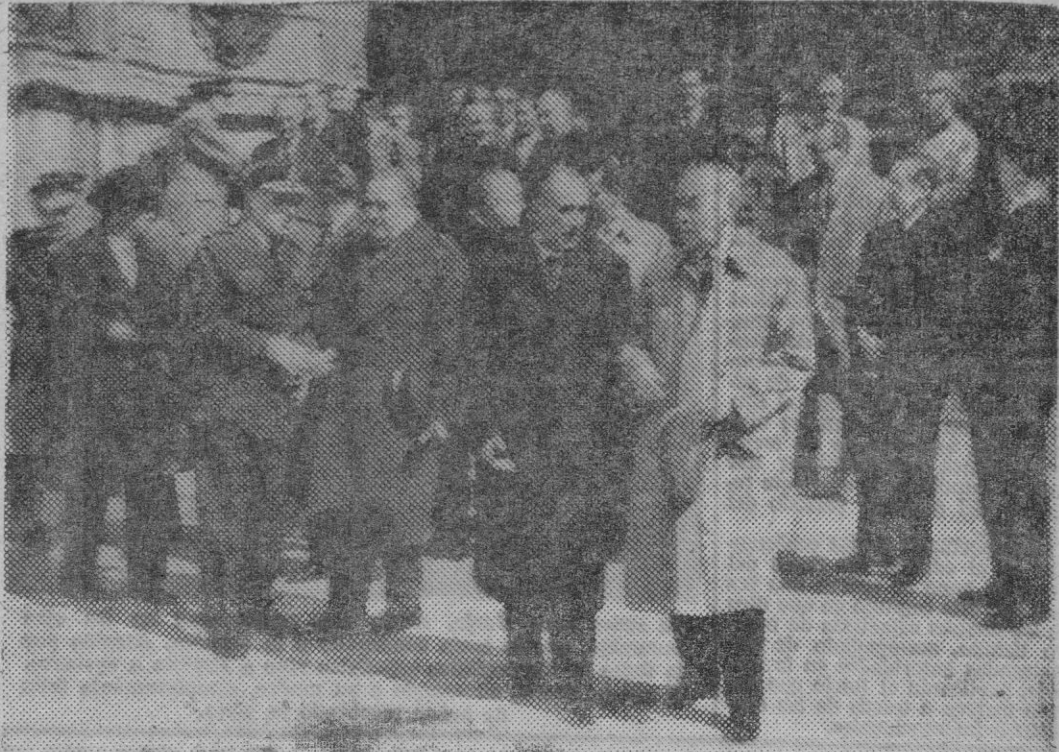
Nuestras primeras autoridades, civiles y militares, a la salida, al mediodía de ayer, de la Basílica de San Francisco, después de haber asistido a la Misa en sufragio de los Mártires de la Tradición, acto que organizó la Jefatura Provincial del Movimiento.

En Madrid, los actos fueron presididos por el Ministro Secretario General del Movimiento