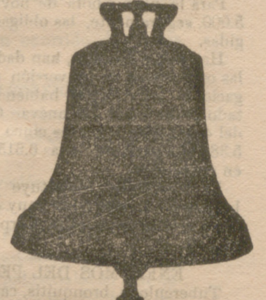
Todas mis campanas suenan la NOTA justa convenida construcción esmeradísima ya garantía 10 años.

Única fábrica de su género en España, dotada de maquinaria de gran precisión y motores á vapor y eléctricos; se construyen relojes para iglesias, Casa consistoriales, colegios, cuarteles, etc., etc.