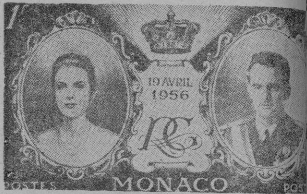
Montecarlo editó este sello al casarse los Príncipes