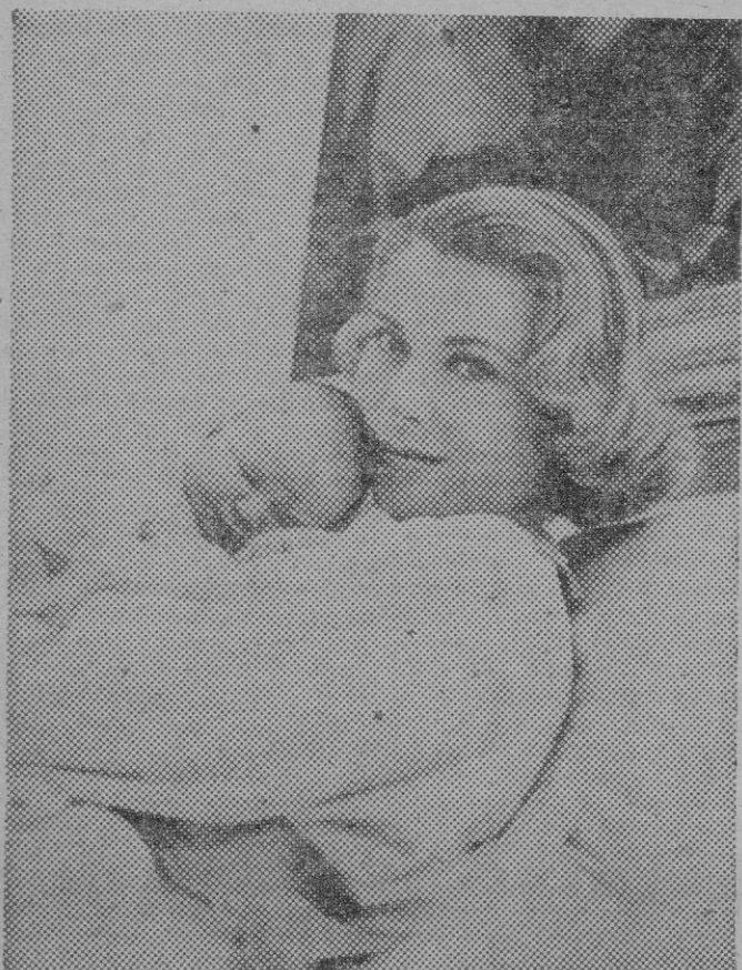
GRACE DE MONACO

—Ahora comprendo todo está en el Evangelio. Niño aprendí que Cristo, que deben seguir los cristianos, no tuvo otro placer que hacer la voluntad del Padre. Es la renuncia dolorosa a nuestra voluntad y la entrega total de nosotros y de todas las cosas a Dios.