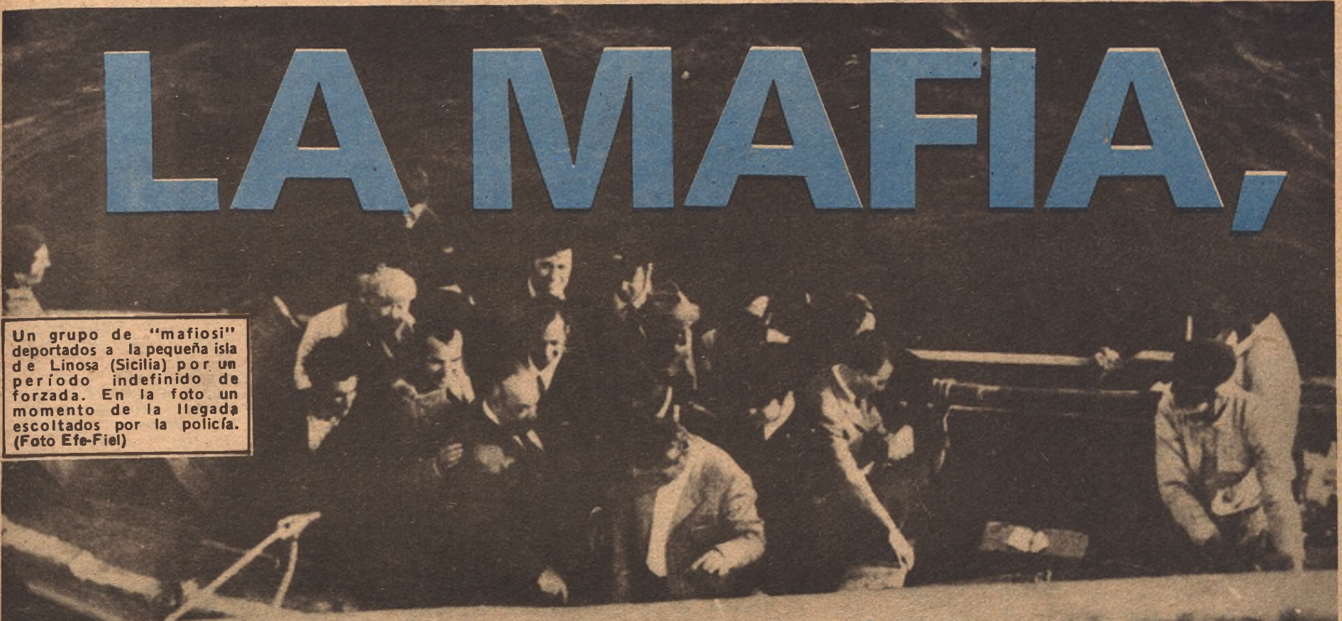
Un grupo de "mafiosi" deportados a la pequeña isla de Linosa (Sicilia) por un período indefinido de forzada. En la foto un momento de la llegada escoltados por la policía.