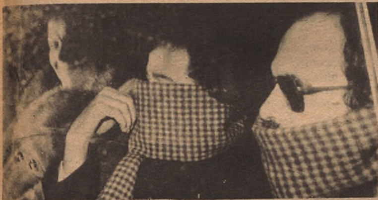
ROMA.— Tres árabes, convictos de haber intentado derribar un avión israelí de pasajeros, el año último, por medio de un proyectil dirigido, de fabricación rusa, salen del cuartel de la policía, después de haber quedado en libertad bajo fianza. Los periódicos italianos informaron la pasada semana que guerrilleros palestinos intentaron secuestrar un avión italiano o un barco para conseguir que los tres detenidos fuesen puestos en libertad, y se les permitiera ir a un país árabe.

Dichas fuentes han manifestado que la compañía había sido informada de que tres japoneses y dos árabes, que subieron en París al avión que se dirigía a Londres, eran terroristas y que llevaban bombas en su equipaje. Añaden que este hecho es posible que tenga relación con el secuestro que sufrió ayer un avión de la "British Airways", en ruta desde Beirut a Londres, sin que hayan dado más explicaciones. Trescientas cuarenta y cinco personas murieron en el accidente ocurrido en las inmediaciones de París, lo que constituye el desastre de mayores proporciones de la historia mundial de la aviación.