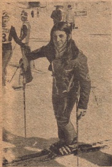
LAS PRUEBAS Y SU DESARROLLO