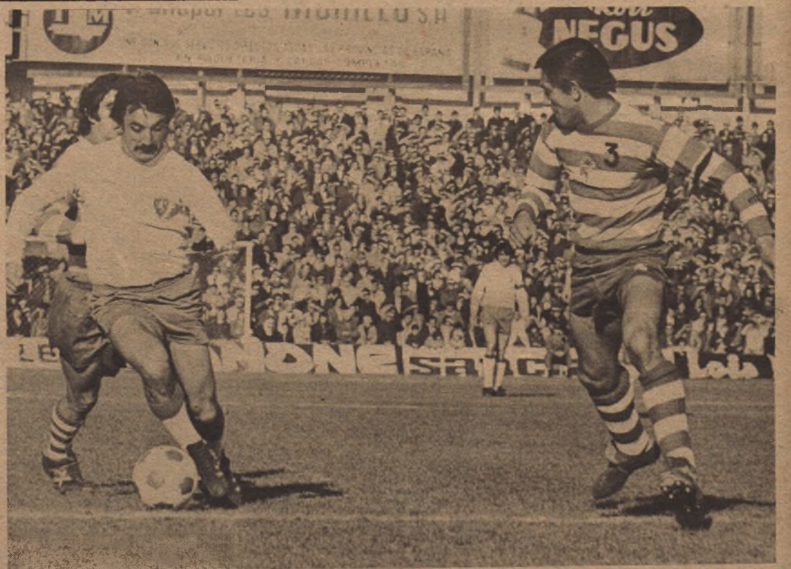
No tuvo suerte el extremo zaragocista. Remató con el pie, de cabeza, le hicieron un penalty y no pudo conseguir un gol. Aiguien le gritaba: "¡Fustero! ¡Fustero!", recordando la combatividad y la velocidad del extremo zaragocista de otra época. Y nos agrada que Rubial se mantenga en ese tono combativo y luchador.