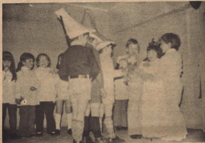
Los pequeños de las Escuelas Nacionales representaron una "función" con la gracia y el encanto que los chicos tienen para estas cosas.