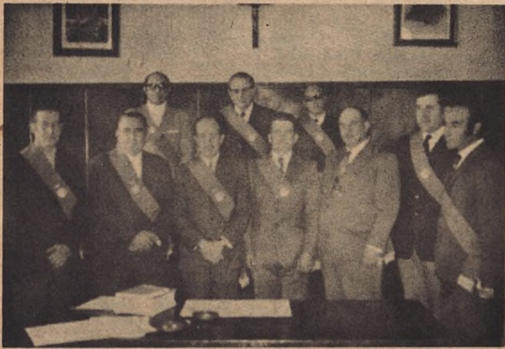
El nuevo ayuntamiento gallurano en el acto de su constitución.

♦ TOMARON POSESION DE SUS CARGOS LOS CONCEJALES ELECTOS