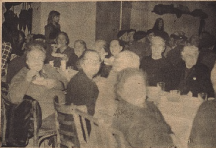
Va a comenzar la fiesta de jota y estas veteranas se disponen a admirar la gracia y el brio de este baile, un baile que también ellas, ¡ay!, trenzaron en sus años mozos.

los otros, los menos jóvenes, porque ya saben cómo se agradece en la última etapa de la vida estos gestos de cariño y gratitud.