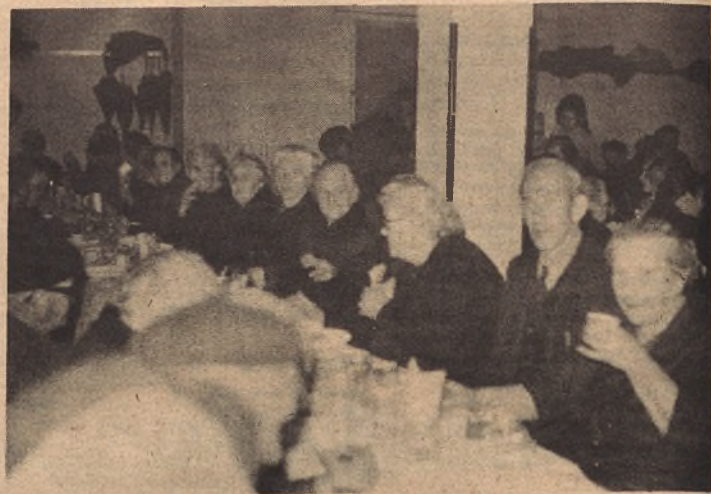
El humeante chocolate ya está en la mesa y las gentes galluranas de la "tercera edad" dispuestas a hacerle los honores.

Hubo algún "llorico" en el transcurso de la fiesta, pero todos regresaron contentos a sus casas. Unos, los jóvenes, por la satisfacción del deber cumplido y