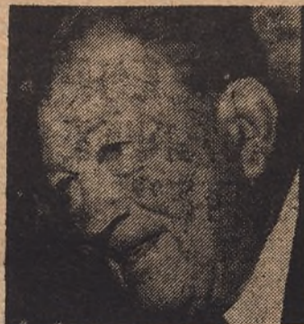
VICTOR MCLAGLEN, EN EL CICLO JOHN FORD

Primera sesión ofrecerá el sábado por la tarde, en la sobremesa "Las chicas de la Cruz Roja". Tony Leblanc y