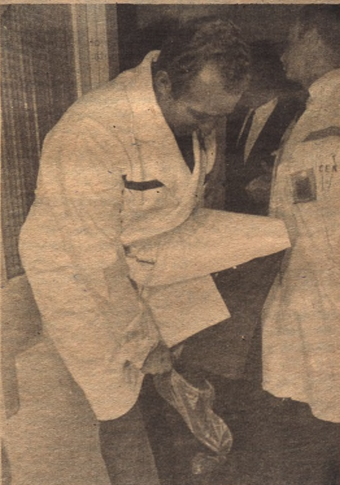
El príncipe Juan Carlos colocándose fundas sobre los zapatos para evitar la posible contaminación durante su visita al centro de Investigación Nuclear francés en Saclay.

En cuanto a la Delegación de Acción Política y Participación, hacía dos años que estaba vacante, y el cargo de delegado era ejercido por el titular de la Delegación de Provincias. Que se haya cubierto el cargo ahora puede deberse a que la anunciada "ofensiva institucional" vaya a prestarle un contenido del que hasta el momento carecía. Pero esto también es una suposición, pues nadie ha explicado nada públicamente. Los más optimistas han pensado en las asociaciones políticas, que se concebían como la natural función de ese organismo, aunque no la única.