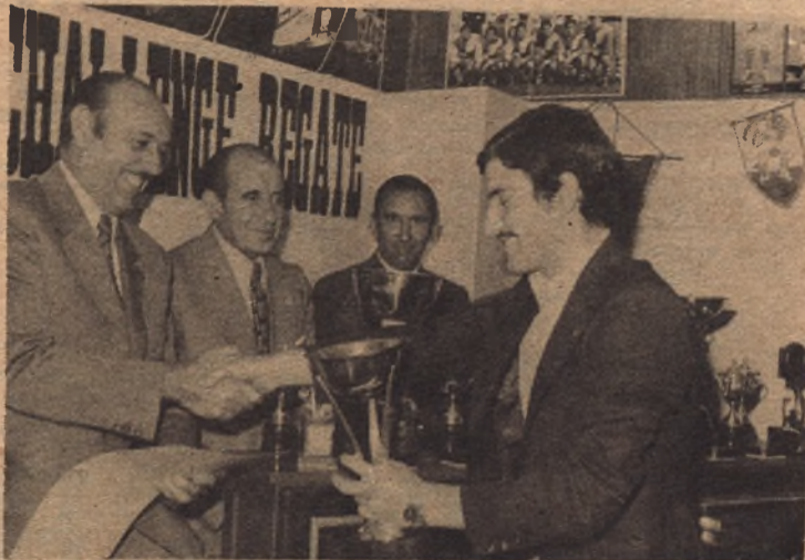
ANCHERLERGUES (Calasanz). Mejor juvenil Preferente