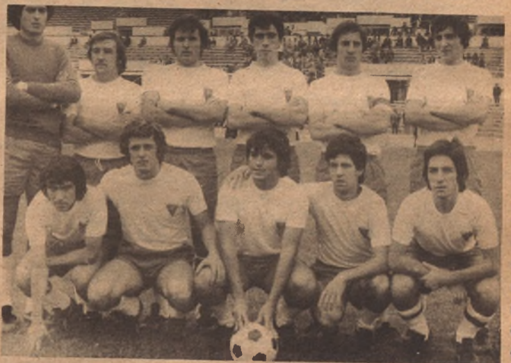
ARAGON, primero en Deportividad