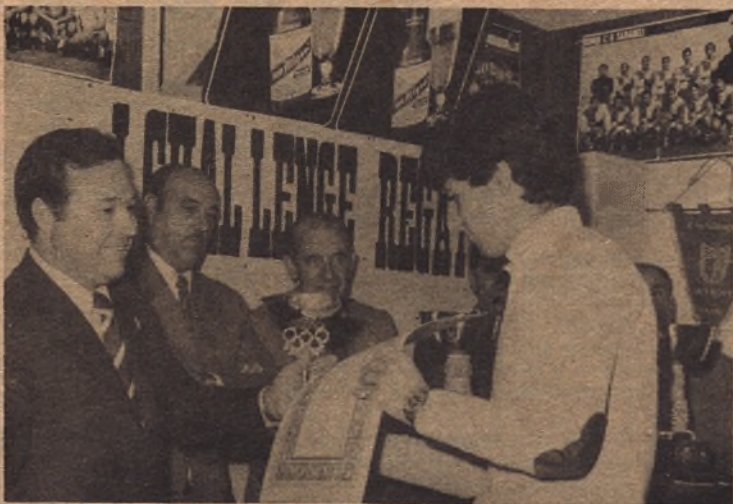
ARAGONÉS (Berdala). Mejor juvenil Primera División