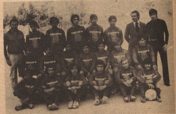
BOSCÓS-BECARS, 2 ; GOYA-OLIVER, 0

En las instalaciones deportivas de Salesianos que presentaban un magnífico aspecto, se jugaron el sábado las semifinales del primer trofeo Merino, mucho público para presenciar los dos interesantes partidos, y a decir verdad que no salió defraudado, pues el juego realizado fué de auténtica calidad.