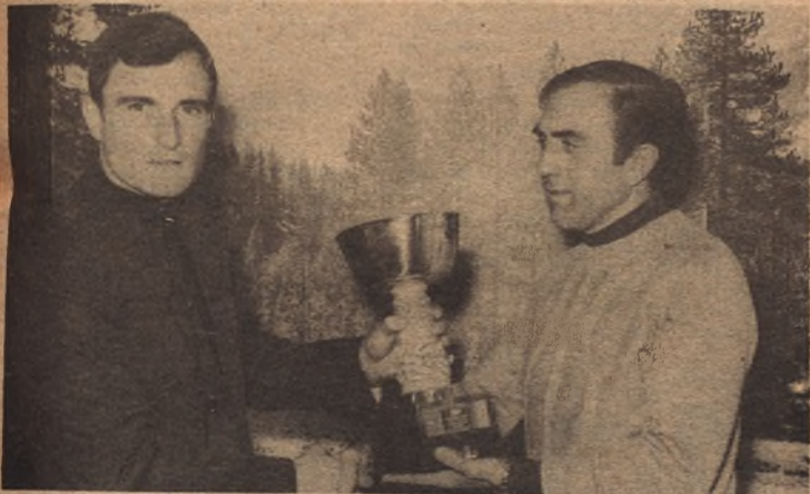
SAINZ (Eureka). Mejor Primera Regional