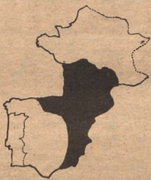
La zona manchada en negro en el mapa, indica el área que abarcan las Cámaras integradas en la C. O. P. E. F.

POSIBLEMENTE, ZARAGOZA ALBERGARA LA SECRETARIA GENERAL DE TAL ORGANISMO