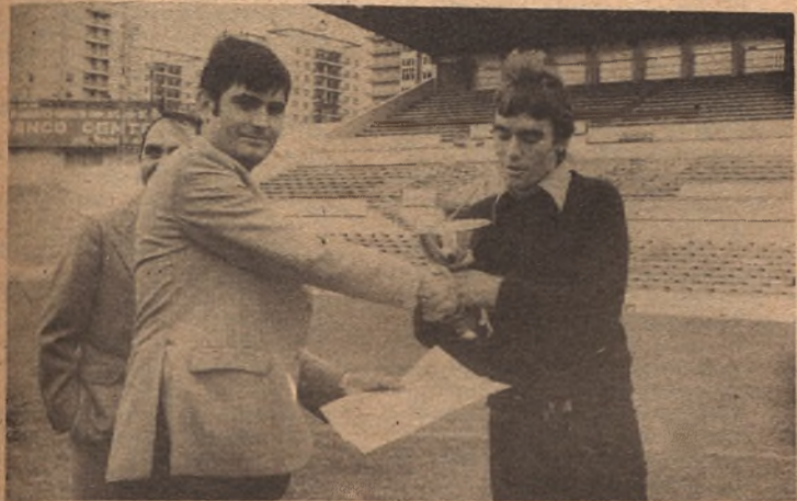
CASTRO (Monzón). Mejor Primera Preferente

Zaragoza Deportiva, "ARAGON/express" y REGATE, da la más cordial enhorabuena, a este gran grupo de jugadores promesas. La I Challenge "REGATE", ya está en marcha esperamos que todos hagan méritos para merecer el honor de ser mejor en la próxima entrega de Premios.