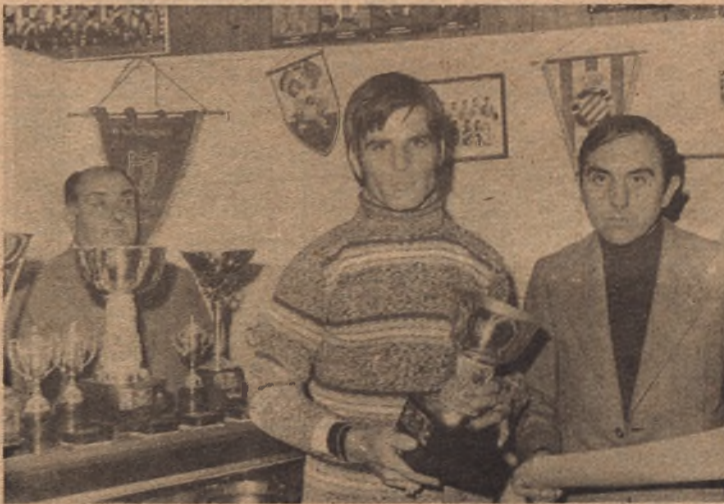
LORENZO (Illueca). Mejor Segunda Preferente