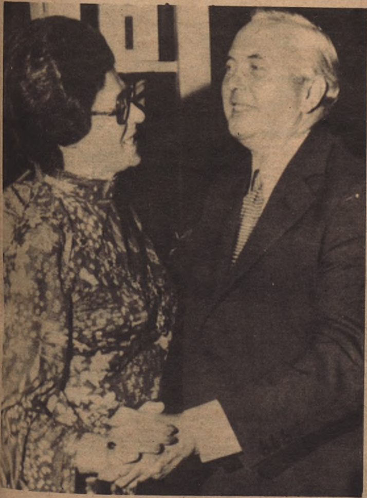
BLACKPOOL.— El ex primer ministro Harold Wilson y líder del partido Laborista, bailando con la invitada en la gala de la asamblea del partido, la alcaldesa de Blackpool Sra. de Raymond Jacobs.