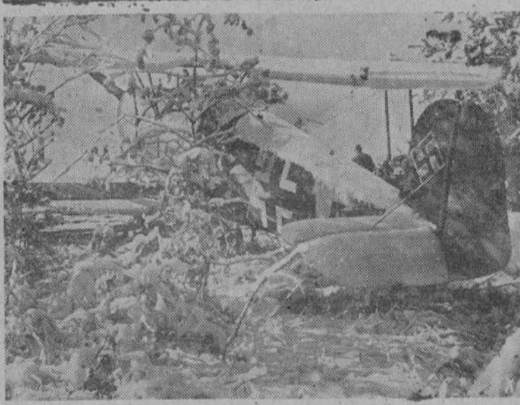
Avión de esta afemin camuflado en un aeródromo de campaña en Rusia.

Tokio, 12.--Los círculos competentes japoneses señalan con relación al anunciado hundimiento del acorazado japonés "Haruna", que sin duda las fuerzas norteamericanas han confundido al crucero ligero cuyo hundimiento anuncia el Cuartel General Imperial, con el acorazado pesado que señalan los comunicados americanos.--EFE.