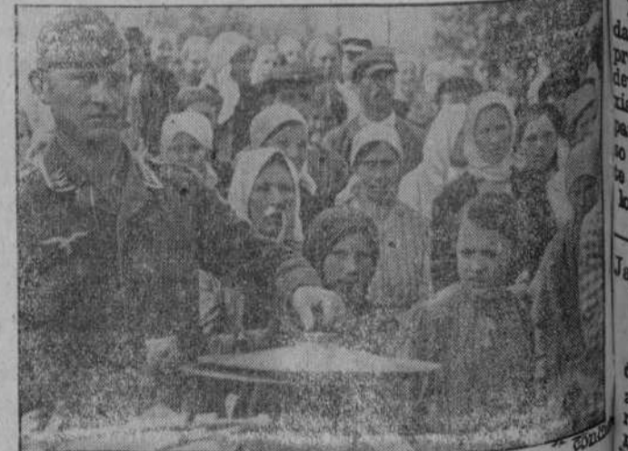
La población de una ciudad ucraniana to de una banda militar alemana

Berlin, 12.--El jefe movimiento nacionalsocialista de los Países Bajos, Muszert, ha sido recibido por el Führer.--(Efe).