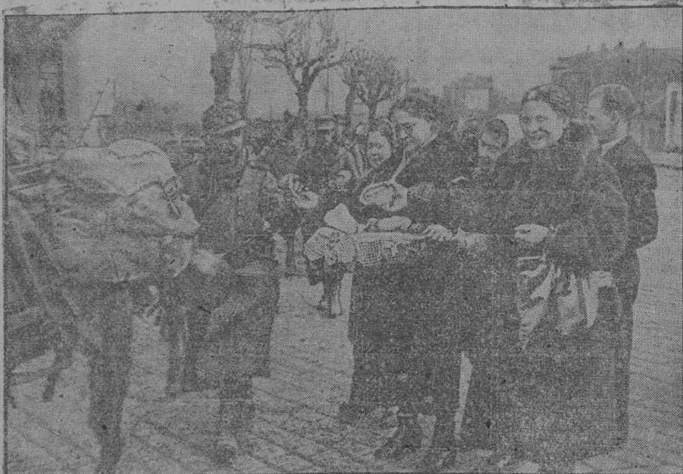
Las tropas alemanas son saludadas amistosamente por la población búlgara.