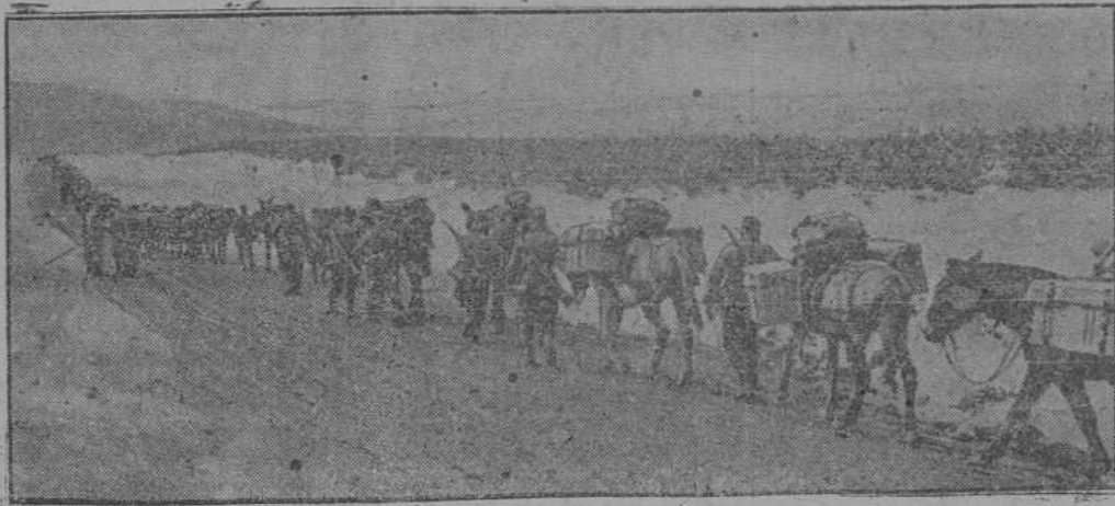
Tropas alemanas en su paso por Bulgaria

Otro informador preguntó si también los barcos que cruzan el Mar Rojo irán escoltados y Roosevelt dijo que nada sabía de barcos norteamericanos que vayan a navegar por el Mar Rojo o que deseen ir. "La situación actual—siguió el Presidente—es tan complicada, que ni aún yo mismo, que estoy algo mejor, informado que la prensa, puedo hacer predicciones o extremar decisiones sobre largo plazo".—EFE.