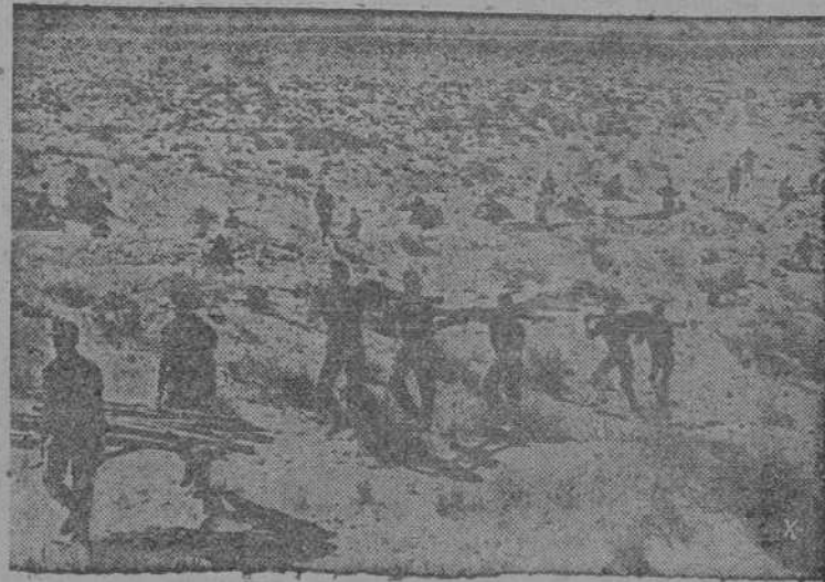
Soldados alemanes e Italianos construyendo posiciones en el desierto africano

En el Africa del Norte, un ataque de las fuerzas blindadas enemigas, apoyado por los navíos de guerra contra Sollum, fué rechazado.