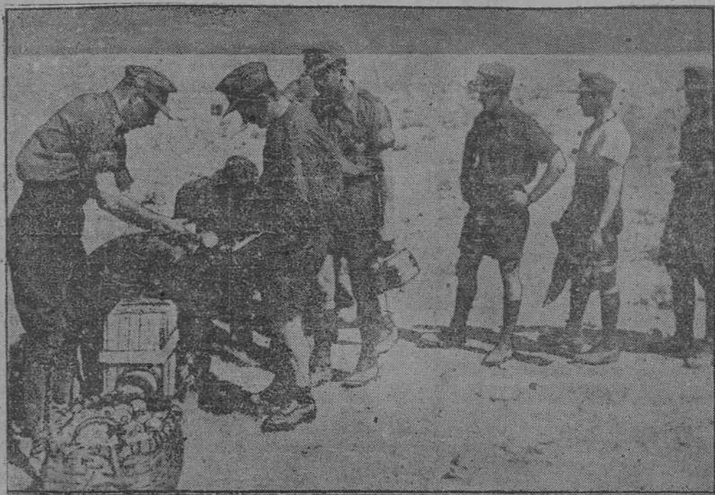
LA HORA DE RANCHO