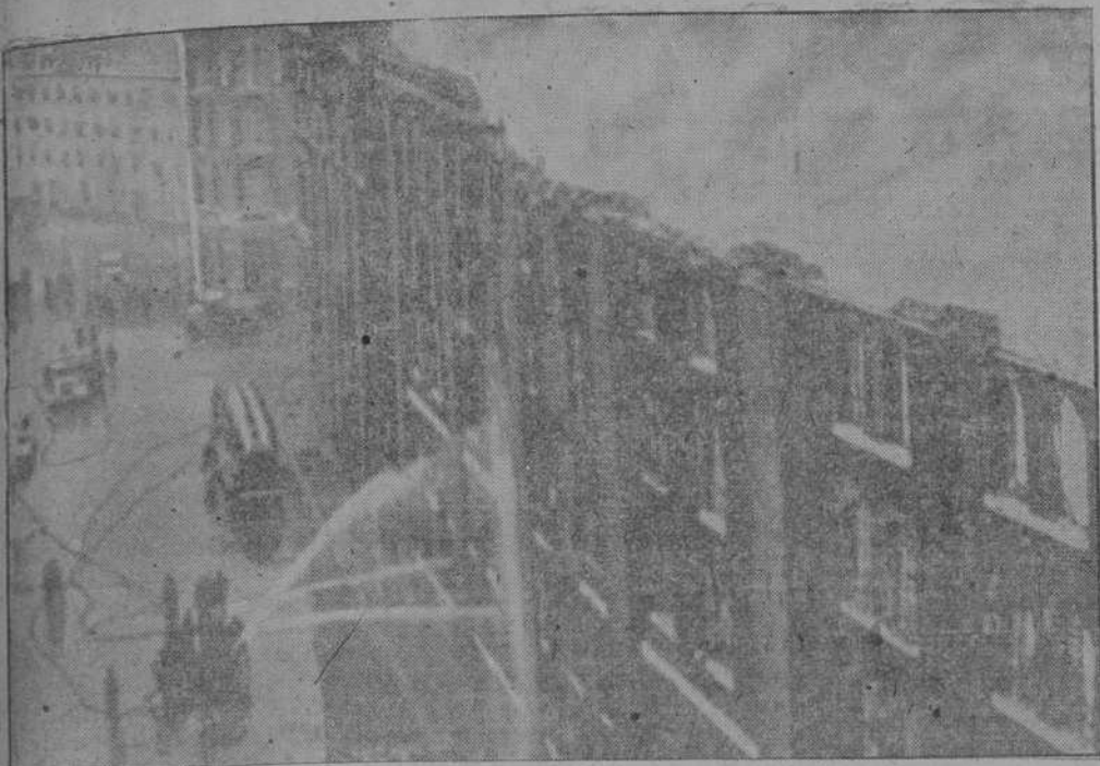
Uno de los grandes almacenes de Londres que quedó destruido completamente después de un ataque alemán.

Todas estas observaciones registradas fotográficamente, demuestran las graves consecuencias del bombardeo efectuado por los aviones alemanes contra el canal, bombardeo que ha paralizado todo el tráfico inglés desde el Mediterráneo al Mar Rojo.—EFE.