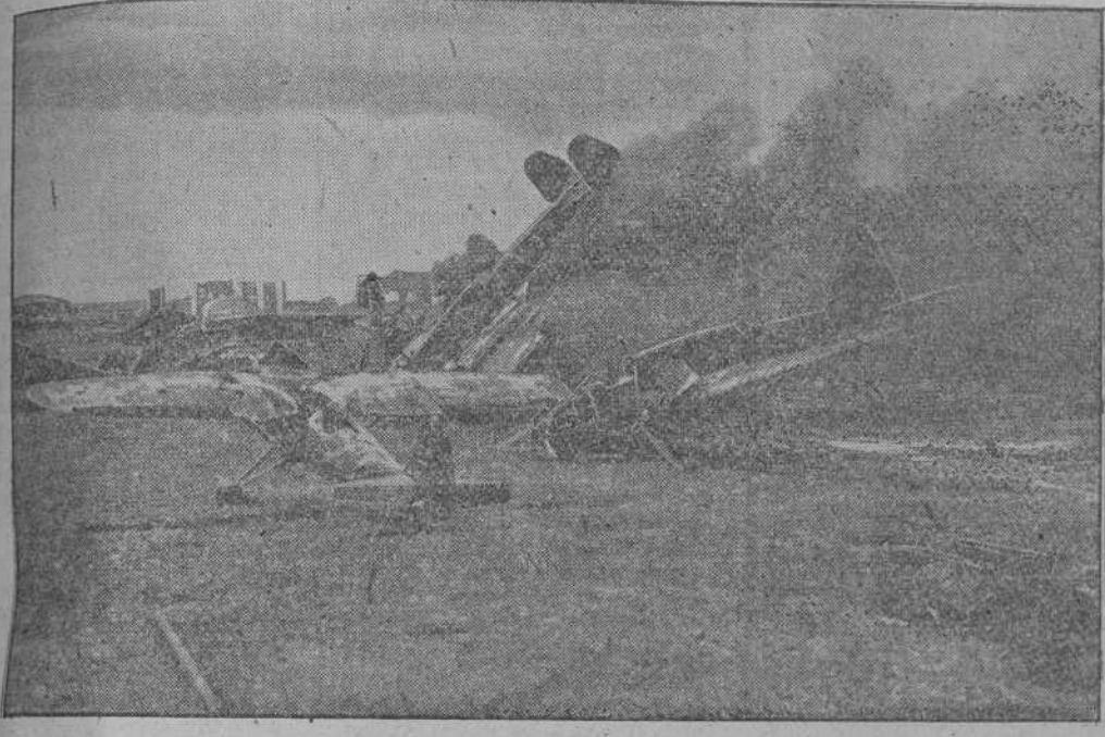
Emocionante escena de la película "Escuadra de Combate Lützow cuyo rodaje se está ultimando en los Estudios "Tobis", bajo la dirección de Hans Bertram.

Está soltera. Es rubia con ojos pardos verdosos. Mide 1,62 y pesa 54 kilos.