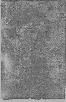
La genial actriz Luísa Roa, uno de los valores más notables en la escena española.

"La Ciudadela" está basada en una novela de A. J. Cronin, del mismo título, que describe la vida de un médico en un pequeño distrito minero del País de Gales, poniendo de relieve las continuas luchas que el médico rural tiene que sostener en todo tiempo contra los males que afectan a los habitantes de aquellas insalubres regiones. Algunos aspectos de la vida de la sociedad londinense también aparecen descritas en esta novela que, a su publicación, consiguió para su autor fama y renombre mundiales.