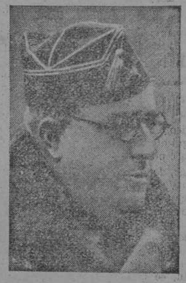
En vigila constante para ser vicio de la Patria. Fieles al Caudillo, que sabe es. A. C. ARRIBA ESPAÑA! El Reino YACUE

Y de pronto, surgen los motores, a cuya puesta en marcha han asistido, escuchando en todo momento de los movimientos del vehículo, las flechas de cada aparato. Naturalmente, aunque sean 2 trimotores "Savias" los señalados para efectuar el vuelo, que ha de constituir el bautismo del Aire de los flechas, es imposible que puedan suar todos a la vez que están en el campo de una sola vez; por lo que se da orden de efectuar los vuelos necesarios, para que todos lo puedan hacer.