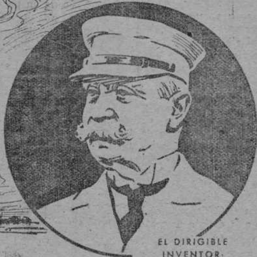
EL DIRIGIBLE INVENTOR: CONDE DE ZEPPELIN 1838-1917

Todos los grandes inventos son fruto de ideas luminosas. Existen en el universo materias y energías, que utilizadas con el acierto de una feliz idea producen efectos asombrosos. He aquí el secreto de la INSTANTINA, combinación especial de eficacísimos elementos terapéuticos, inocuos y seguros, que cortan con la máxima rapidez los resfriados y sus consecuencias así como toda clase de dolores.