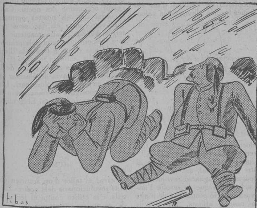
—Tant rics que érem i ara veure'ns en una posició, tan dolenta

«Cal prosseguir la lluita fins a la fi. Quan a Rússia tinguérem la guerra civil, el poble, que no tenia mitjans de lluita, va vèncer, malgrat tot, destruint les tiranies. Així ha d'ocórrer a Espanya, que sabrà palesar les grans possibilitats que l'esdevenidor li reserva.»