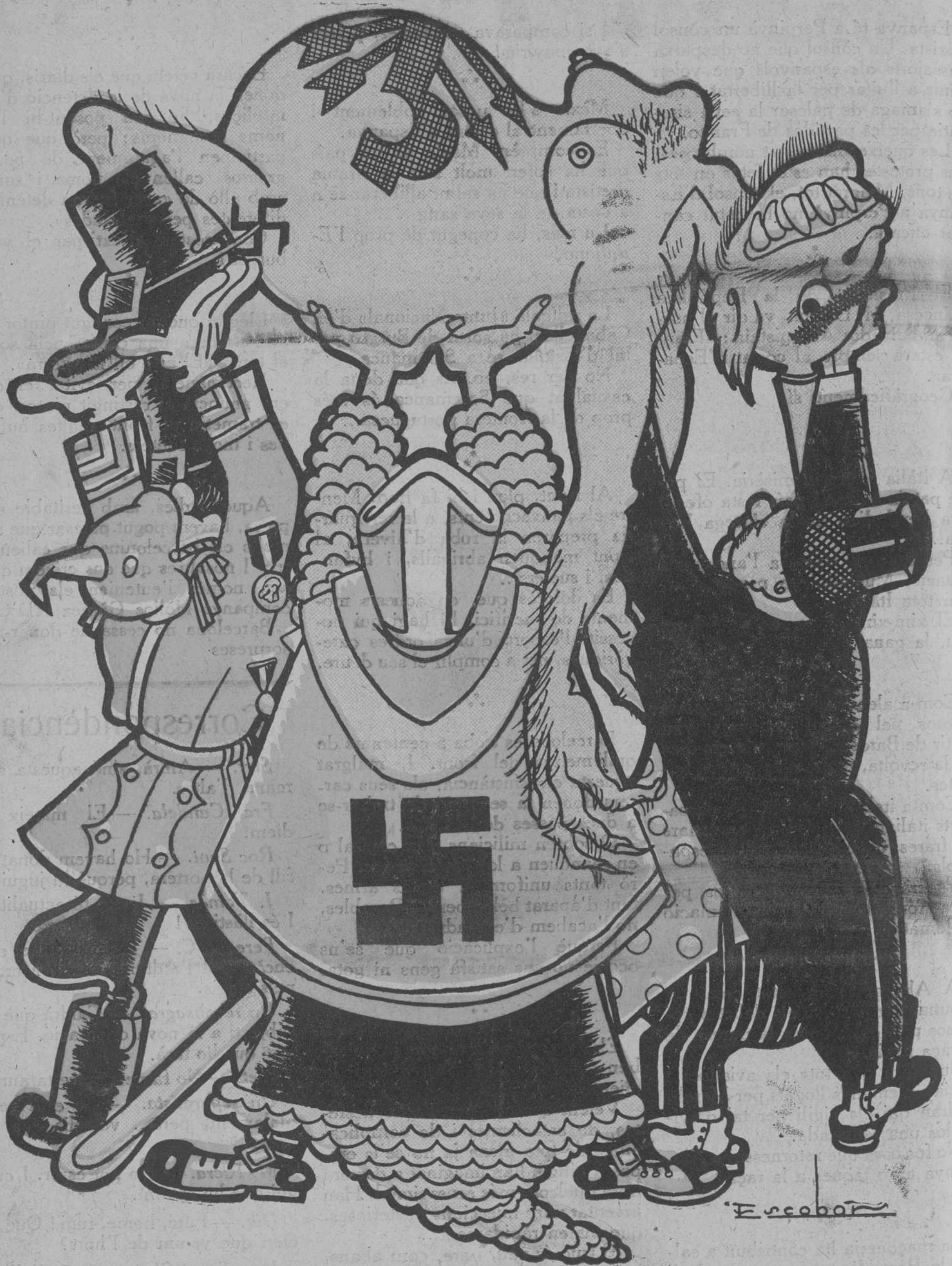
EL FEIXISMÉ I L'ANIMA QUE L'AGUANTA