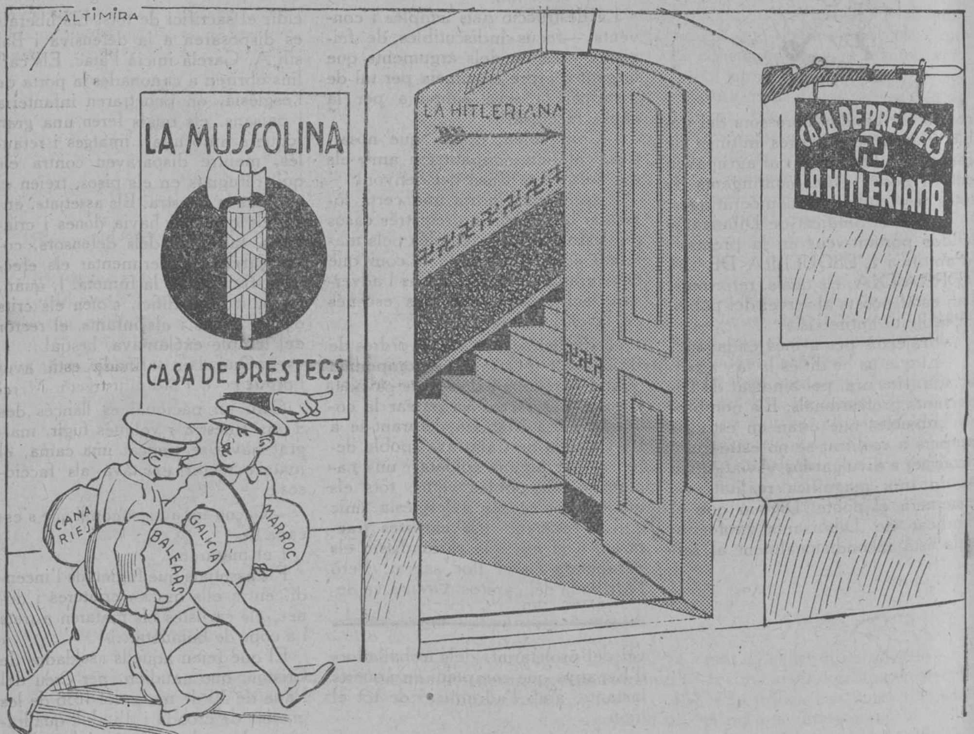
—Empenyoreu-vos-ho ací que no miren prim respecte a la procedència.

—I ara! No, senyor, no. Joestic sense feina... I el Sindicat de Talla-dors de Cupó, encara que existís, no me'n donaria!