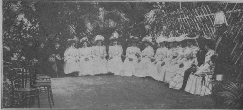
Jurat d' honor del Concurs de flors y plantas.