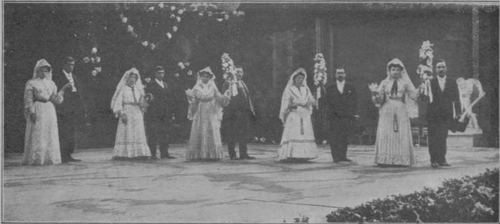
Las parejas que varen ballar el "Ball del ciri".