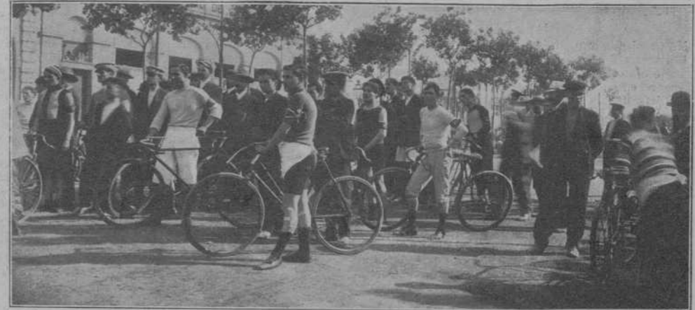
Els corredors de las carreras de bicicletas.

Quatre senyoretas vestides de blanc, quatre noys que corren fins á reventar, quatre cotxes cursia bastant mal posats, quatre fanals tristos de quatre anunciants, quatre assalts d' esgrima entre quatre gats, quatre serenatas en quatre arrabals, quatre balls de yespre en quatre mercats, quatre banderets, quatre lunchs molt cars, quatre ximplerías, quatre disbarats, quatre corre-cams, quatre flors de drap; veus' aquí la síntesis de lo més granat qu' hem vist en las festas del Juny d' aquest any.