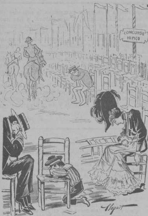
Las tardes de mes concurrencia.