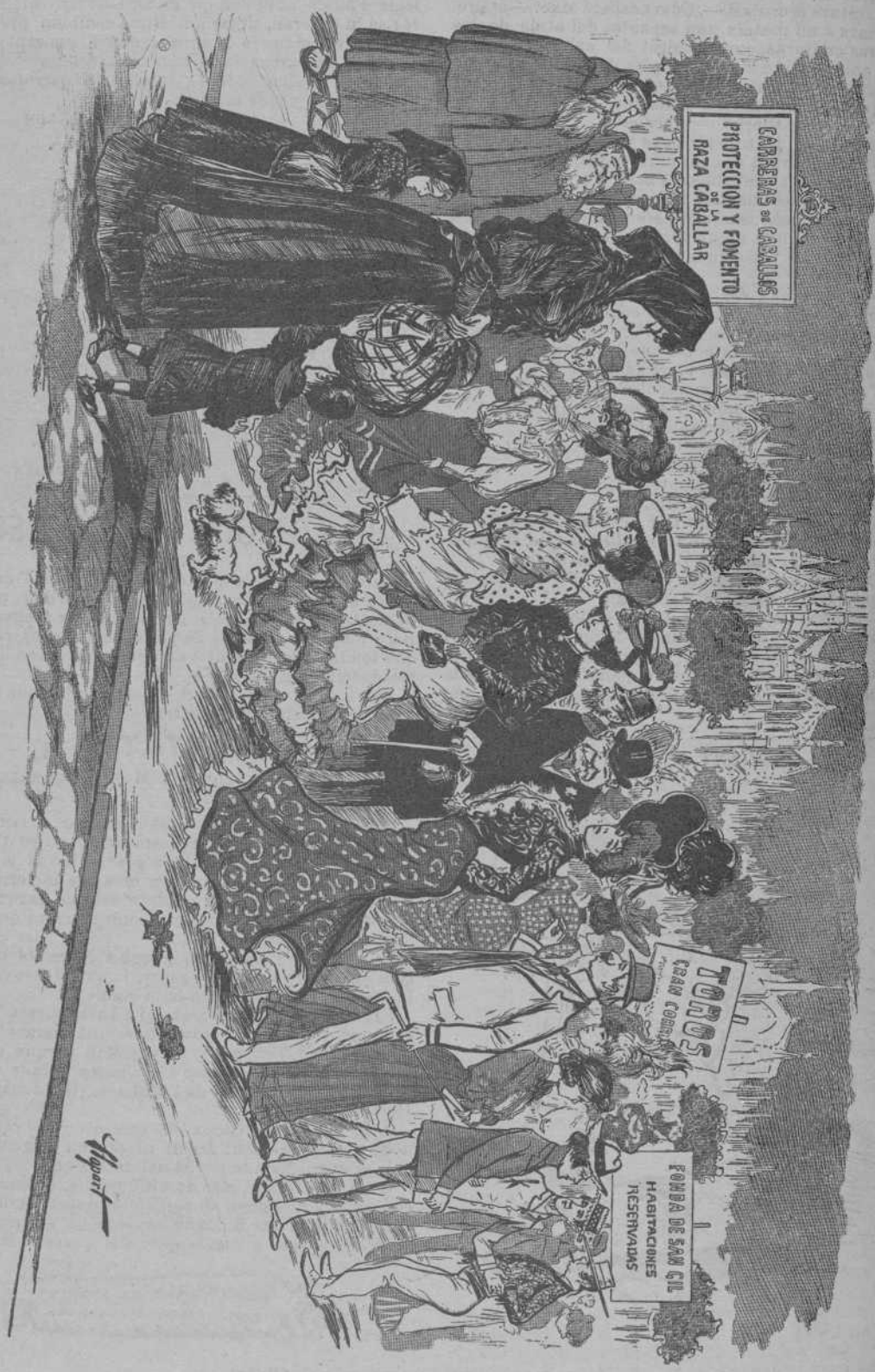
Abundancia y miseria.