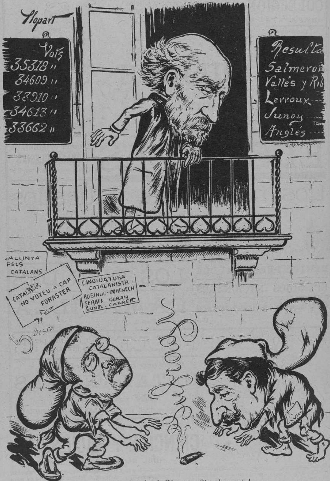
—¡Pobres baylets! ¡Cóm aprofitan la punta!