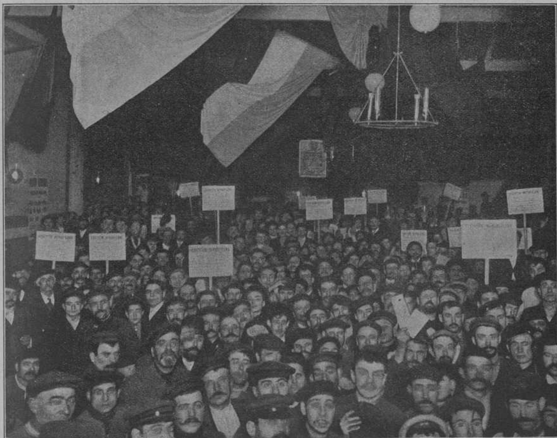
Els repartidors de candidaturas de la Coalició, reunits a la «Fraternitat Republicana».