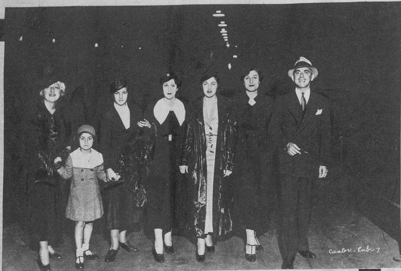
Cantor, su familia