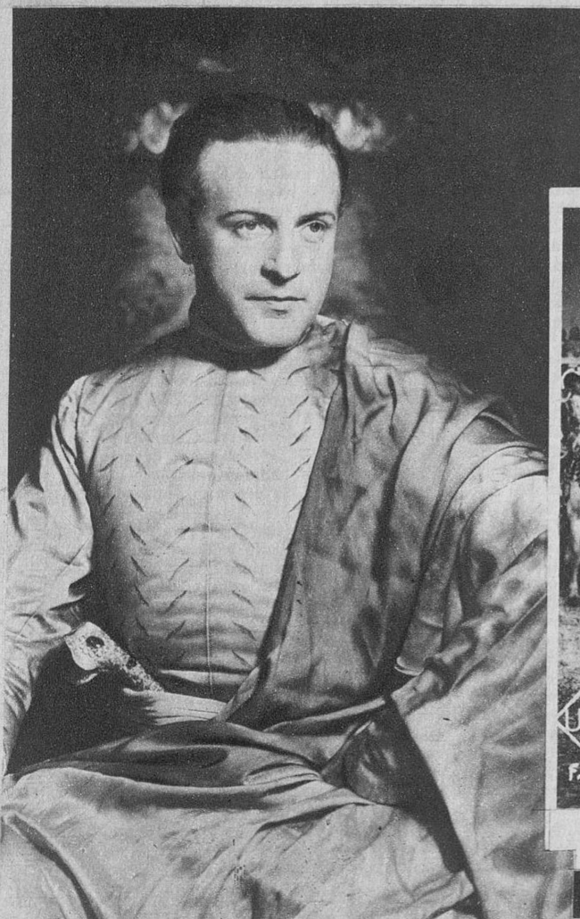
Willy Fritsch, el conocido astro de la U. F. A., Annie Ducaux y Kate de Nagy, en el film «Noche de mayo». Eddie Cantor, su esposa y sus cinco hijas