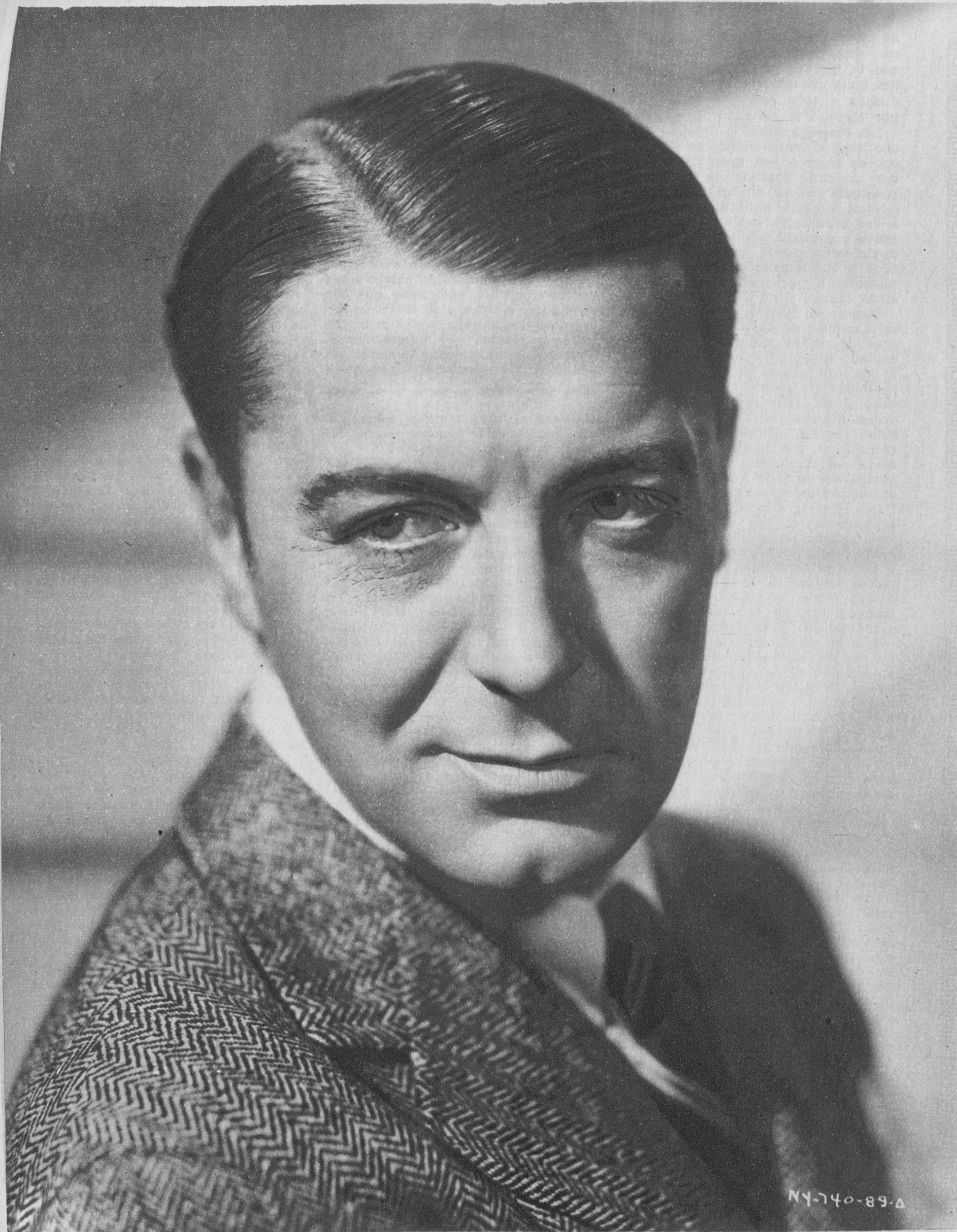
Clive Brook, conocido veterano del lienzo, contratado actualmente por la Empresa Radio Films