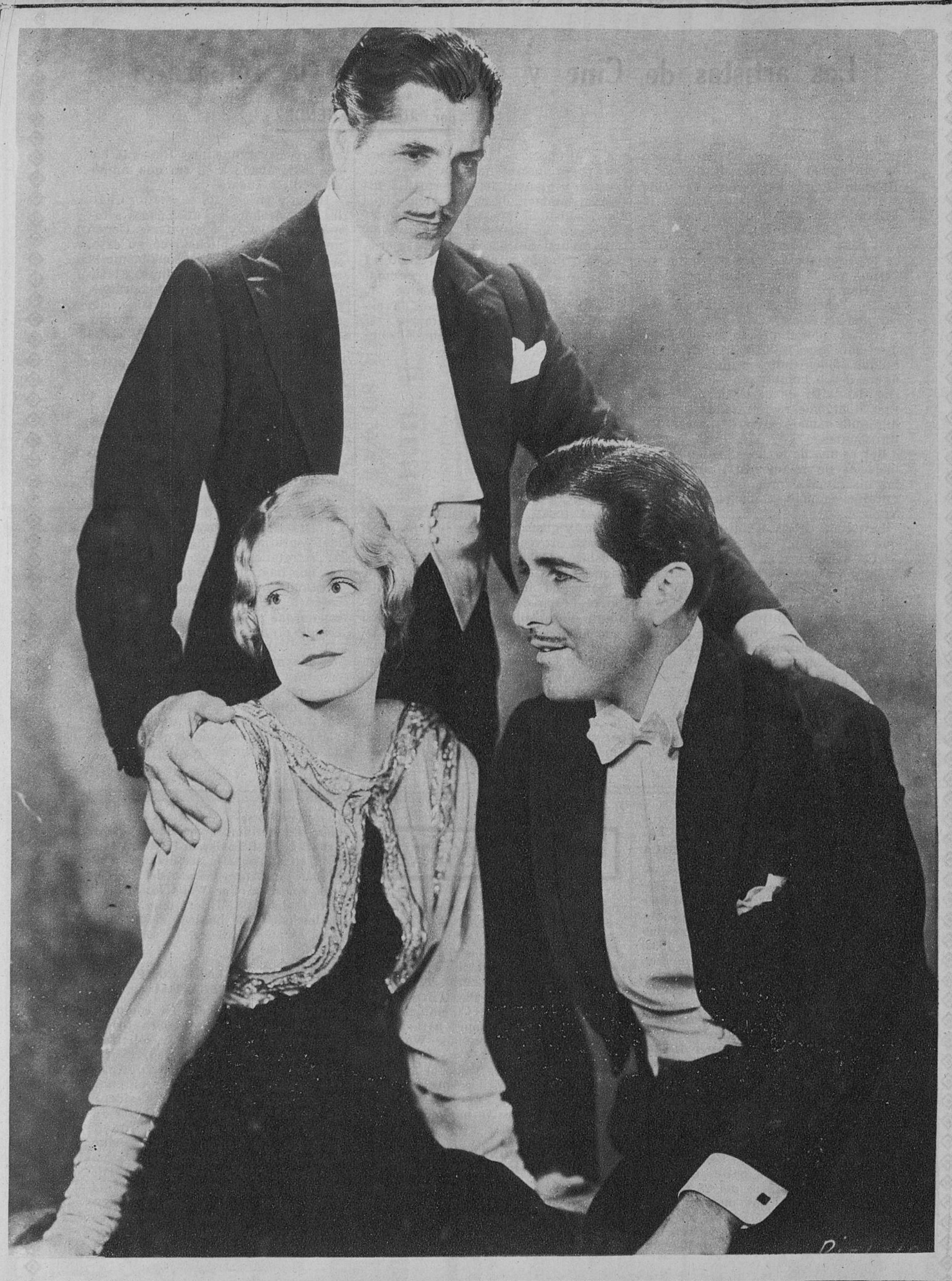
Marion Jordan, un poco «indecisa», ante una declaración de amor de John Boles, que patrocina paternalmente el gran Warner Baxter. (Escena de la película «Fox» «6 horas de vida»)