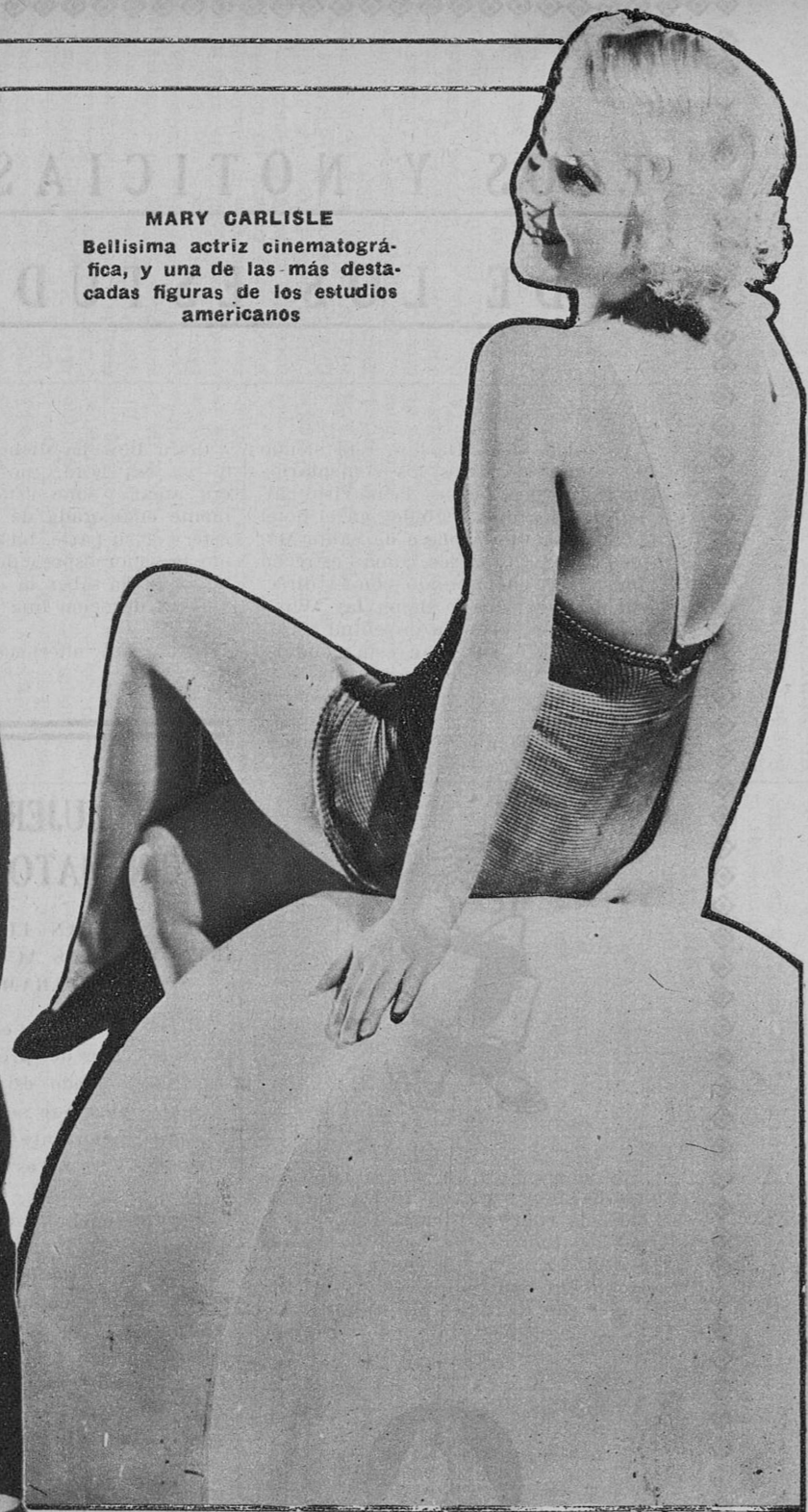
MARY CARLISLE Bellisima actriz cinematográfica, y una de las más destacadas figuras de los estudios americanos