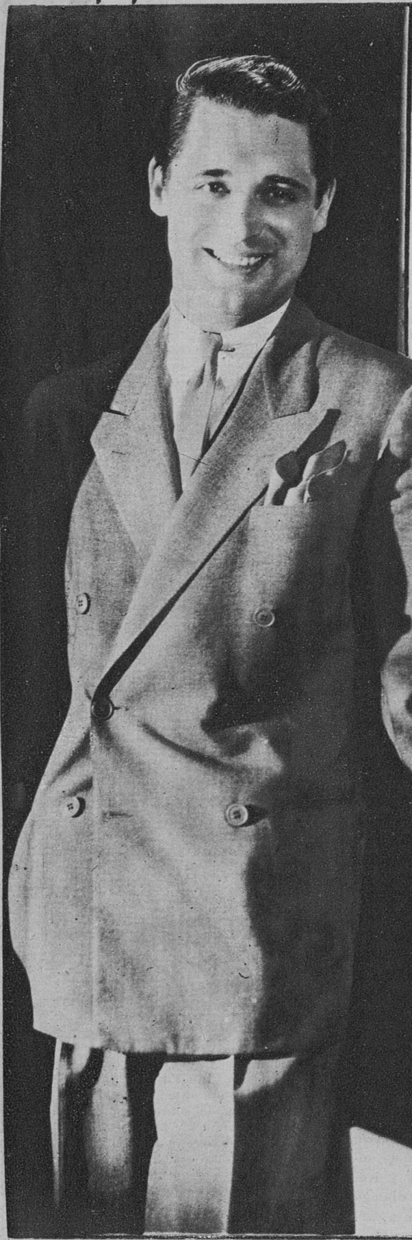
Gary Grant, nuevo galan de la Paramount