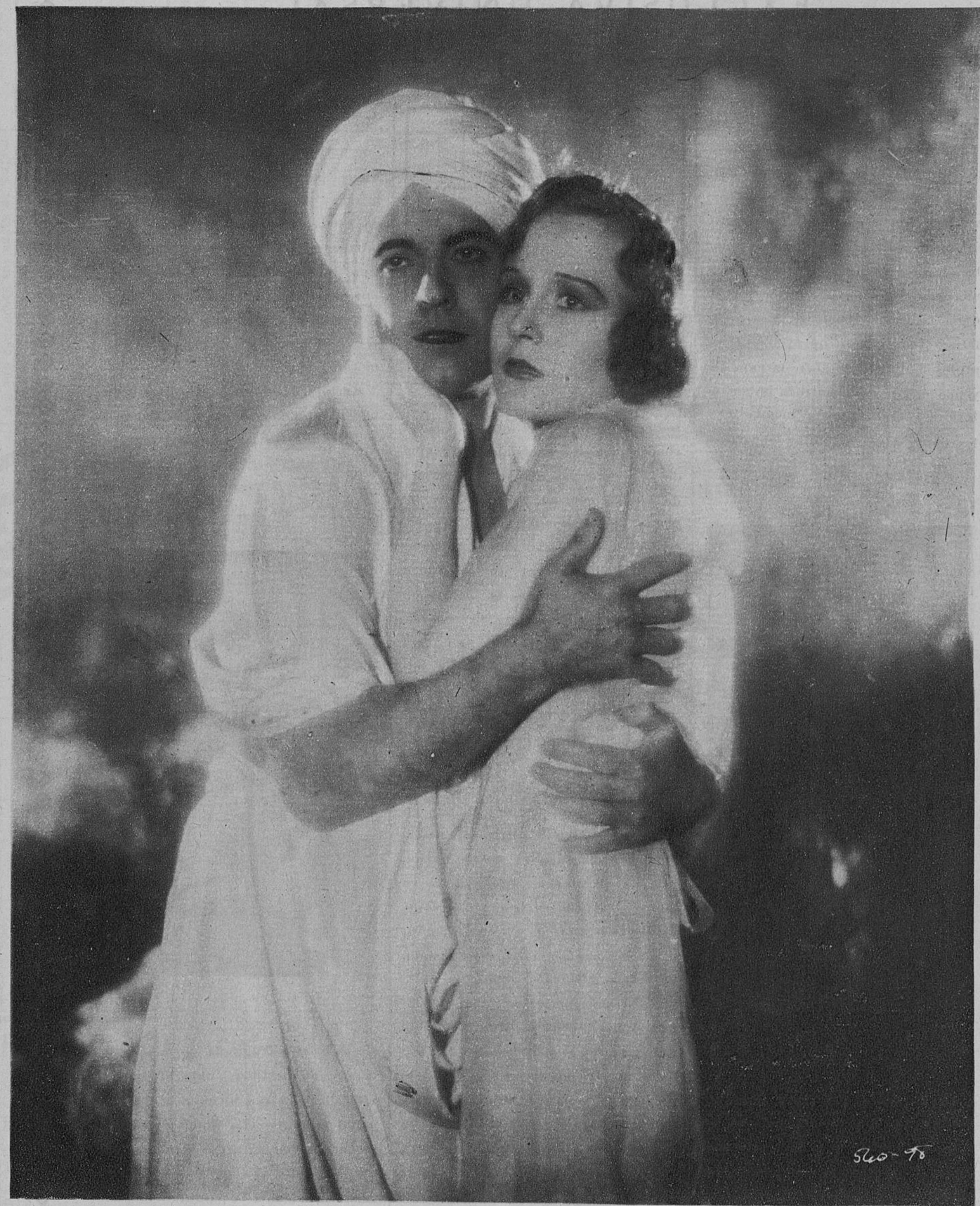
Ramón Novarro y Magde Evans, en un film impregnado de romanticismo y misterio, «El Hijo del Destino». Producción Metro Goldwyn Mayer