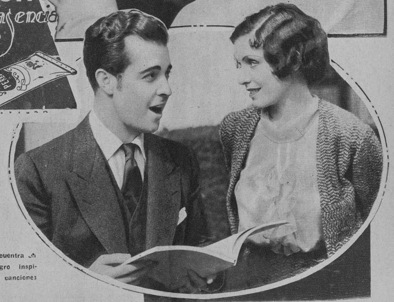
Ramón Novarro encuentra a Conchita Montenegro inspiración para sus canciones