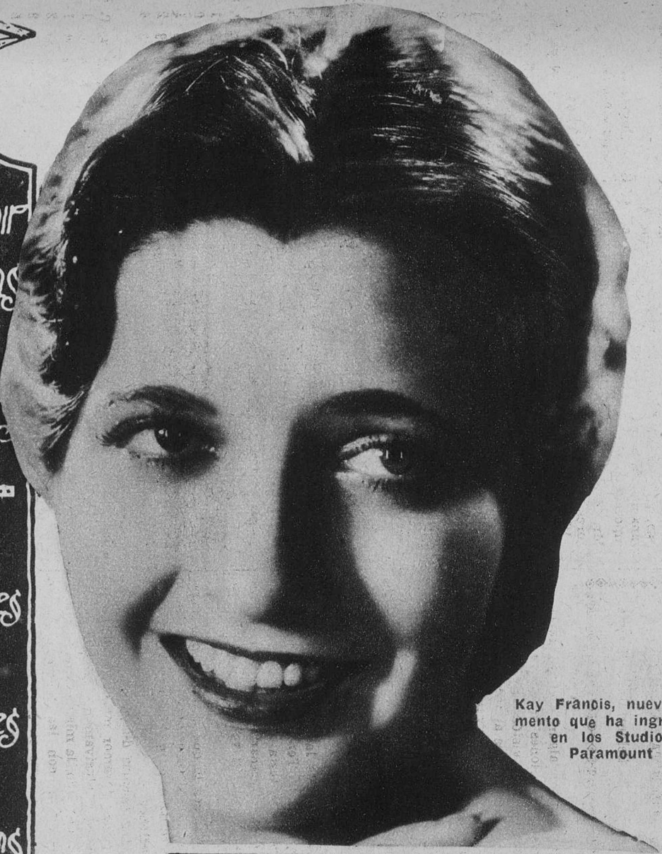
Kay Francis, nuevo elemento que ha ingresado en los Studios Paramount