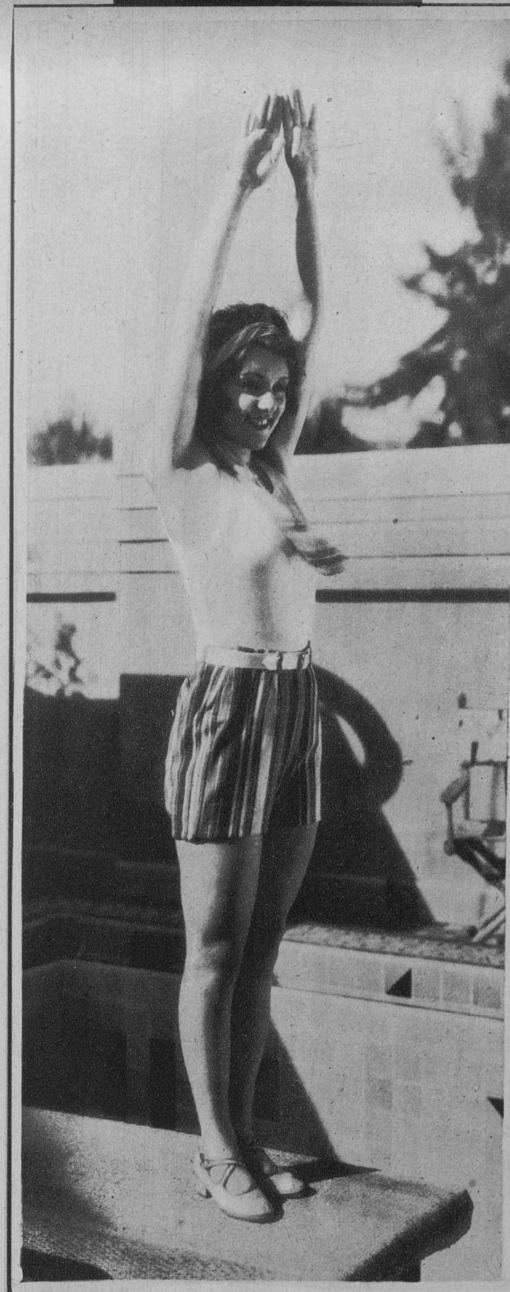
LILLIAN ROTH, LA CELEBRE COMICA DE «EL DESFILE DEL AMOR»