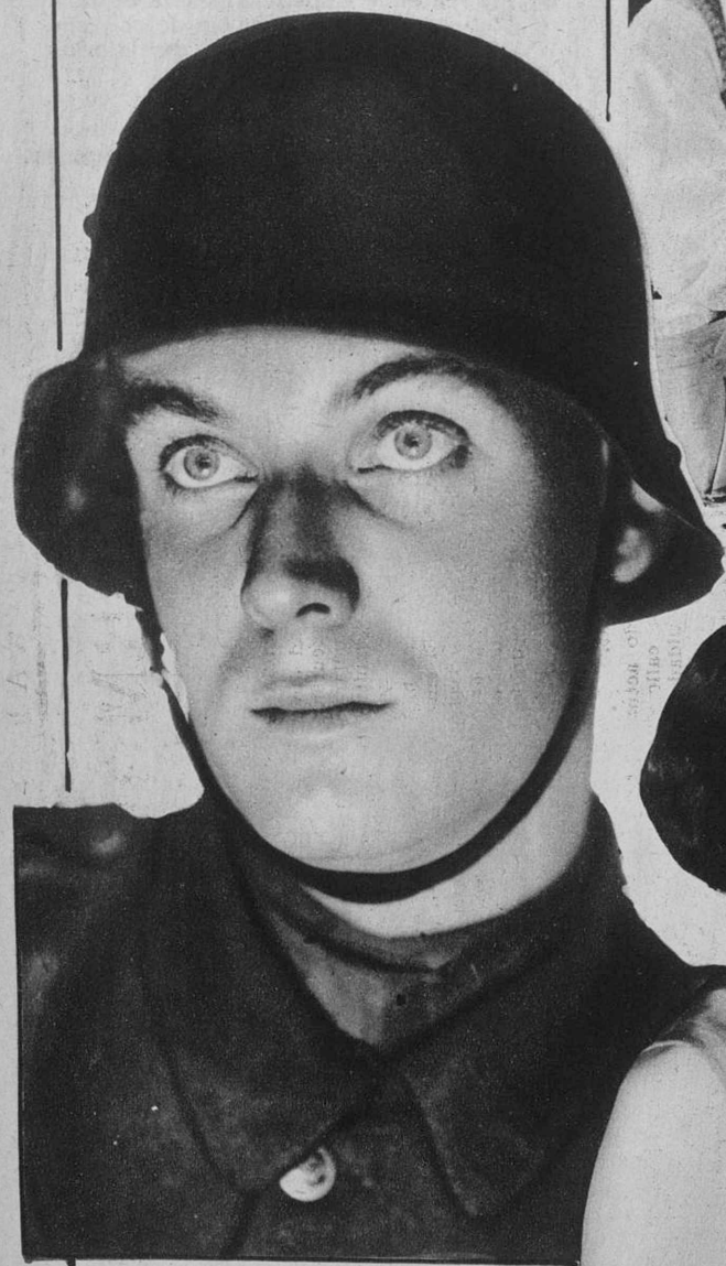
LEW AYRES, INTERPRETE PRINCIPAL DE «SIN NOVEDAD EN EL FRENTE», FILM SONORO DE LA UNIVERSAL, QUE ESTA OBTENIENDO TODOS LOS DIAS UN RUIDOSO EXITO EN EL TIVOLI