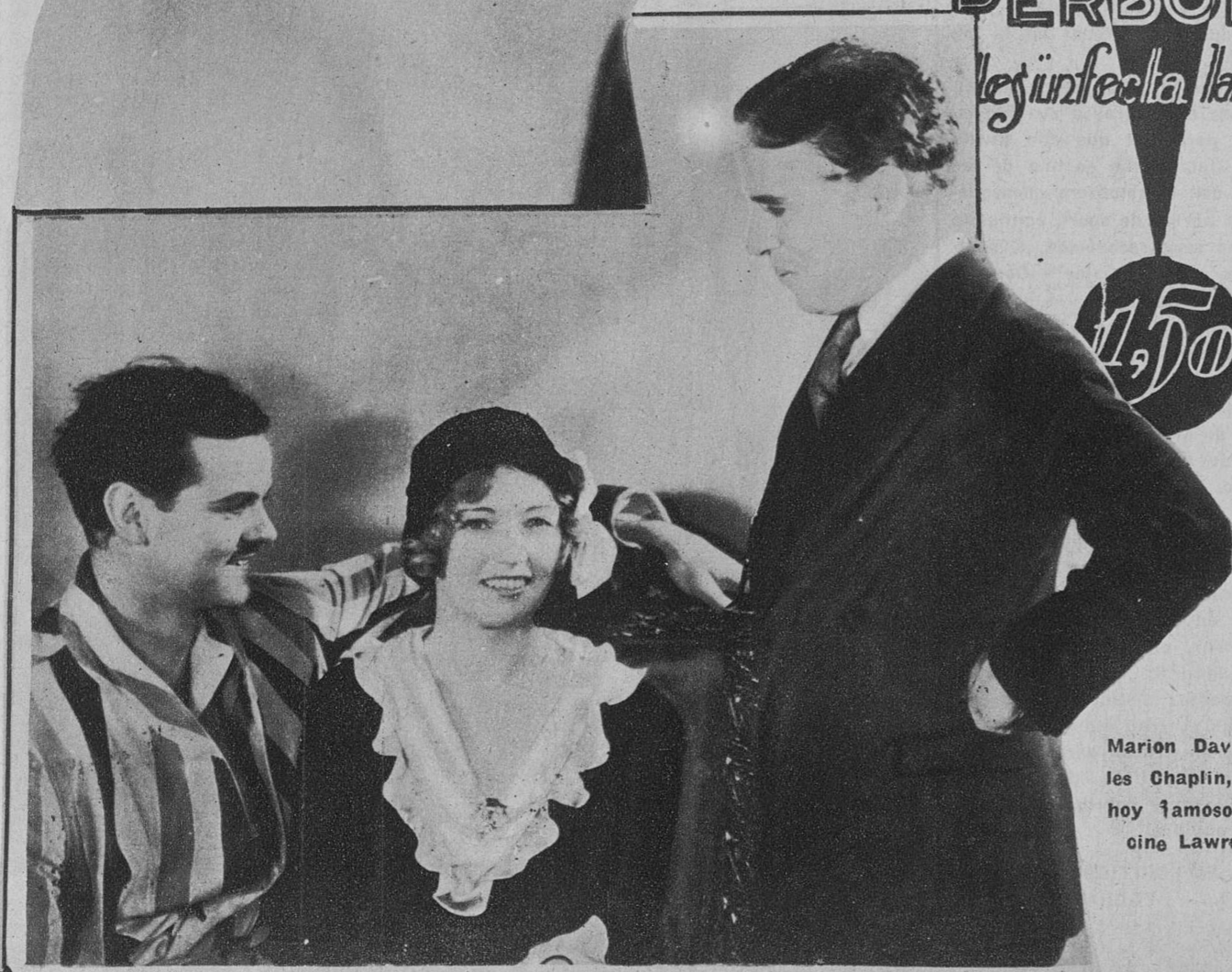
Marion Davies y Charles Chaplin, visitan al hoy famoso artista de cine Lawrence Tibet