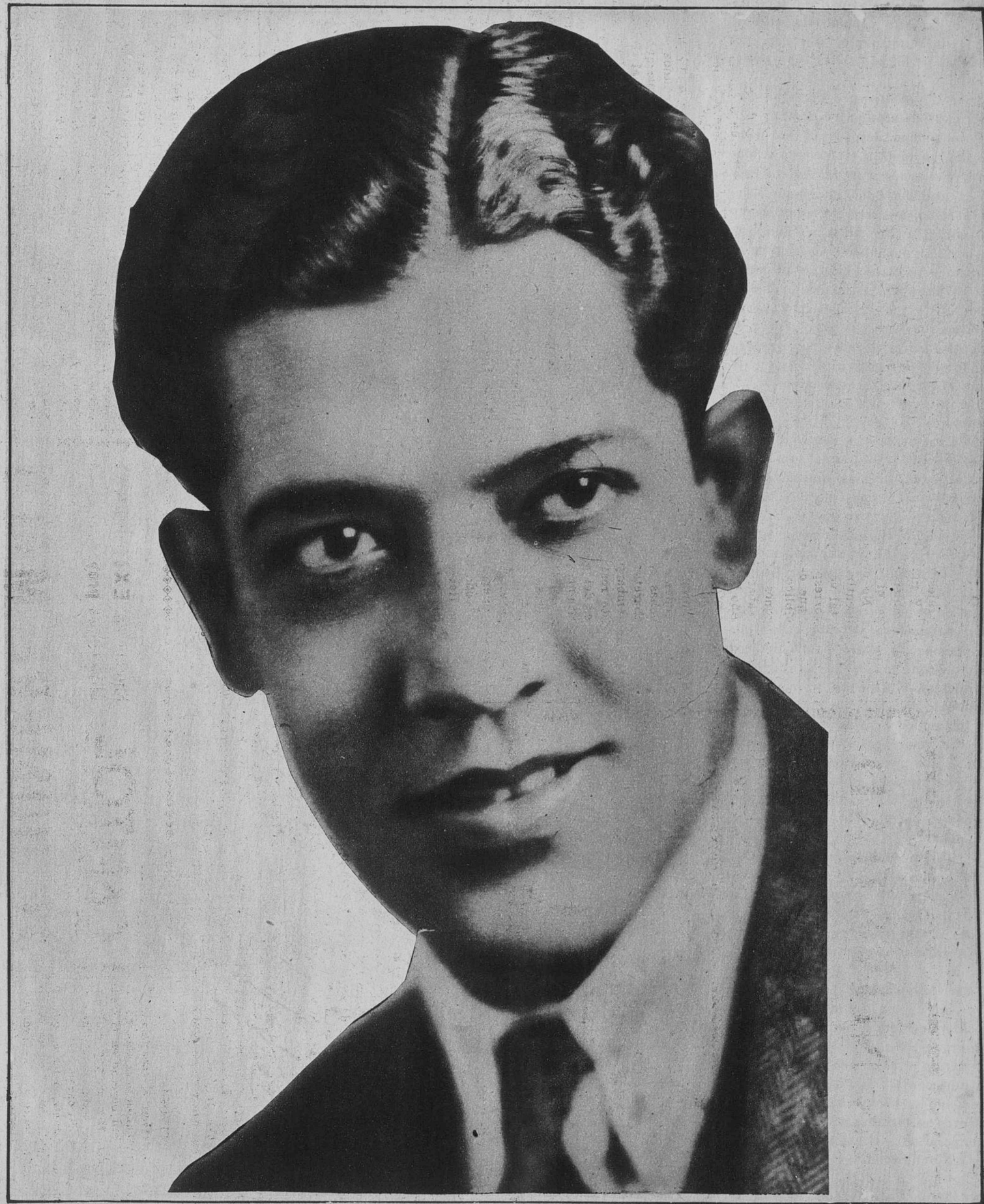
EL TENOR JOSE MOJICA, ARTISTA CINEMATOGRAFICO, QUE SE ENCUENTRA EN BARCELONA