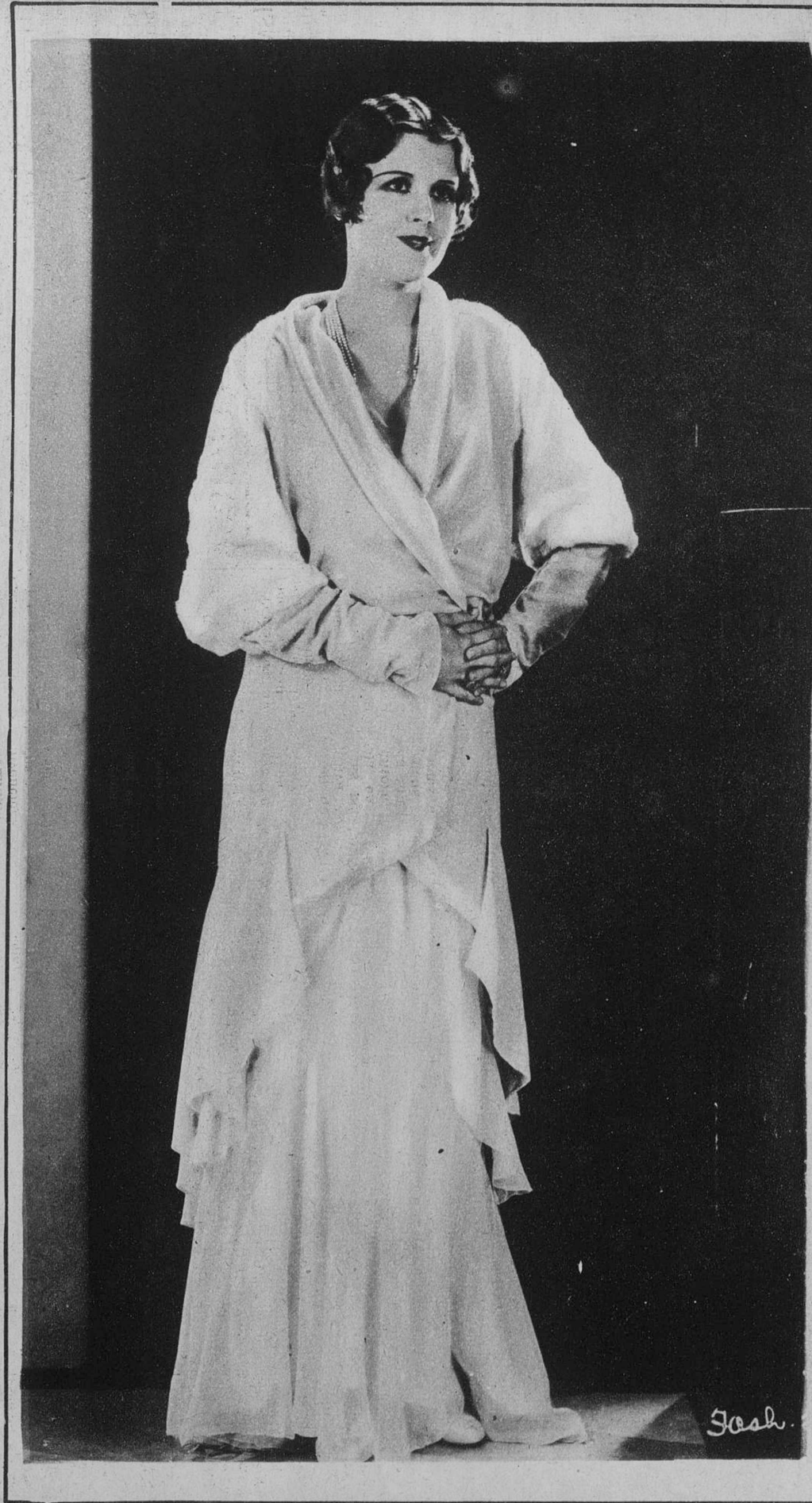
LA CELEBRE ARTISTA JUNE COLLYER, QUE SEGUN LOS RUMORES DE HOLLYWOOD, SE RETIRA DEL CINE