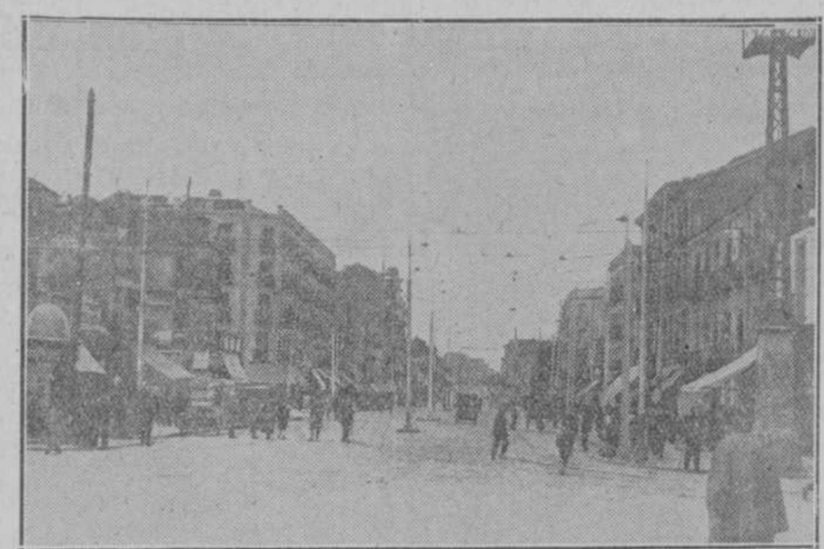
Las casas chatas de Bravo Murillo se agazapan, avergonzadas de los rascacielos.

mente ágil, más castizo en este barrio que en otro alguno.