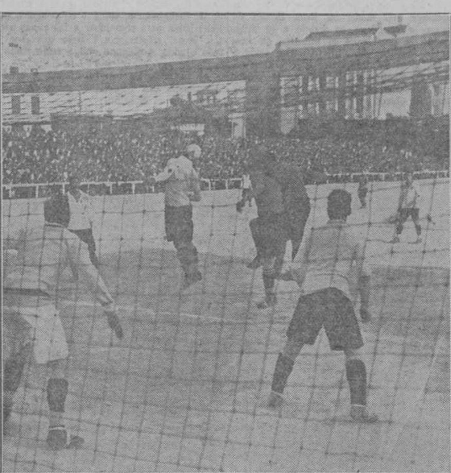
EL PARTIDO A BENEFICIO DEL COLO-COLO.—Un momento difícil para la puerta de los chilenos en el "match" jugado ayer entre este equipo y una selección del Centro.

Lisboa, 2; Madrid, 1. LISBOA 22.—En el partido anual de las guarniciones lisboeta y madrileña vencieron los primeros por dos a uno. El primer tiempo lo terminaron ambos "once" empatados a cero. Swansea, 2; Athlético, 1. BILBAO 22.—En San Mamés han jugado estos equipos, con buena entrada. El primer tiempo lo terminaron empatados a un tanto, logrado el local por Areta y el del equipo inglés por su interior derecha. En la segunda parte los ingleses, en un golpe franco, logran la victoria. El juego ha sido entretenido y el dominio alterno, distinguiéndose por los forasteros los medios y el extremo izquierda; del Athlético, Legarreta, Blasco y el portero, que lo ha sido el del Acero. Arbitro bien Arruaga.