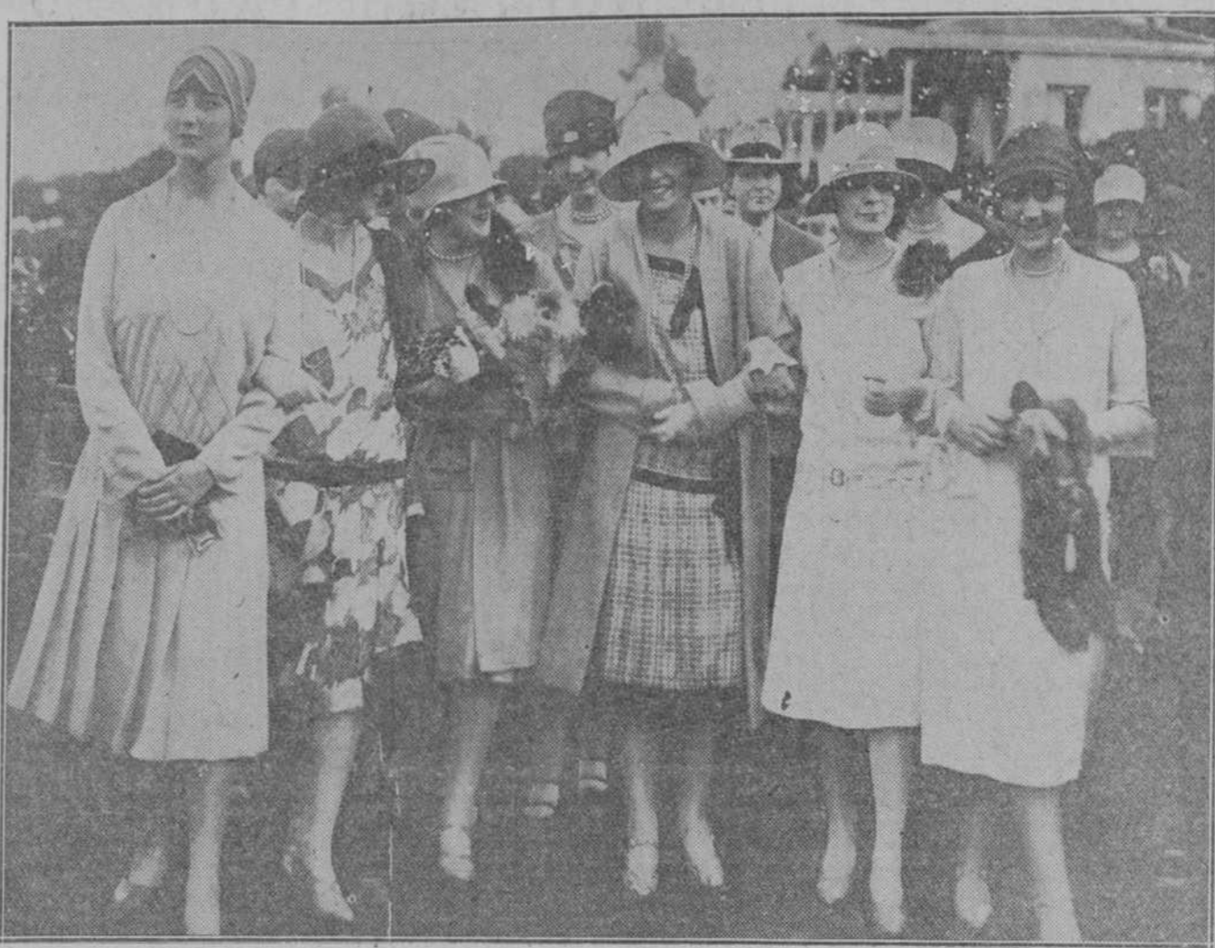
Un grupo de bellas muchachas paseando por el Hipódromo de la Castellana en la tarde de ayer.