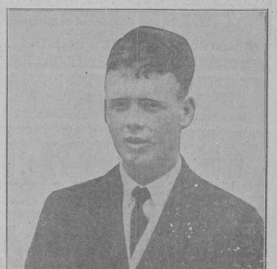
Lindbergh, la figura más destacada del momento deportivo del mundo. El joven aviador norteamericano, sobre su aparato "El Spirit of St. Louis", ha verificado la travesía aérea del Atlántico (Nueva York-París) en treinta y tres horas y media.