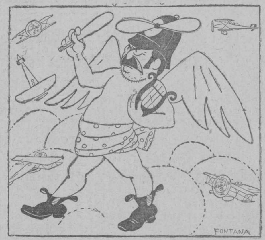
Como son muchos los vuelos organizados, y muchas también las desgracias ocurridas en los aires, las naciones han ideado este modelo de guardia de "la porra" para que ordene la circulación aérea.

Concurrieron numerosos fieles de esta capital, el Ayuntamiento y representaciones de Alcoy y otros pueblos.