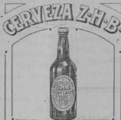
AGENTES PARA MARRUECOS CORIAT & CIA EN TANGER

Los señores Coriat y Compañía, agentes de la cerveza Z. H. B., tienen el honor de informar a su fiel clientela, que a pesar de la tan buena acogida que dió el público al concurso de cápsulas Z. H. B., efectuado en Diciembre del año pasado, este año se propone hacer un mayor regalo, que consiste en