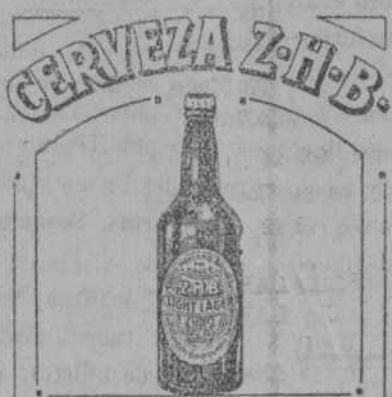
AGENTES PARA MARRUECOS CORIAT & CIA EN TANGER