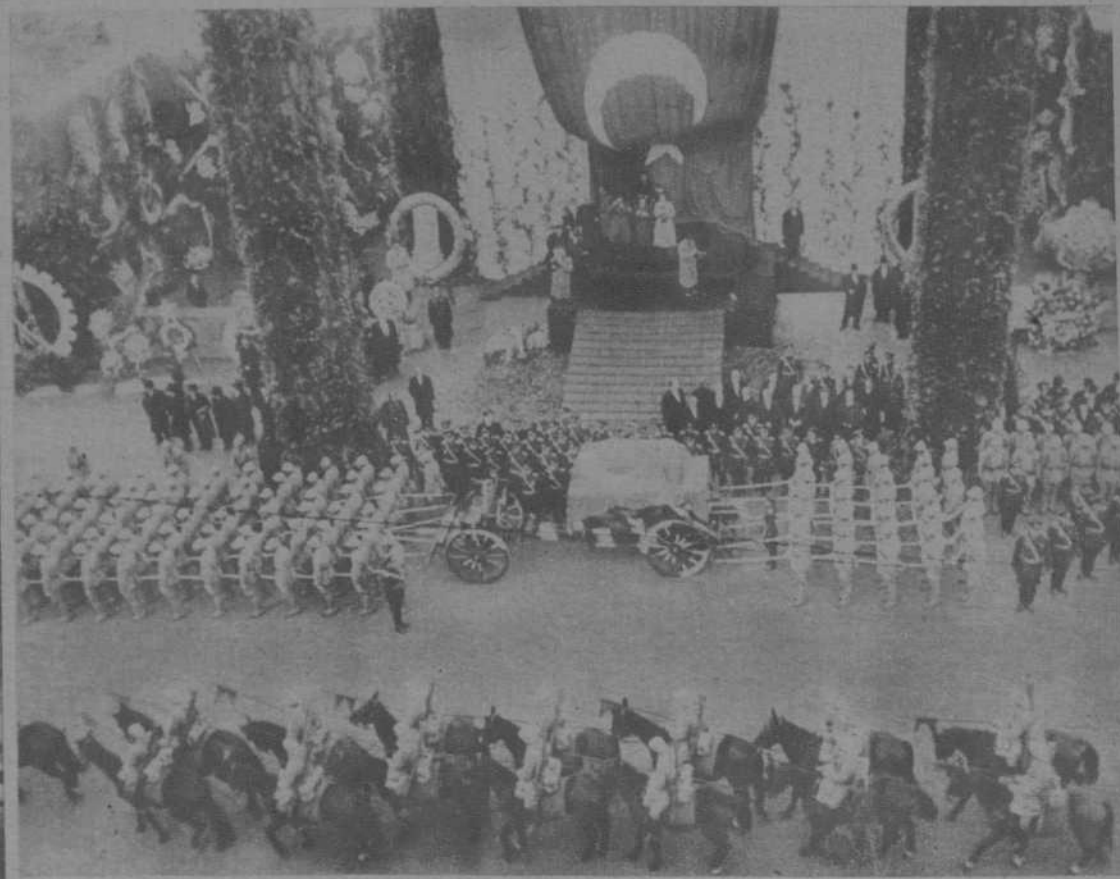
EL ARMON DE ARTILLERIA EN QUE FUE DEPOSITADO EL CADAVER DE KEMAL ATATURK, DESFILA ANTE EL PRESIDENTE INONU Y EL GOBIERNO