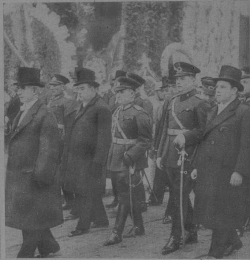
EL NUEVO PRESIDENTE DE TURQUIA ISMET INONU EN LA PRESIDENCIA DEL DUELO