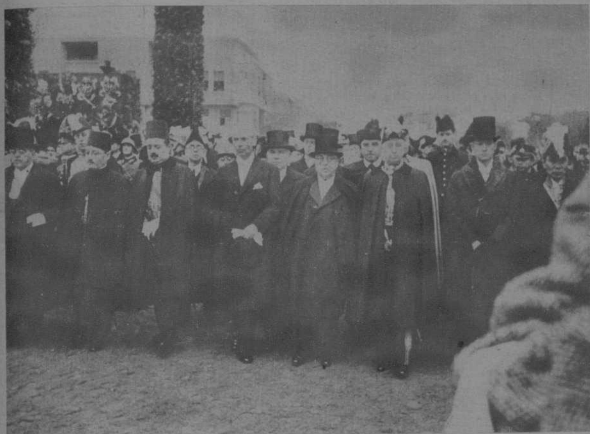
EL MINISTRO DE COMUNICACIONES Y TRASPORTES DE LA REPUBLICA ESPAÑOLA, SEÑOR GINER DE LOS RIOS, ENTRE LAS REPRESENTACIONES DE FRANCIA, EGIPTO Y GRECIA.

La Delegación del Gobierno Español presidida por el ministro de Comunicaciones y Transportes, don Bernardo Giner de los Ríos, que asistió al fúnebre acto