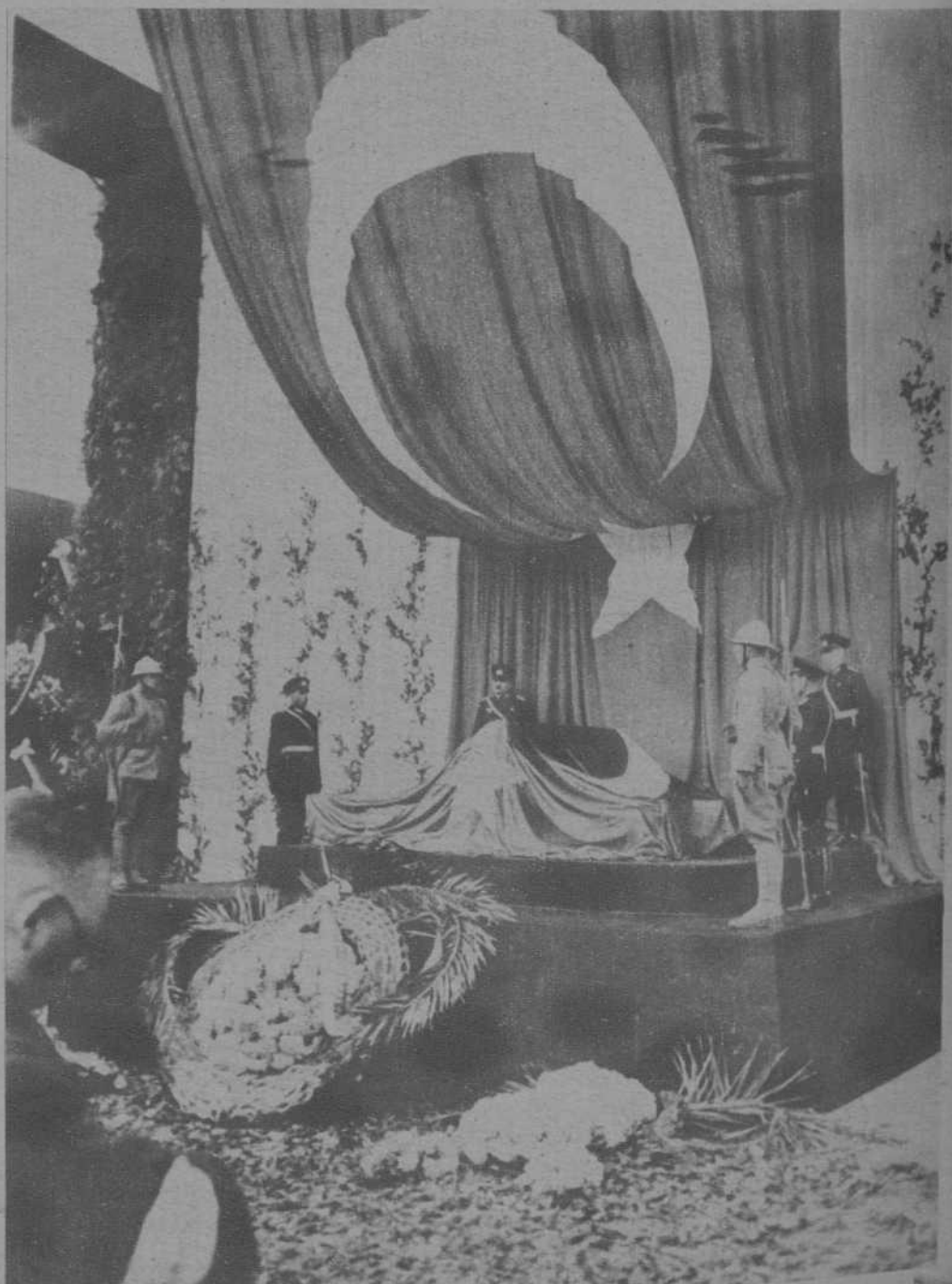
Ante el cadáver, antes del entierro, desfiló el pueblo turco