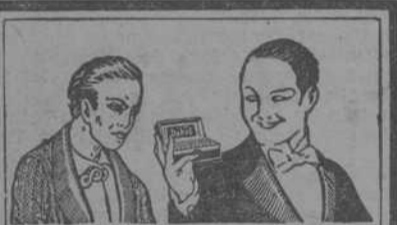
Si Ud. sufre del

3.º Deben declarar las partidas de perfume a granel preparada por ellos mismos y satisfacer el correspondiente cinco por ciento de tributación.