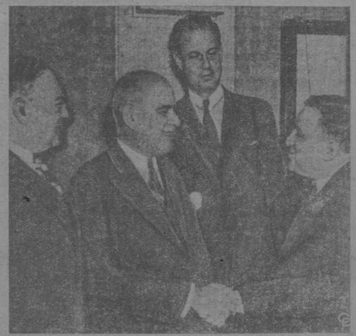
El alcalde de Nueva York, señor La Guardia, felicita al gobernador Lehman (el calvo), por su reelección