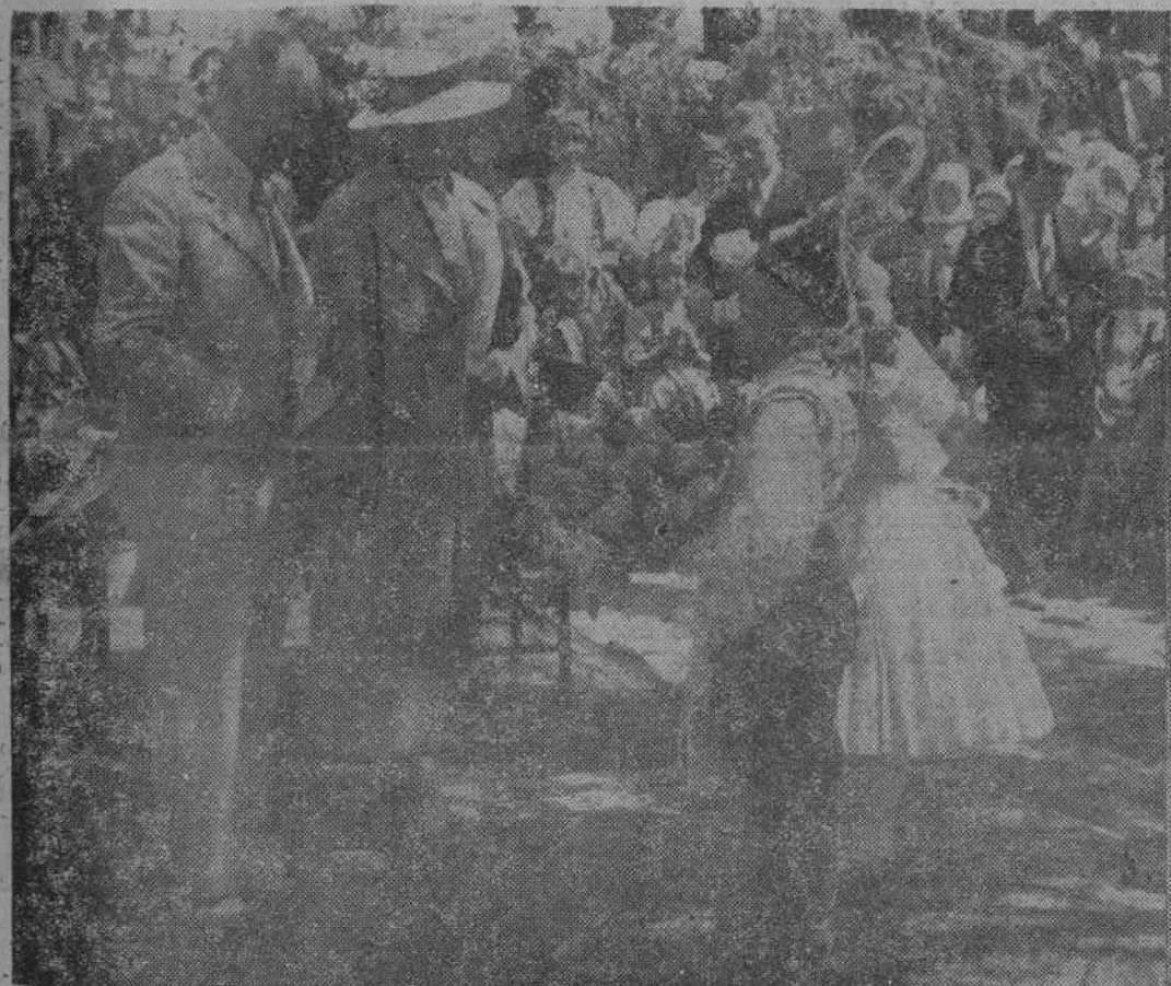
El presidente de Checoslovaquia, Eduardo Benes, en su viaje por la democrática República, que recobrada su independencia, sabrá mantenerla junto con la integridad de su territorio