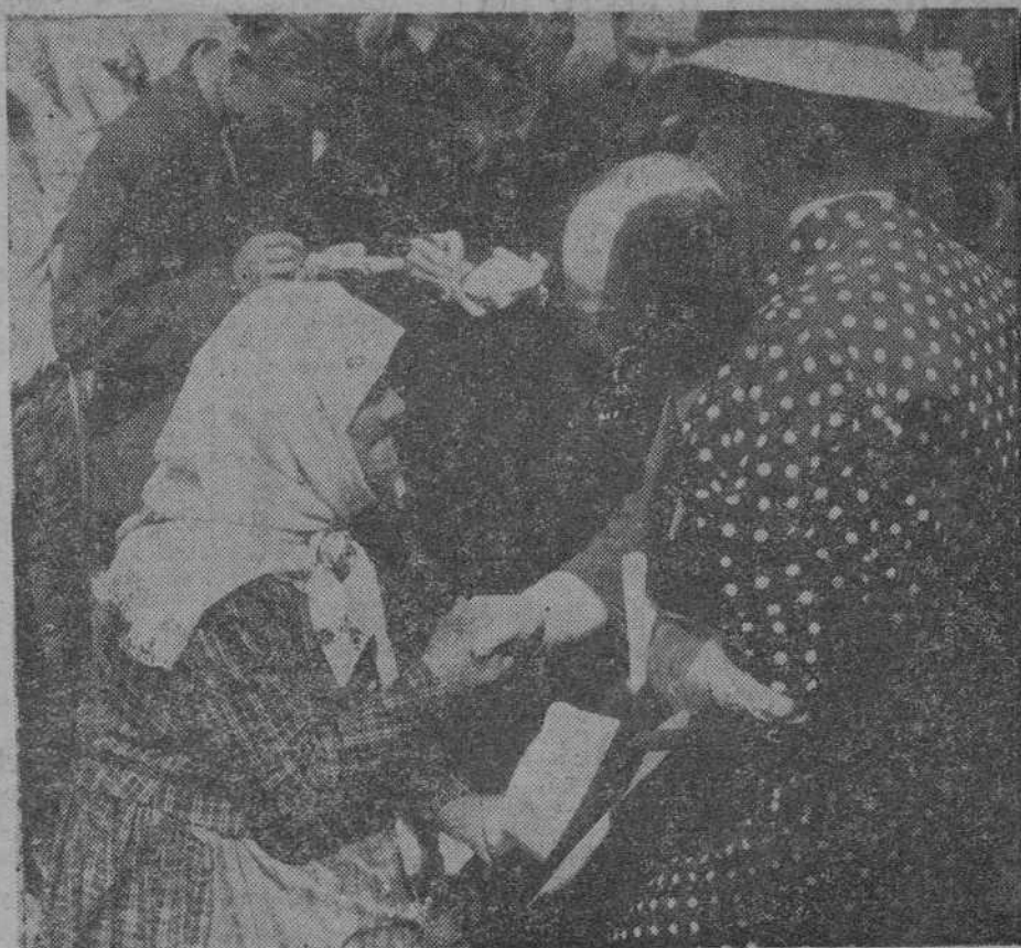
Dos aldeanos ofrecen flores a la señora Benes