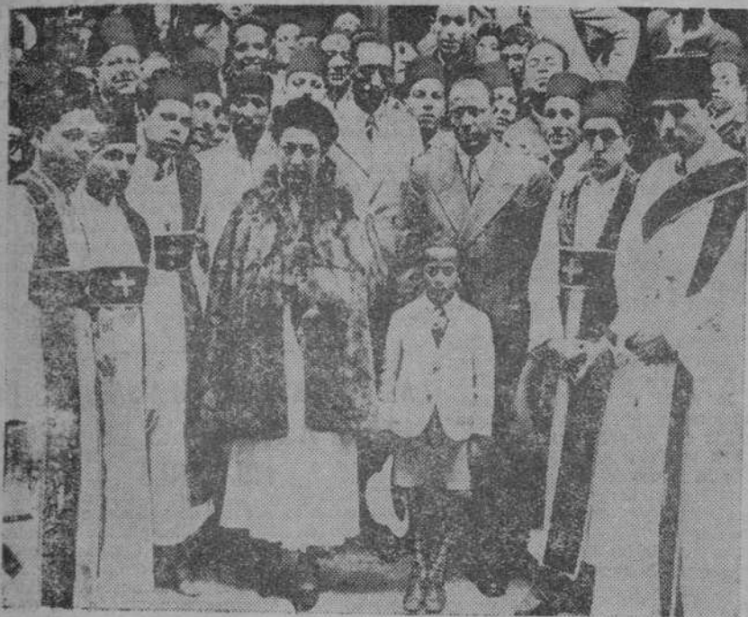
LA EMPERATRIZ DE ABISINIA Alejandria.—Al salir de la iglesia, con su hijo menor