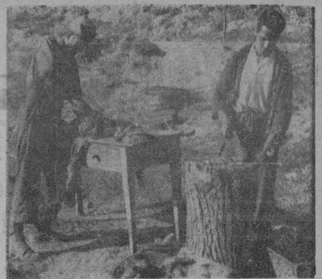
Los combatientes comen carne a diario. Los cocineros encargados de codimentarla