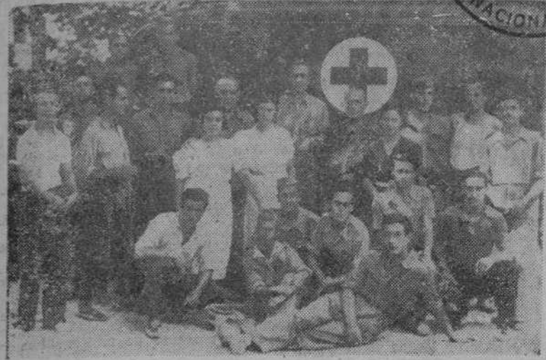
LA GUERRA EN EL FRENTE DEL CENTRO El personal del Hospital de Carabineros