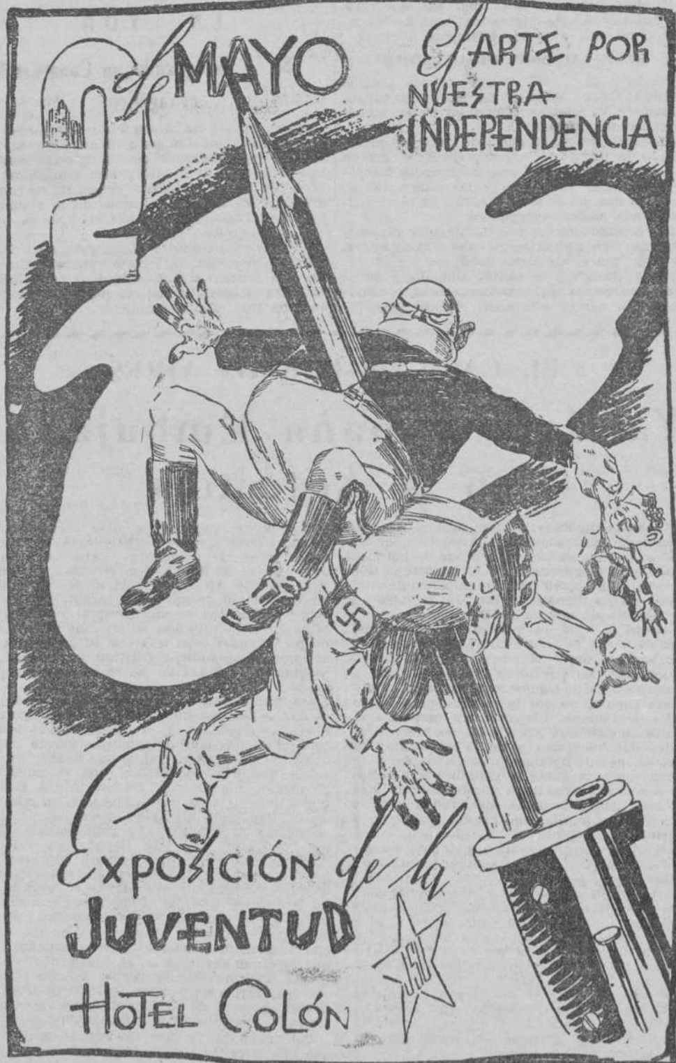
El día 2 se inaugurará en el Hotel Colón la Exposición de la Juventud. Compondrán el conjunto del certamen fotografías del frente, de la retaguardia y de la producción; cuadros, carteles, dibujos y esculturas que reflejan el heroísmo de nuestra juventud en lucha contra el fascismo.