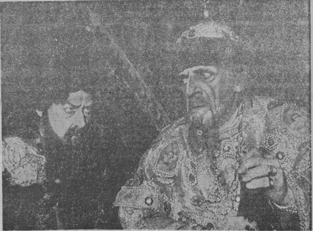
Una escena del segundo acto del drama de B. Ostrowski "vassilisa Melentieva", representado en el Teatro Dramático de Vladivostok (Extremo Oriente), por el actor Kissel, en el papel del Zar "el terrible"