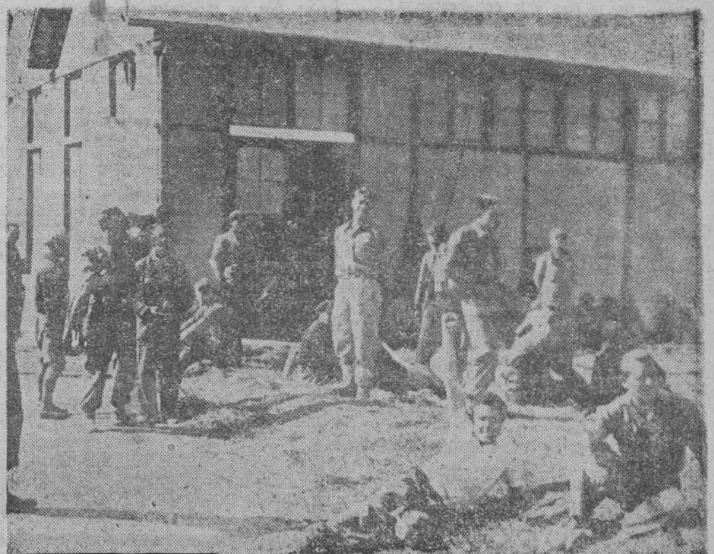
LOS SOLDADOS DE LA REPUBLICA ESPAÑOLA QUE PASARON LA FRONTERA FRANCESA Y HAN VUELTO A REINCORPORARSE AL EJERCITO PARA PROSEGUIR LA LUCHA Los soldados en Marignac