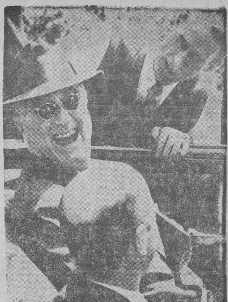
LAS VACACIONES DEL PRESIDENTE ROOSEVELT EN WARM SPRINGG (GEORGIA) El presidente de los Estados Unidos ha hecho detener su coche para hablar con los periodistas, y una agudeza de éstos la acoge con una risotada