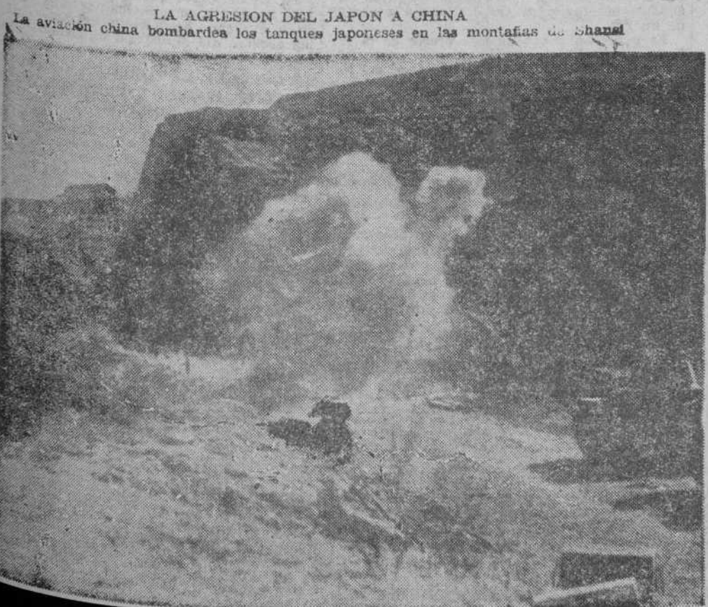
LA AGRESION DEL JAPON A CHINA La aviación china bombardea los tanques japoneses en las montañas de Shansi