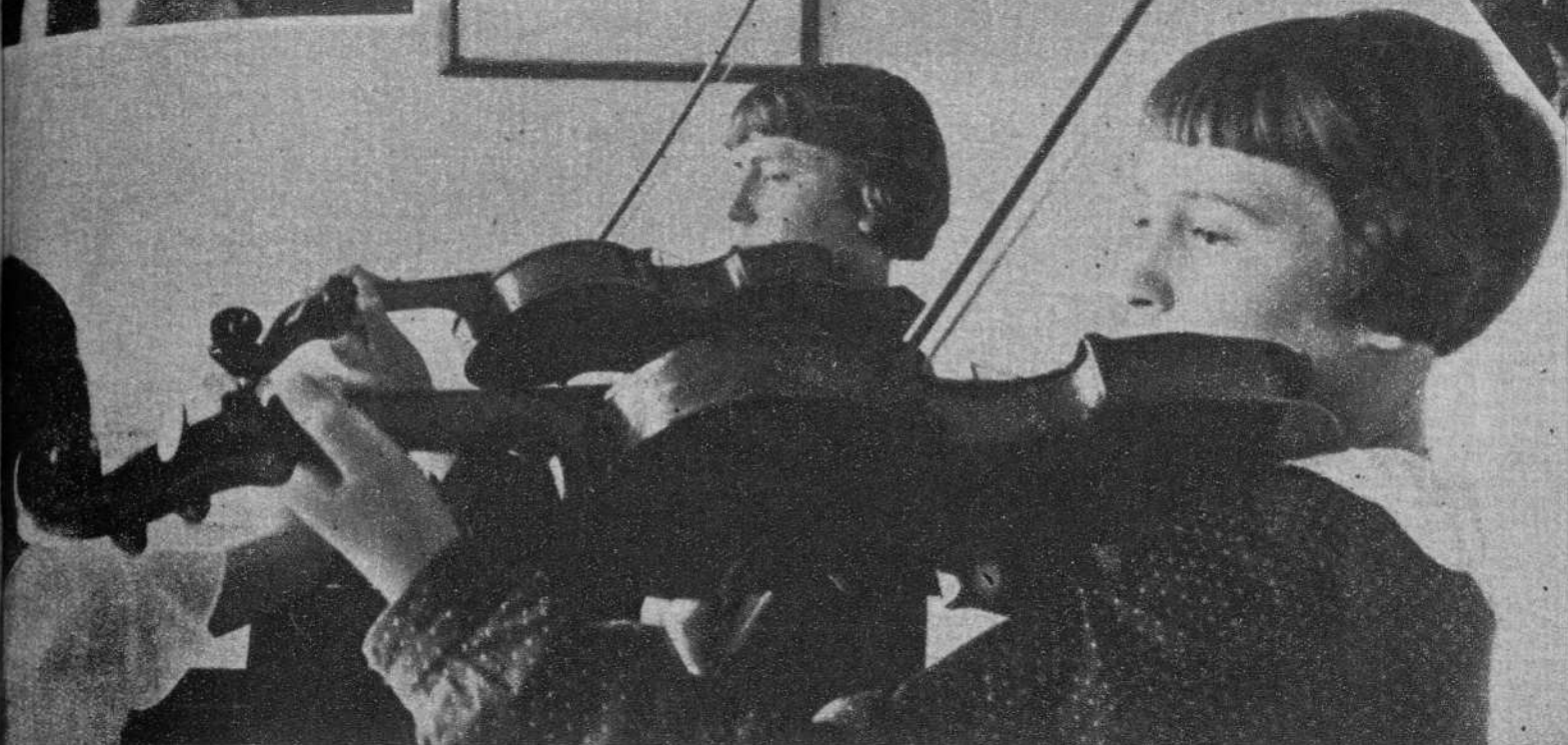
Alumnos de la Escuela Musical de Maguitogorsk