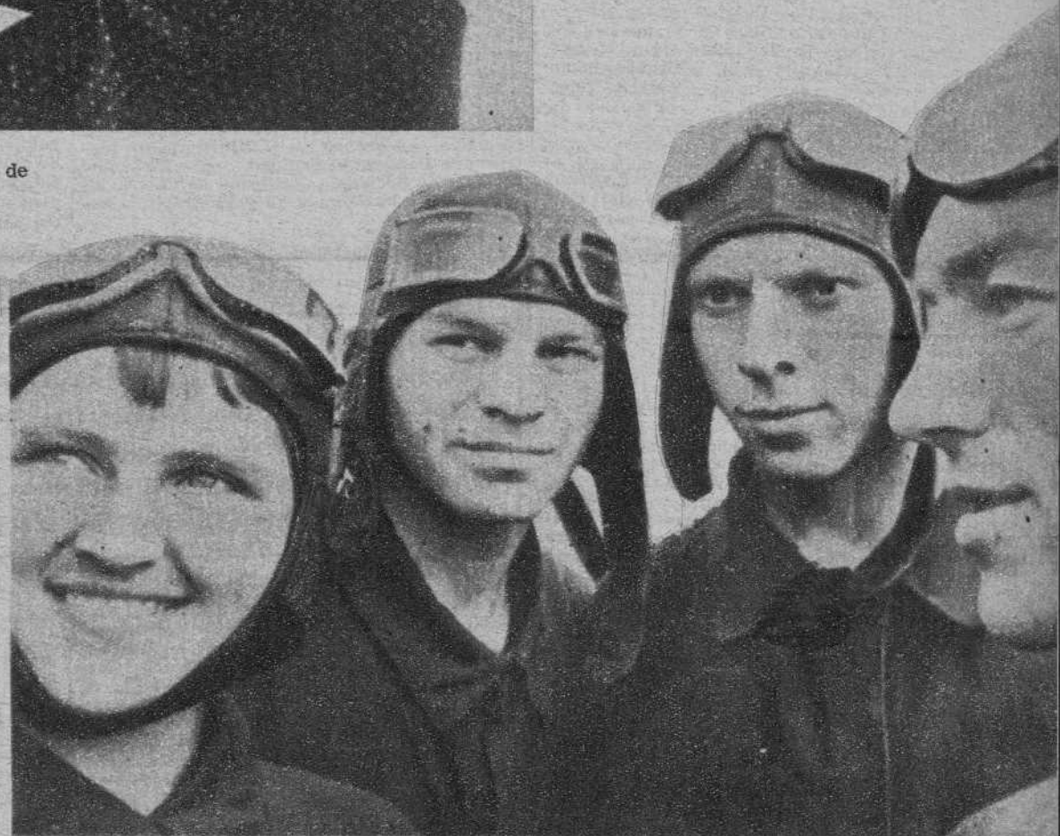
Un grupo de futuros aviadores de la fábrica metalúrgica de Maguitogorsk, cambiando impresiones del vuelo realizado