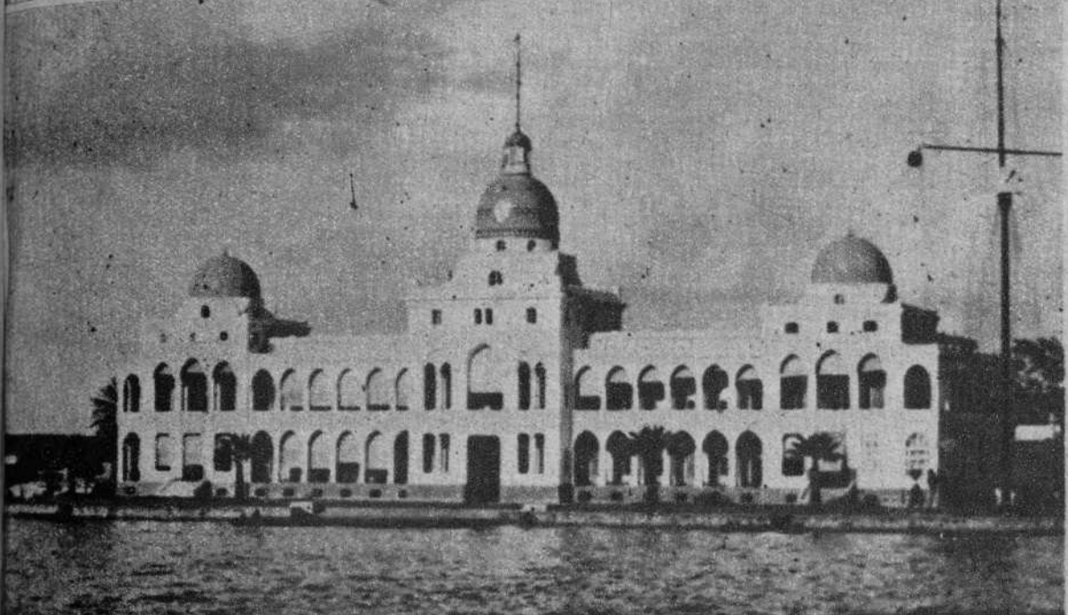
EL CANAL DE SUEZ. — Port Said. El edificio de la Compañía del Canal de Suez