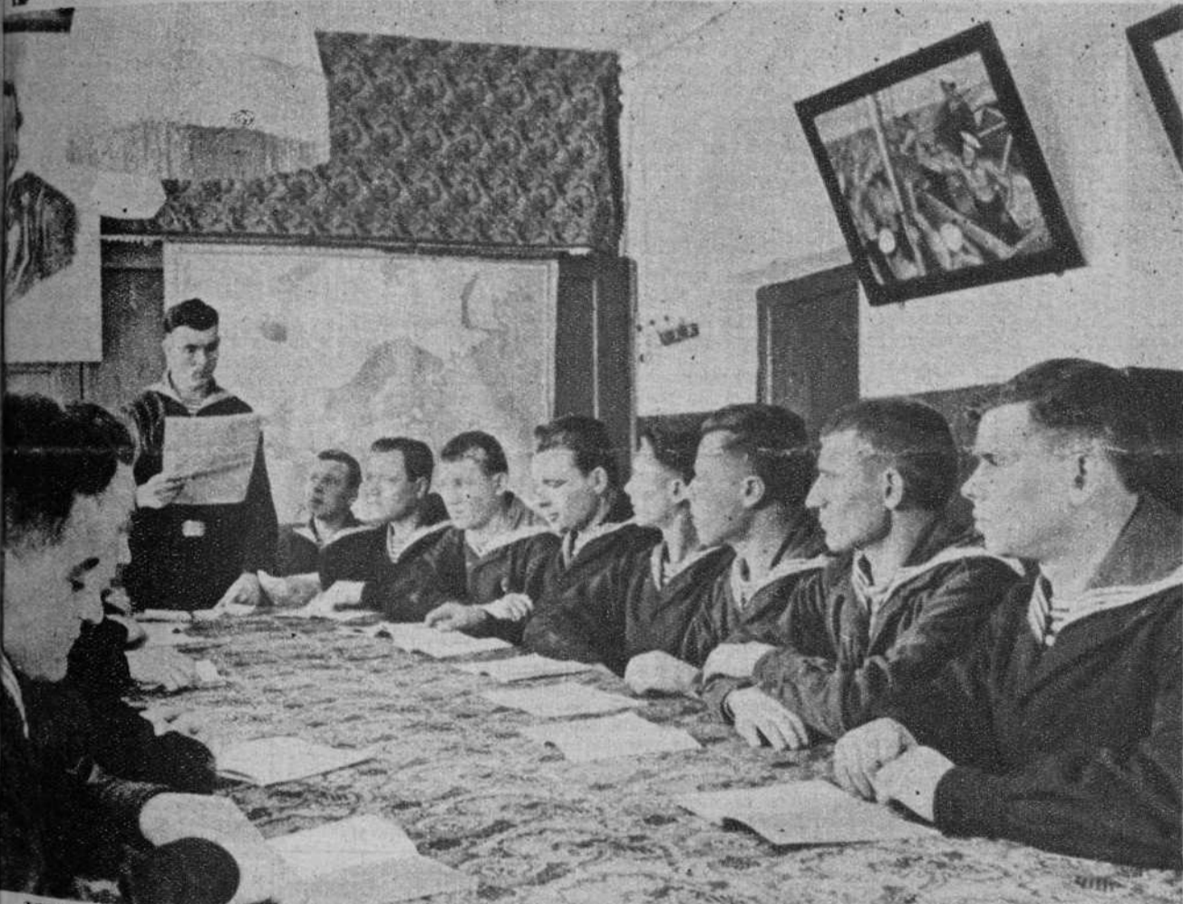
LOS MARINOS DE LA U. R. S. S. — Una clase a la rotación de uno de los buques de la Escuadra del Río Amor