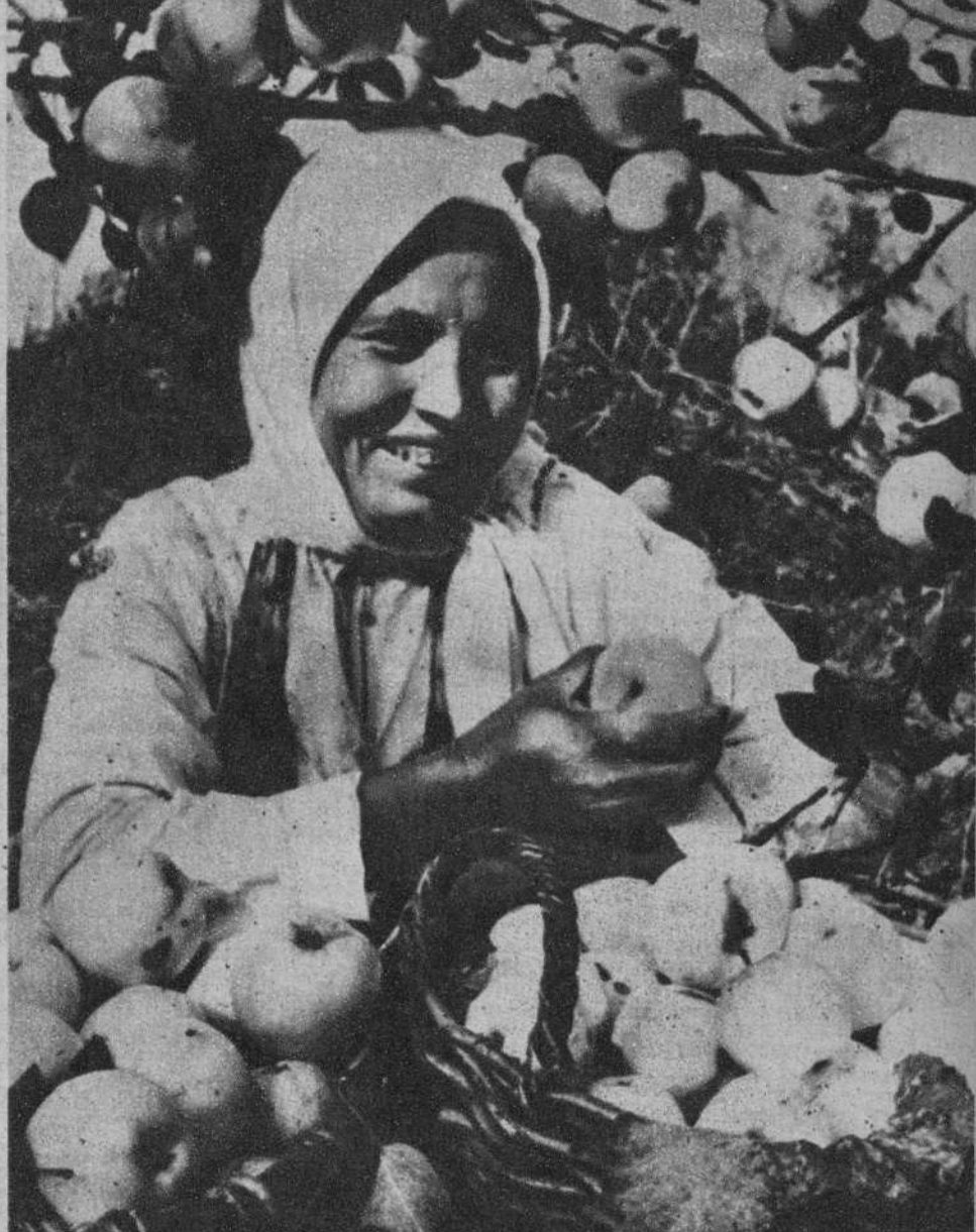
LA REPUBLICA AUTONOMA DE TCHUVAQUIA. — Antes de 1917, era la región más atrasada de Rusia. El 80 por 100 de su población era víctima del tracoma. La tierra se cultivaba con un arado primitivo. Ahora, empleando máquinas modernas, se obtienen abundantes cosechas. Véase la campesina, recogiendo manzanas; el viejo labrador, con su hija, ante el trigo cosechado, y las mandarinas dispuestas en cajas para ser exportadas