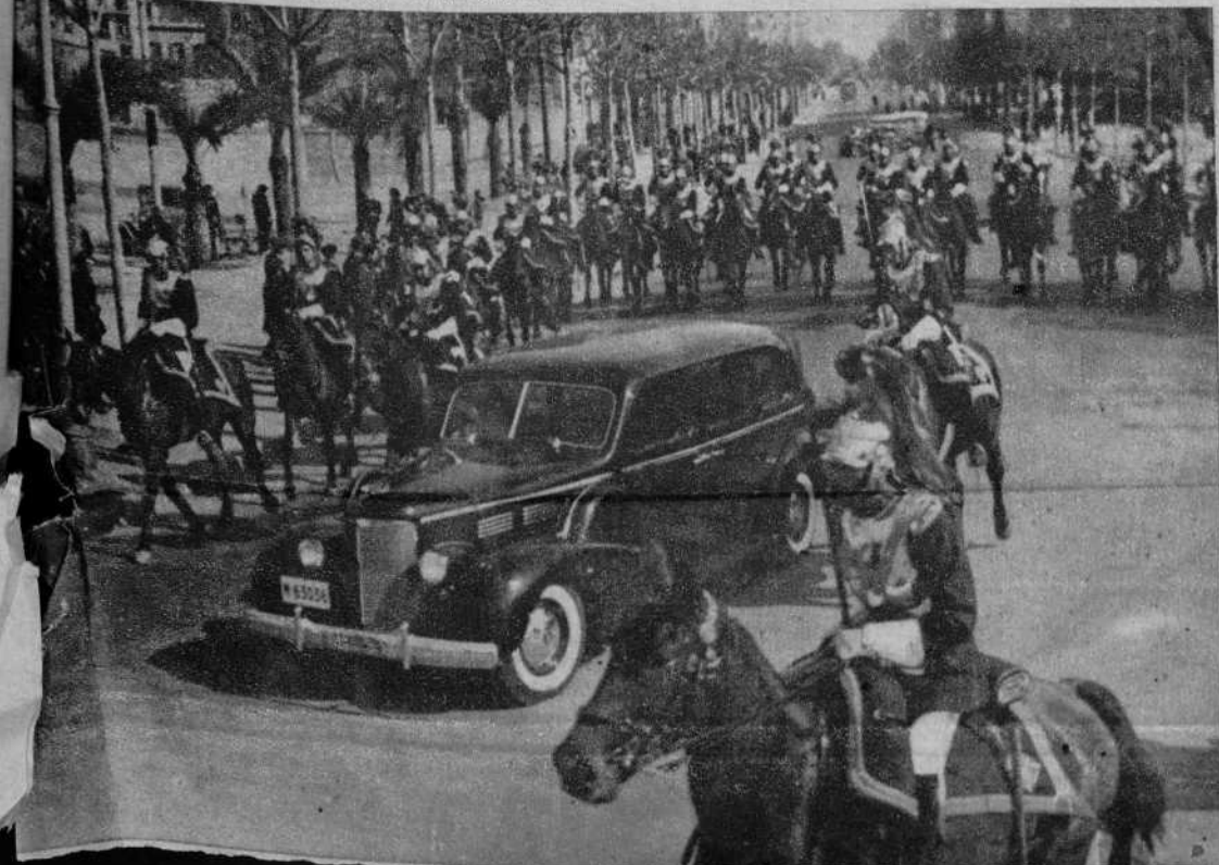
El coche en que iba el embajador de México, dirigiéndose a la Residencia Presidencial