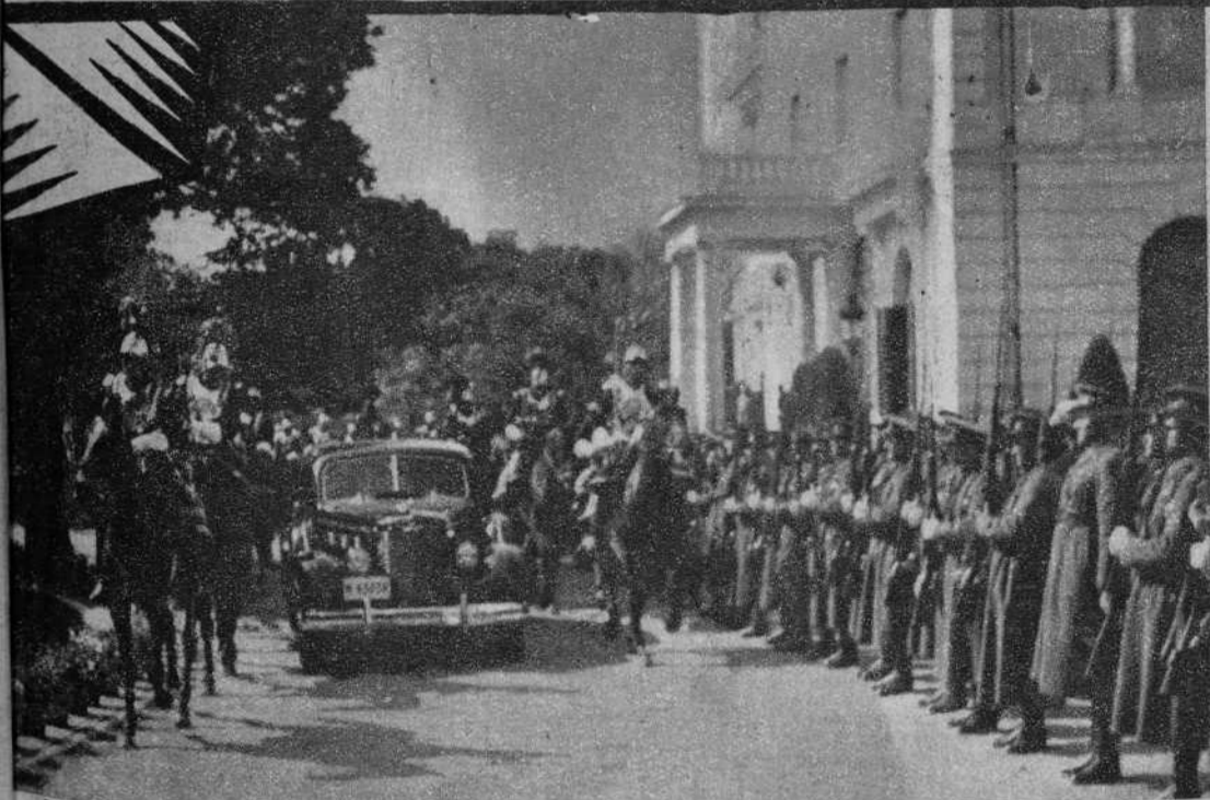
El batallón presidencial, rindiendo honores al embajador de México en España, don Adalberto Tejeda