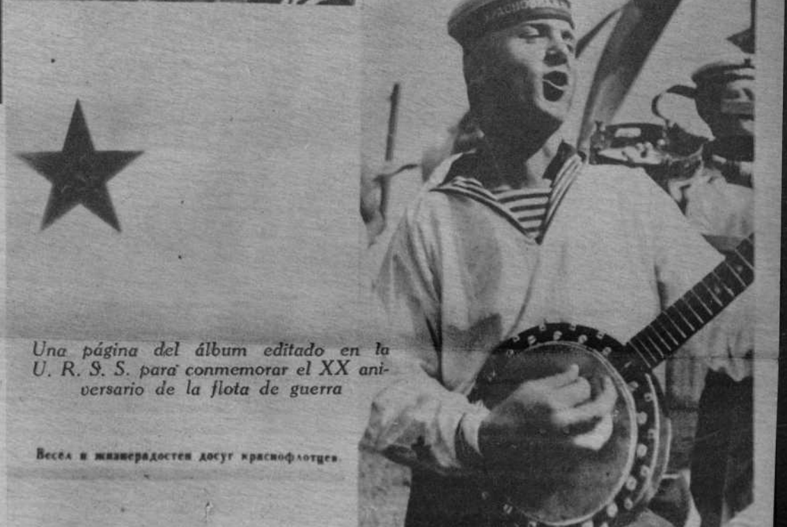
Una página del álbum editado en la U. R. S. S. para conmemorar el XX aniversario de la flota de guerra

Весел и живая радость досуг краснофлотцев