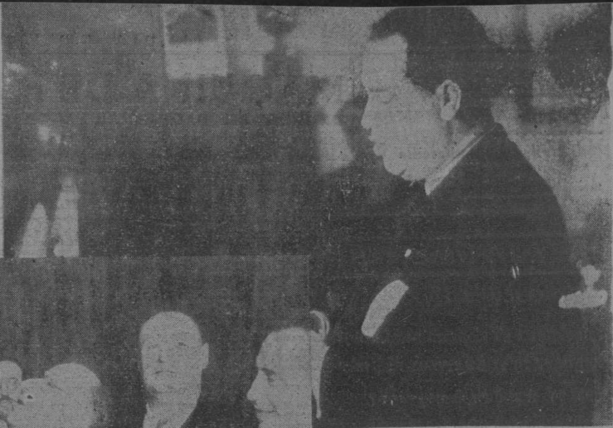
El alcalde de Barcelona, hablando ante el micrófono