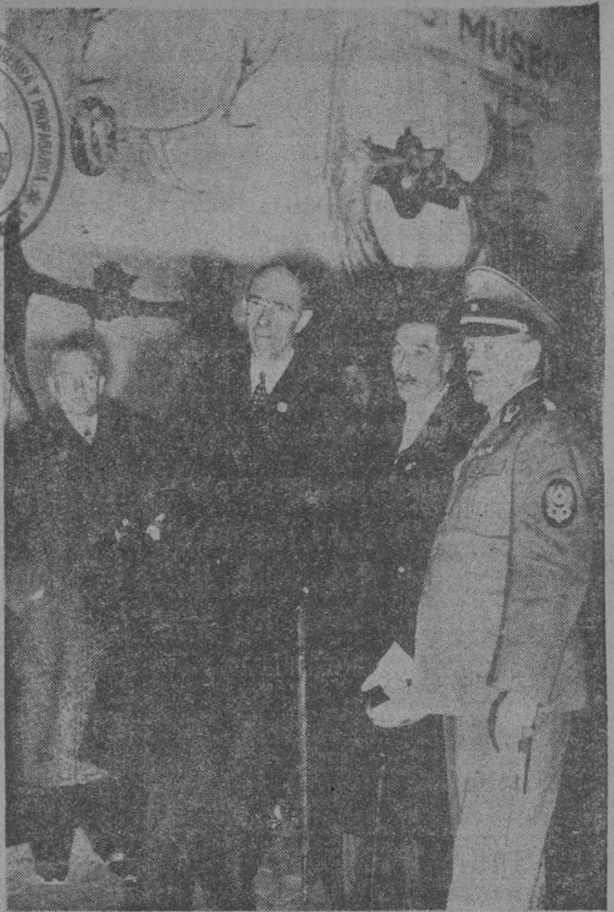
LA ESTANCIA DE LORD HALIFAX EN BERLÍN

Uno de los mejores amigos de España y de la República, es el diputado comunista Thorez, que, aprovechando su estancia en Barcelona, ha ido a visitar estos días varios sectores del Frente de Aragón