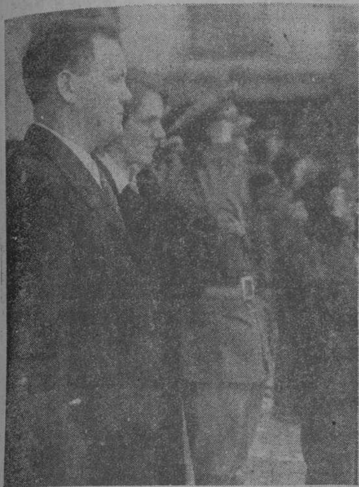
EL DIPUTADO FRANCÉS MAURICIO THOREZ Y SU ESPOSA, EN EL FRENTE DE ARAGÓN

Uno de los mejores amigos de España y de la República, es el diputado comunista Thorez, que, aprovechando su estancia en Barcelona, ha ido a visitar estos días varios sectores del Frente de Aragón