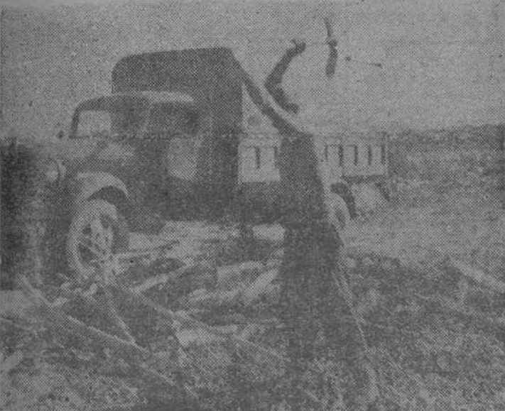
LA GUERRA EN EL FRENTE DEL CENTRO Preparando la leña para condimentar la comida diaria de los combatientes de la República

Su visita a la Exposición internacional de la Caza