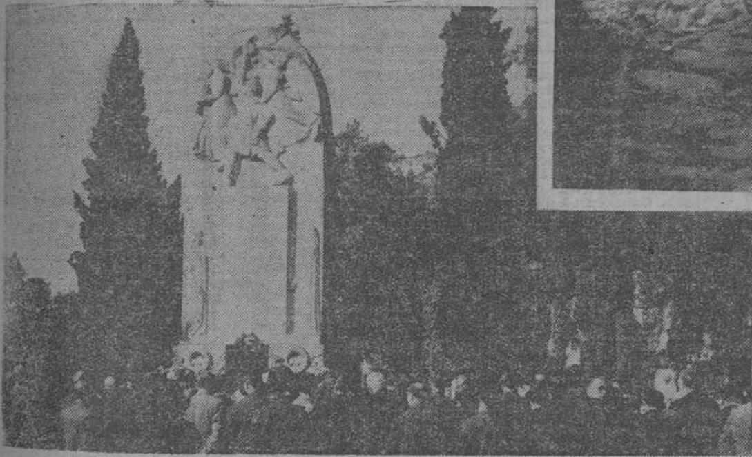
El homenaje en el Cementerio Nuevo

El homenaje a los soldados franceses y a los voluntarios catalanes muertos en Francia, rendido ayer mañana en el Cementerio Nuevo y en el Parque de la Ciudadela