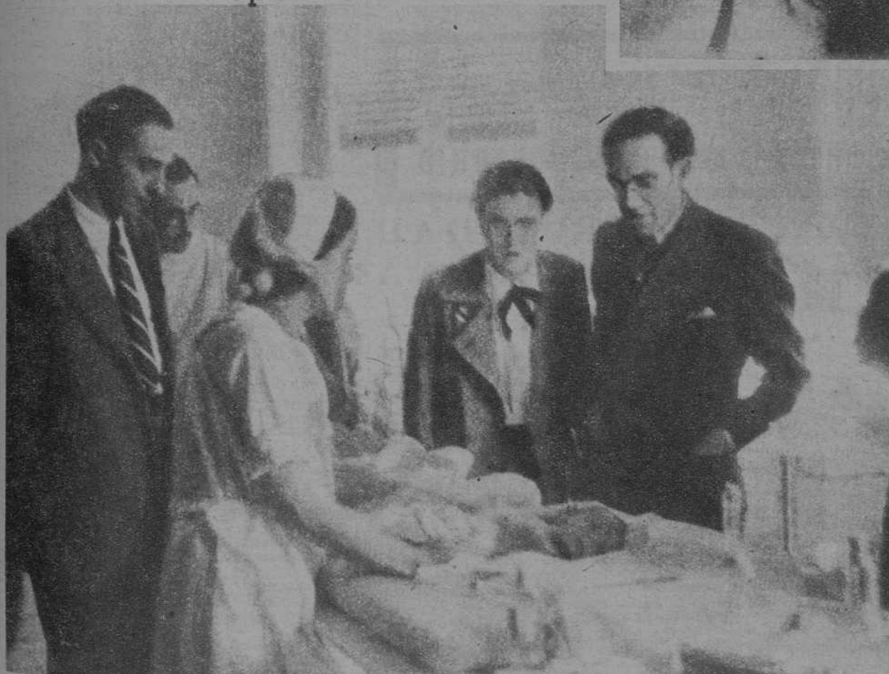
Madrid.—El ministro de Instrucción Pública, Jesús Hernández, ha inaugurado en la Casa Central de Maternidad un comedor para madres lactantes y embarazadas, instalado con el auxilio del Comité Suizo de Ayuda al Niño