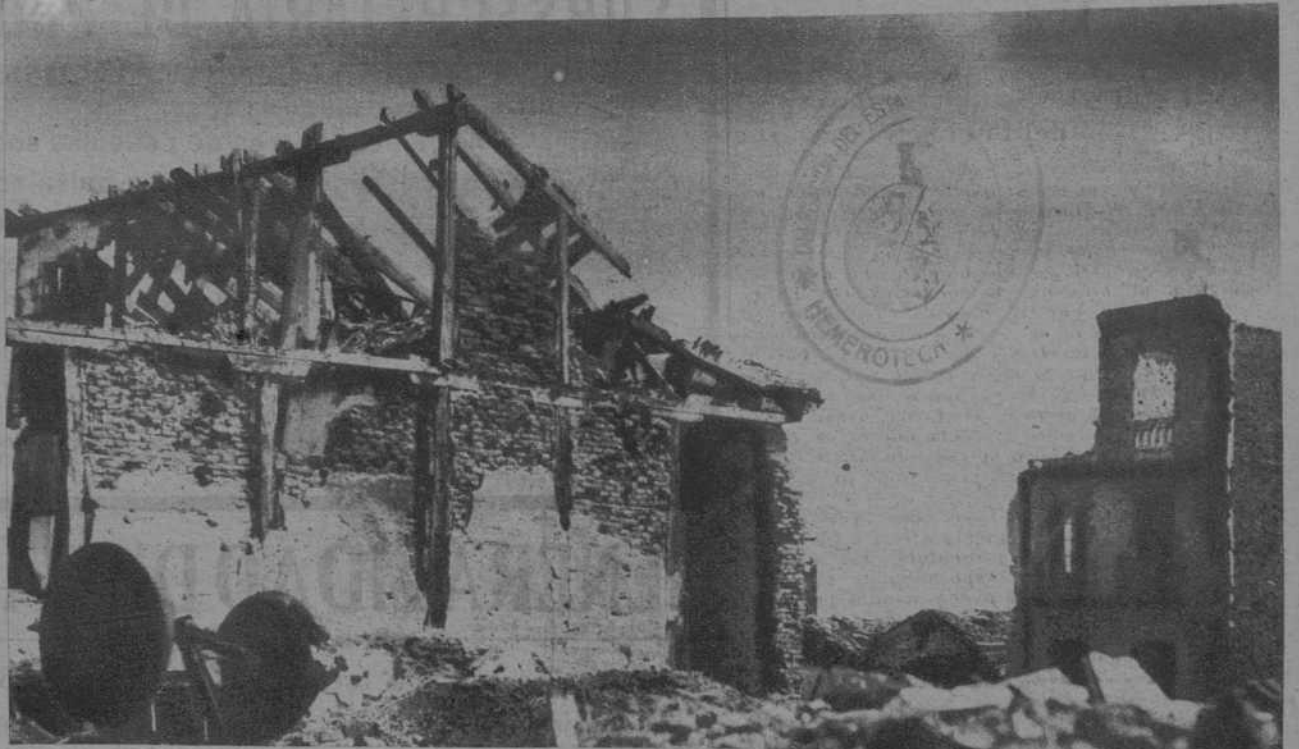
Restos de casas de las que fueron desalojados los facciosos

Posiciones enemigas en el sector de Carabanchel, vistas desde nuestras primeras líneas. Su defensa les cuesta a los facciosos bajas constantes, aparte de las causadas por las minas que con frecuencia las hacen volar