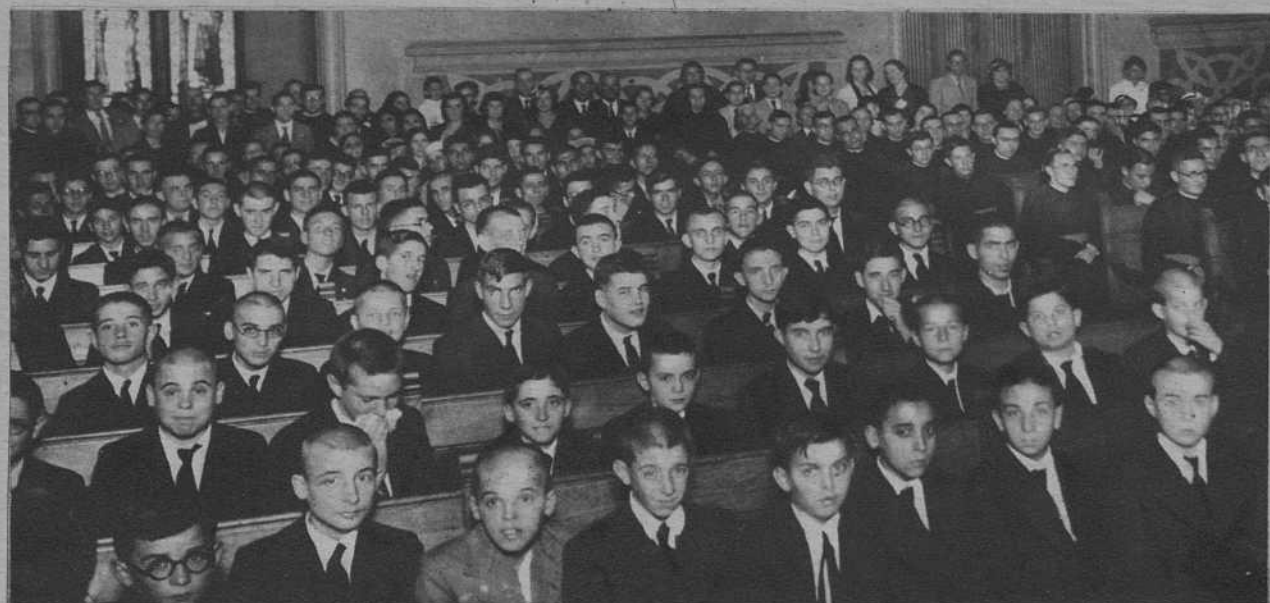
El salón de actos del Seminario, en la apertura de curso.