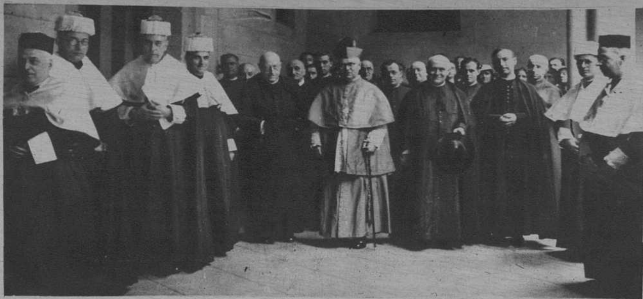
La apertura de curso en el Seminario, por el obispo