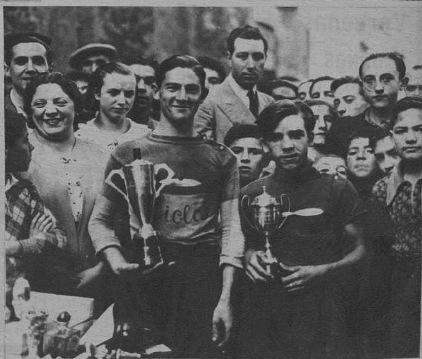
Camprodón. - Los clasificados en primero y segundo lugar en la carrera, y los premios que obtuvieron