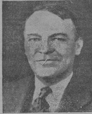
EL GENERAL JOHNSON

Hyde Park, 26. — El general Johnson ha presentado la dimisión del cargo de administrador de la N. R. A. al Presidente Roosevelt. En la carta el general Johnson pide al presidente que le deje libre en primero de octubre. Roosevelt ha contestado a la carta de Johnson diciendo que acepta la dimisión y que se complace en reconocer que su gestión al frente de la administración de la N. R. A. ha sido beneficiosa. Añade que en este momento tiene interés en confirmar la amistad que le une con el general Johnson. Aunque Roosevelt no lo haya dicho, parece que el llamado a suceder al general Johnson es el señor Donald Richberg, uno de los hombres que recientemente ha obtenido la amistad y el apoyo del Presidente. Se citan también, para suceder a Johnson, los señores Bernard Barruch y Raymond Moley. El primero ha desmentido que se le haya ofrecido este cargo y en cuanto al segundo no se sabe si ha desaparecido la divergencia con el secretario de Estado Cordell Hull, que motivó su dimisión al volver de la Conferencia Económica Mundial de Londres. Cualquiera que fuese el sucesor del general Johnson, se puede afirmar que la N. R. A. ha dejado su fase formativa para entrar en una fase de realización y estabilidad.—Fabra.