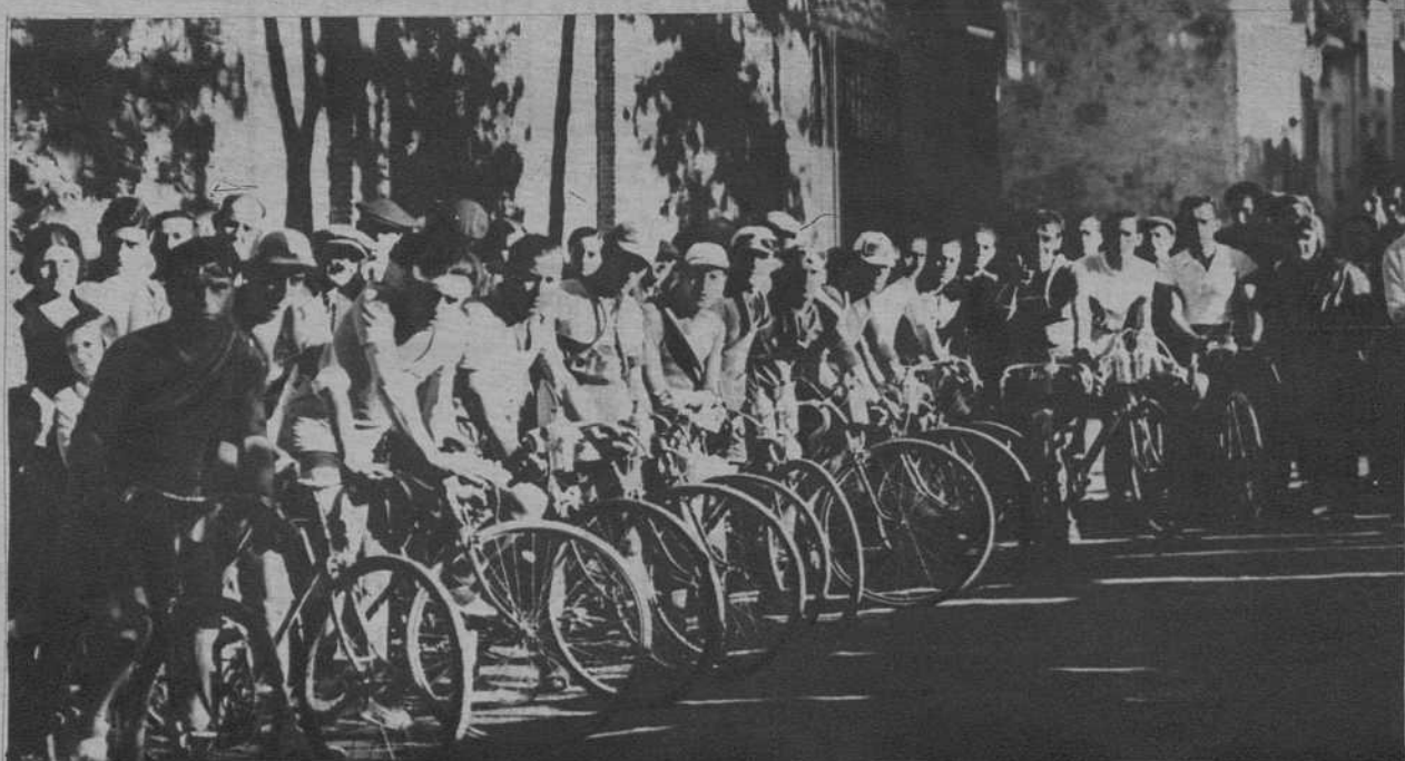
Camprodón. - Los ciclistas participantes en la carrera organizada por «Renaixença»