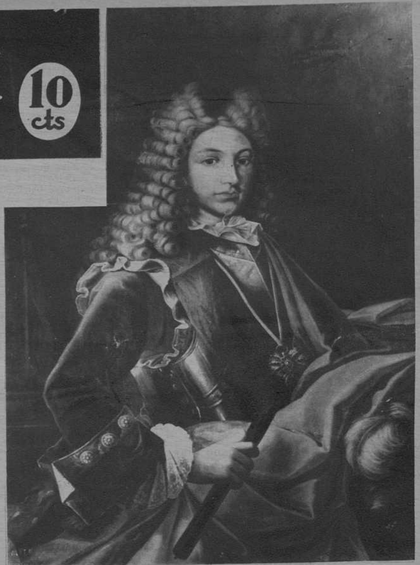
Retrato de Felipe V, que figura en la Galería de Retratos del Palacio de Justicia.

EL ORIGINAL DEL DECRETO DE FELIPE V DE NUEVA PLANTA, HA SIDO ENCONTRADO. POR DICHO DECRETO LE FUERON ARREBATADAS A CATALUÑA SUS LIBERTADES AUTONÓMICAS, EN 1716