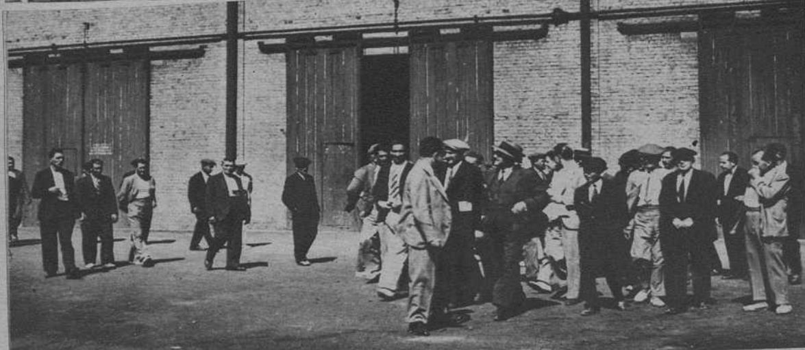
Suria.—La visita a las instalaciones mineras de los miembros de la Unión de Sindicatos Agrícolas de Cataluña