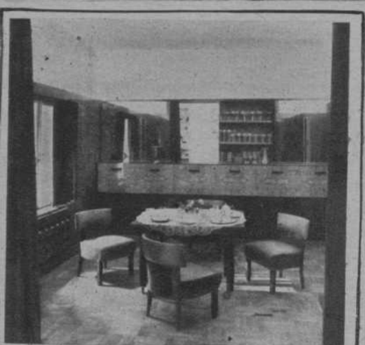
MUEBLES FORNONS Exposición y venta en los mismos talleres Salmerón, 102 - Teléfono 74915 - Única casa en España que puede servir en cualquier mo- mento pisos completos, por importan- tes que sean

En los poblados montañosos, los huelguistas colocaron sobre la vía del tranvía vigas de hierro, pero los guardias de Asalto les obligaron a retirarlas.