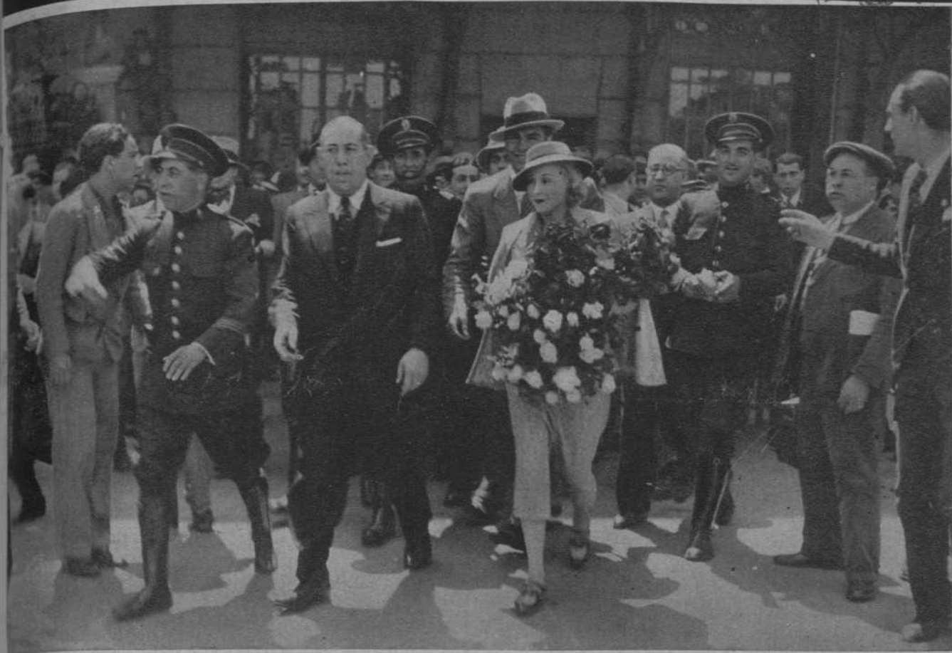
Anny Ondra, con el ramo de flores que le ofreció el cónsul de Alemania, se dirige al automóvil que debía llevarla a Sitges, abriendo paso entre el público que fué a recibirla, los guardias de Seguridad.