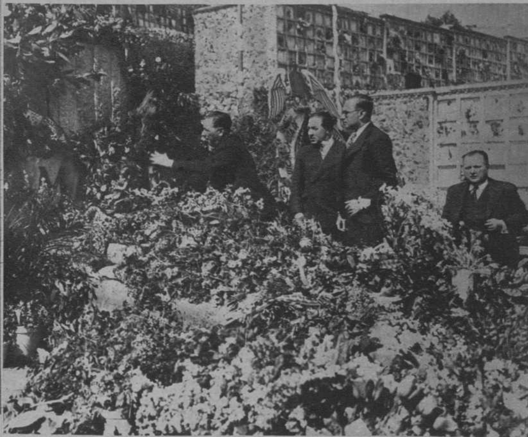
El Presidente de la Generalidad, depositando en la tumba de Maciá los ramos de flores ofrecidos por la madre de Fermín Galán y la esposa de García Hernández.