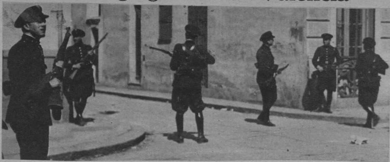
Los guardias de Asalto, dispuestos a repeler toda agresión