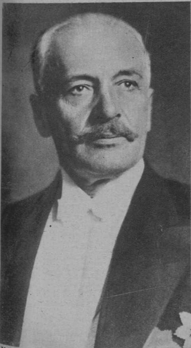
M. Moscicki, Presidente de la República polaca, hombre de ciencia de fama mundial, que ha celebrado una conferencia con el ministro de Negocios Extranjeros de Francia, M. Barthou, durante su estancia en Varsovia, de la que ha salido vigorizada la entente franco-polaca.