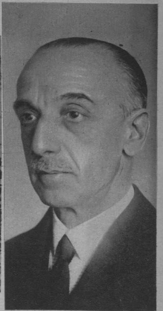
Don Luis Calderón, nuevo embajador de España en los Estados Unidos.