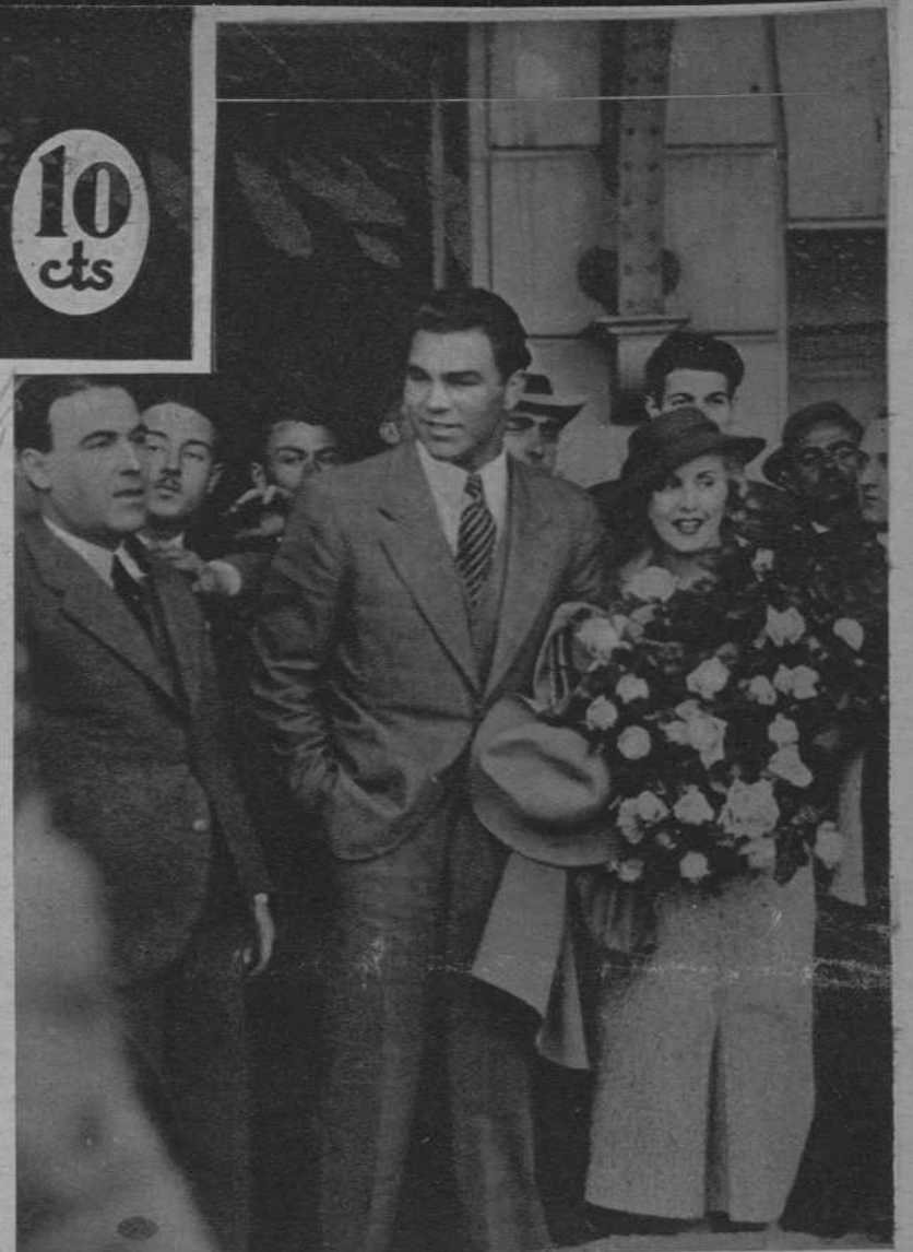
La artista cinematográfica Anny Ondra, con su esposo, el púgil alemán Max Schmeling, al salir ayer mañana de la estación.