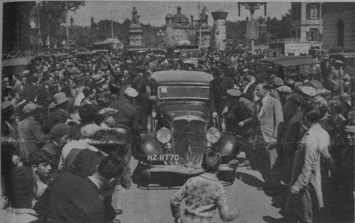
El auto en que iban Anny Ondra y su esposo, Max Schmeling, escoltado por guardias de Seguridad