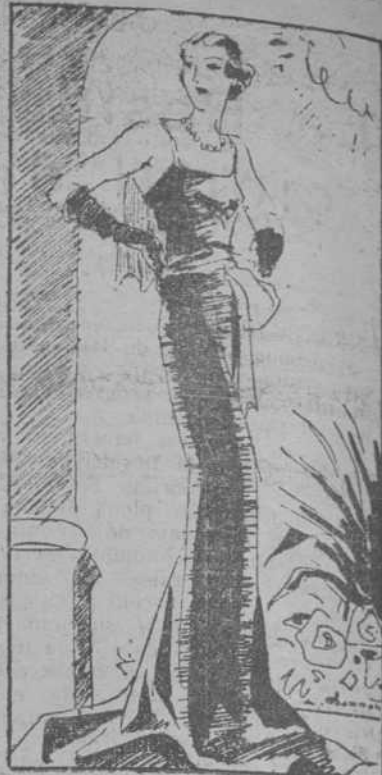
Vestido de noche, de lamé plata