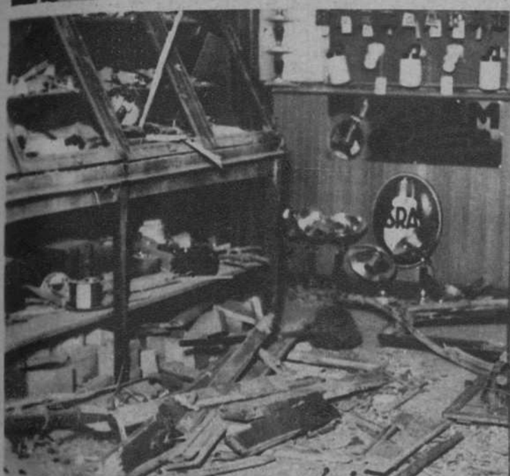
Destrozos causados por la bomba en el interior de una tienda cercana a la Comisaría