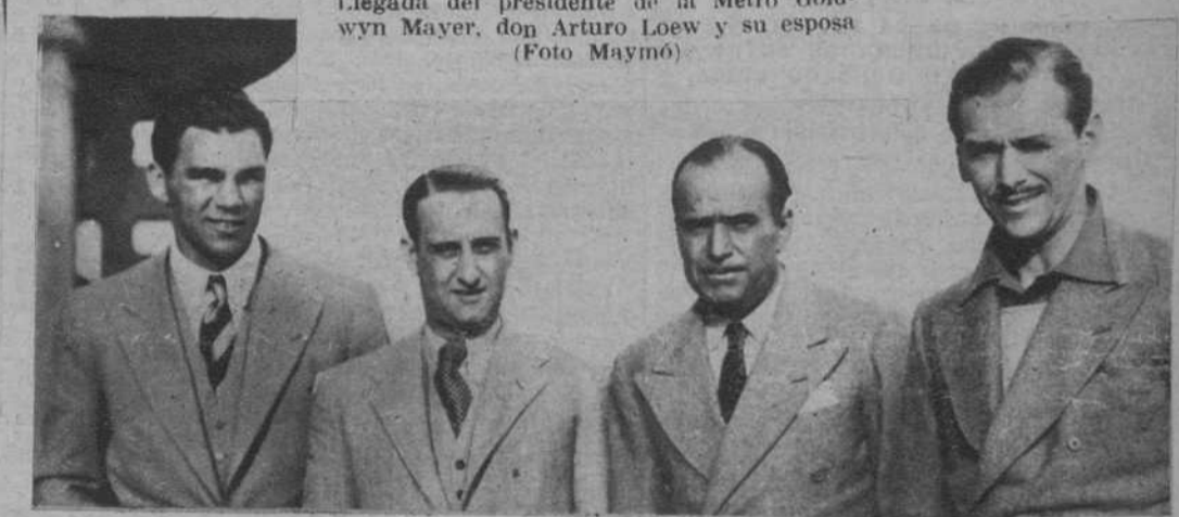
Sitges.—El promotor del combate Uzcudun-Schmelling, con Douglas Fairbanks, el hijo de éste y Schmelling.