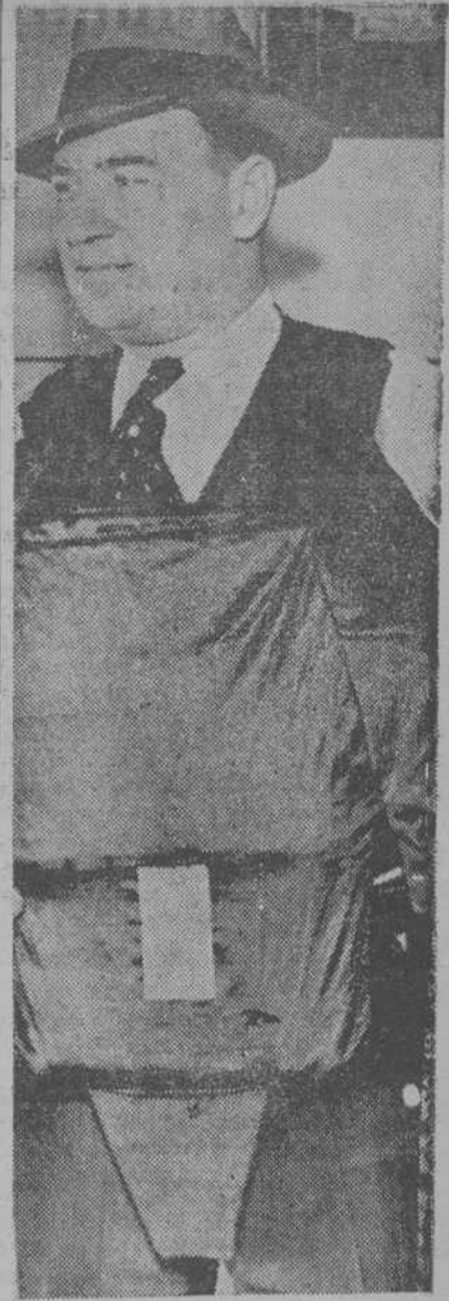
LOS POLICIAS NORTEAMERICANOS Para luchar contra los gamsters son provistos incluso de una especie de corazas para contrarrestar el efecto de las balas