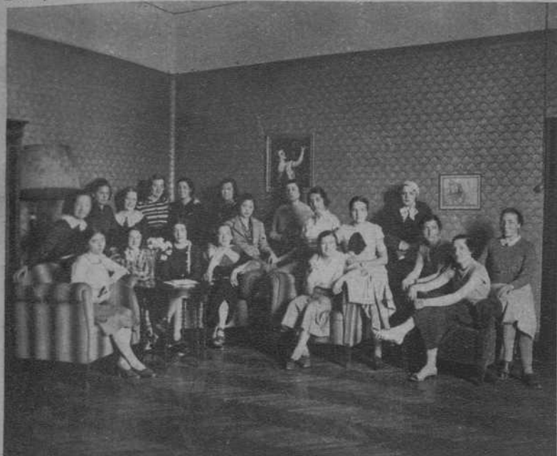
Grupo de señoritas estudiantes, en un saloncillo

igualmente capacitadas para la vida familiar que para la vida social.