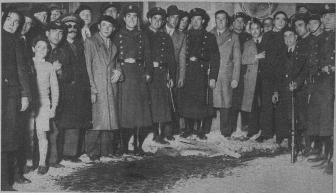
Charco de sangre en el sitio en que cayeron heridas las víctimas de la explosión