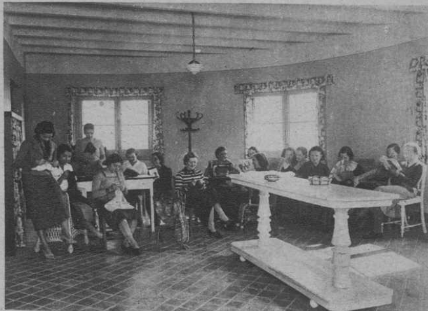
La sala de labores