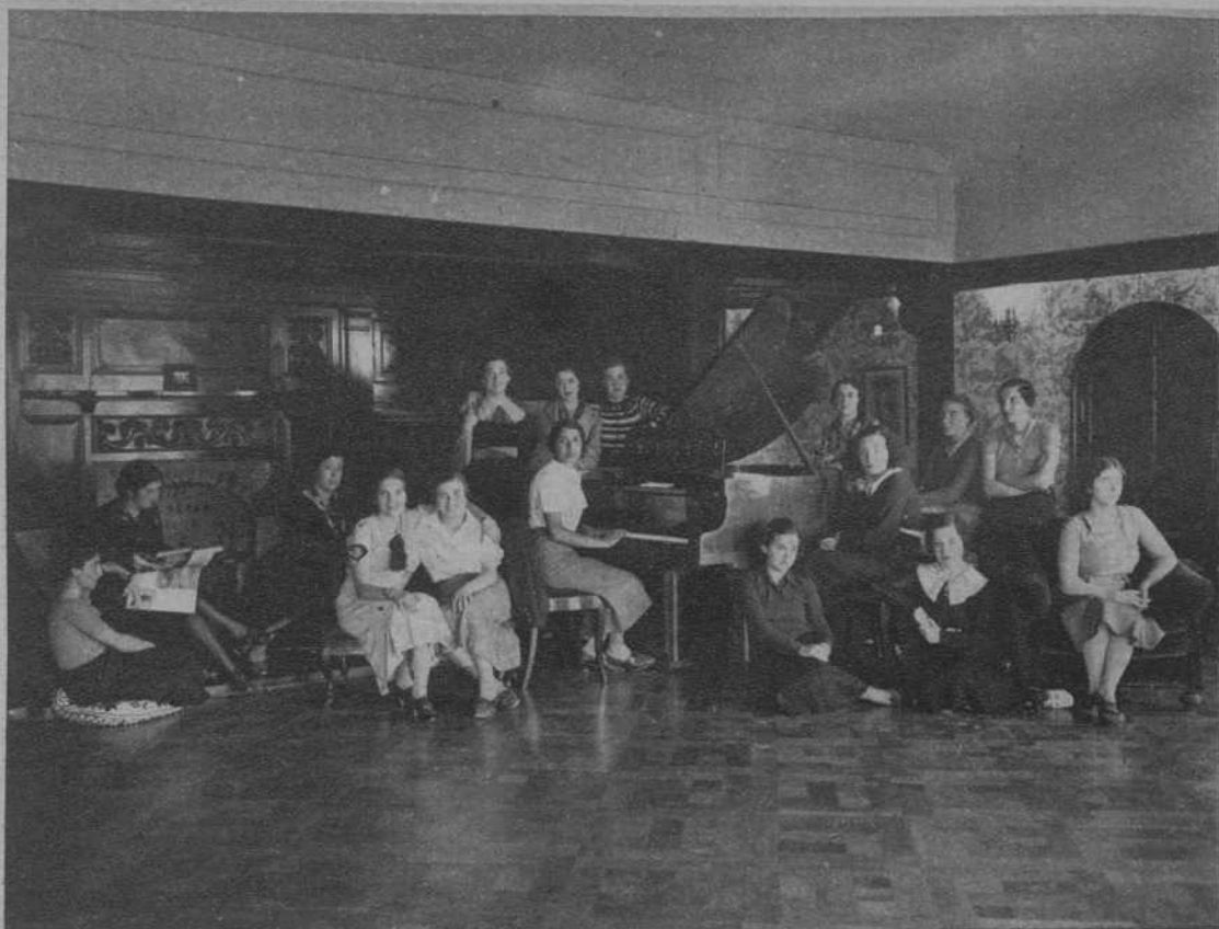
La sala de música de la Residencia Internacional de Señoritas Estudiantes, donde, semanalmente, se celebran conciertos íntimos

Admiré la biblioteca, con valiosas Enciclopedias e interesantes libros de consultas, donativos de la Gene-