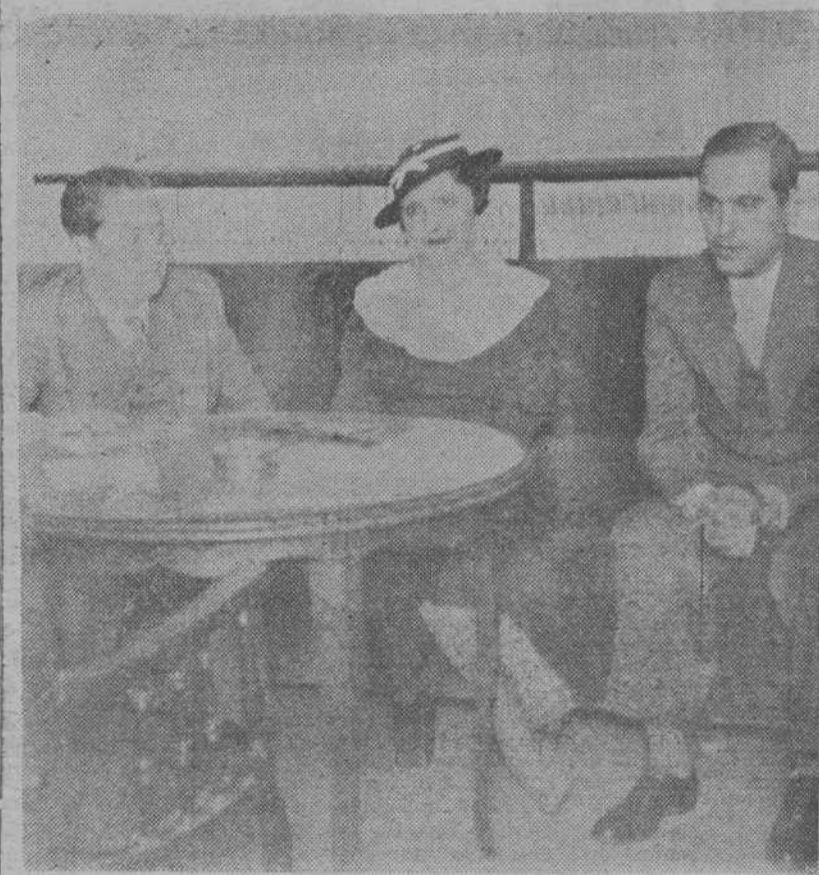
«AMICS DE LA POESIA»