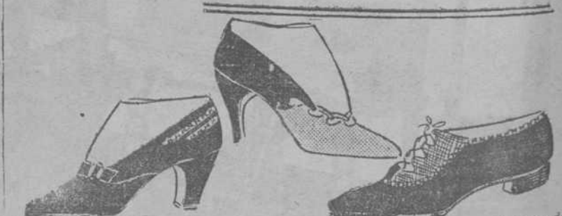
Zapato bajo, de piel de potro, con pespunte en el delantero.—Zapato de gamuza castaño y tafilote del mismo color.—Zapato de cabritilla clara, adornado con calados

CUPON - VALE CONSULTAS Y COMENTARIOS DE TODOS