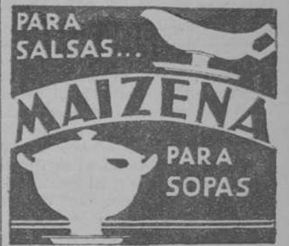
Concesionaria FEDERICO BONNET Apartado 388, Barcelona

En cuanto a la política internacional, el Consejo nacional de ex combatientes confirma sus puntos de vista, o sea: hostilidad a todo reconocimiento oficial al rearme ya efectuado por las potencias desarmadas en 1918, violando los tratados; necesidad de control de la fabricación de armas y de una acción enérgica en la Sociedad de Naciones y en la Europa Central para asegurar la independencia de Austria y colaboración con los ex combatientes de otros países por medio de las asociaciones internacionales."