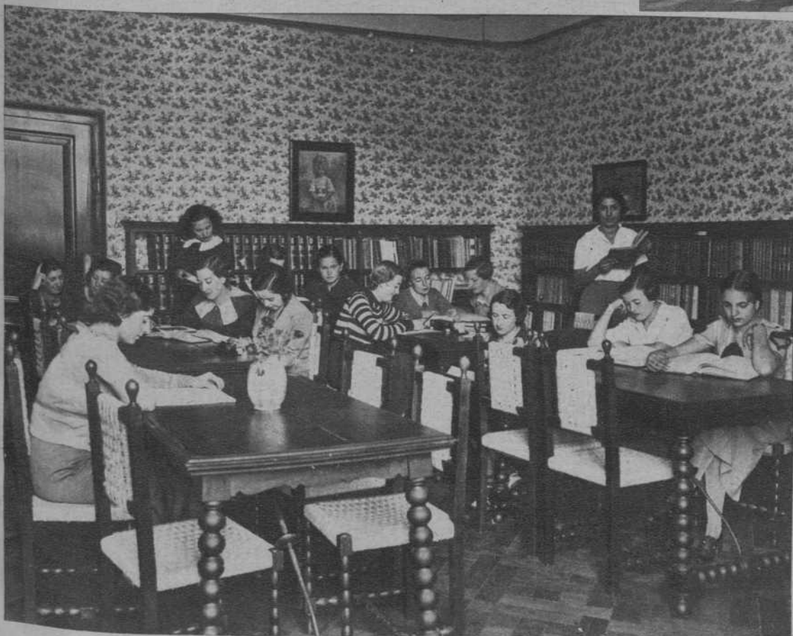
La biblioteca de la Residencia.