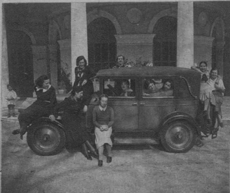
Las estudiantes de la Residencia, toman por asalto el coche de nuestro reporter gráfico

Además de la sección de señoritas, está organizada, en la misma casa, la sección de alumnas del Institu-