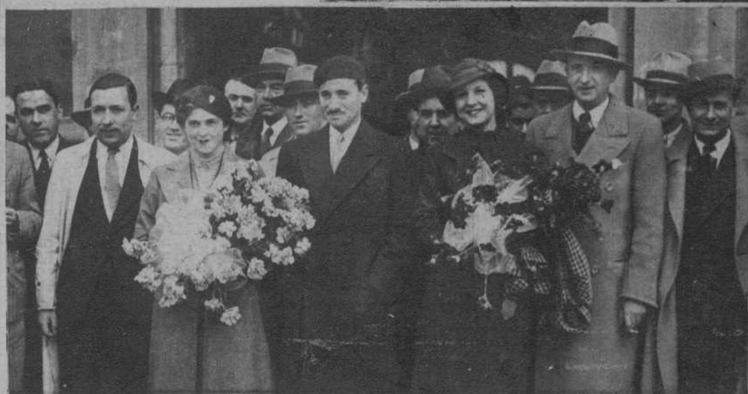
Llegada del presidente de la Metro Goldwyn Mayer, don Arturo Loew y su esposa