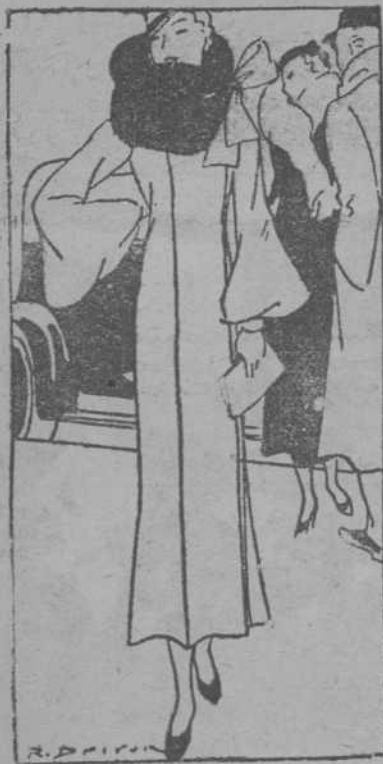
Abrigo de lana, azul claro, adornado con piel de zorro gris