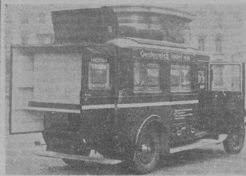
EL AUTO PRO PAGANDISTA

Una idea no del todo banal. Sin duda alguna, el ejemplo de Austria