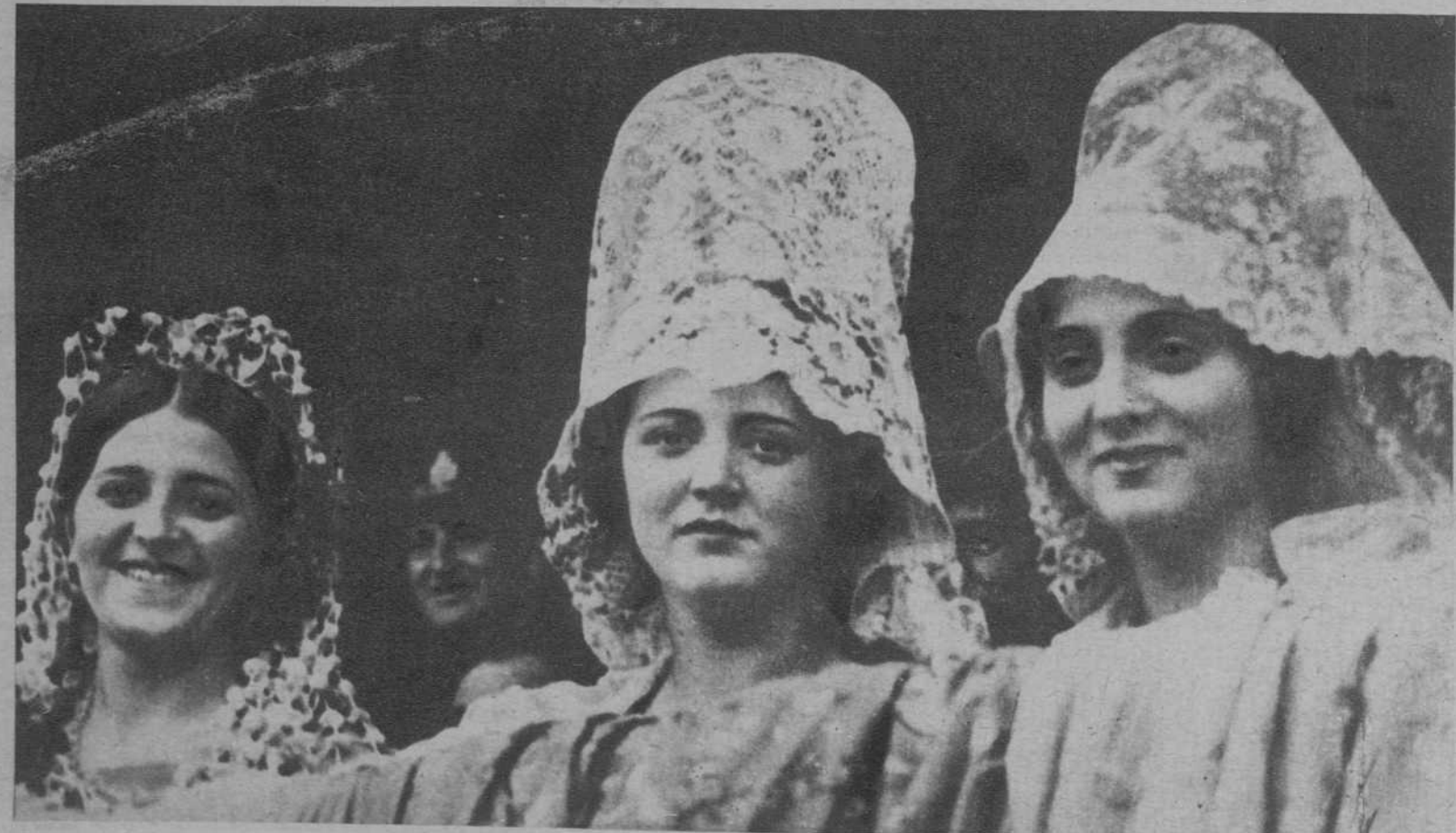
Las bellezas representantes de Valencia, Castilla y Cataluña, elegidas en 1930