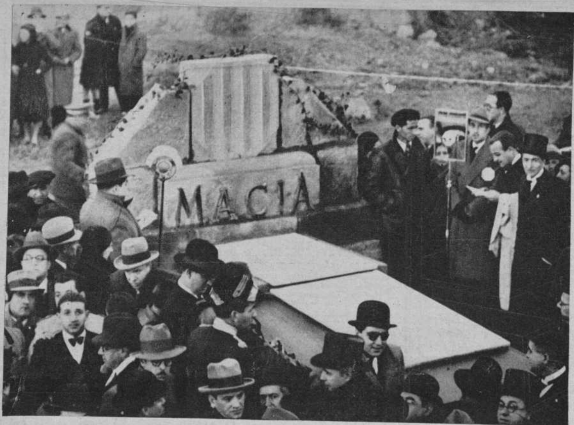
La tumba de Macià.