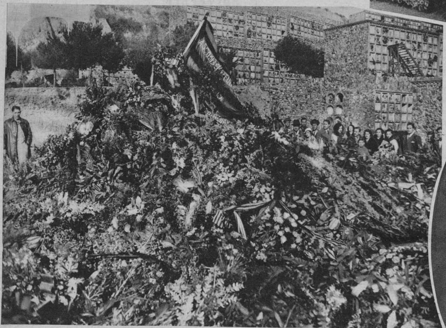
La tumba, cubierta de coronas, ayer mañana.