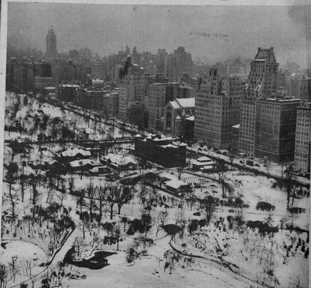
Una vista de Nueva York, cubierto de nieve.