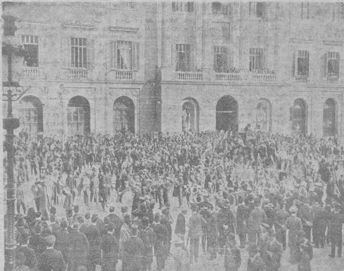
SALIDA DEL ATUNTAMIENTO DEL FERETRO DE MOSEN JACINTO VERDAGUER, EL 13 DE JUNIO DE 1902

El entierro de mosén Jacinto Verdaguer, en 1902