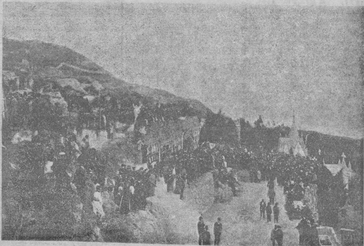
EL MOMENTO DE DAR SEPULTURA AL CADAVER DE MOSEN CINTO