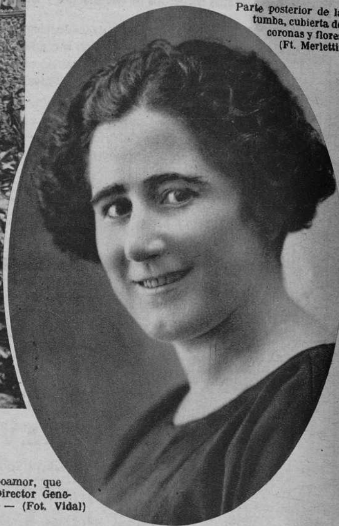
La Srta. Clara Campoamor, que ha sido nombrada Director General de Beneficencia.