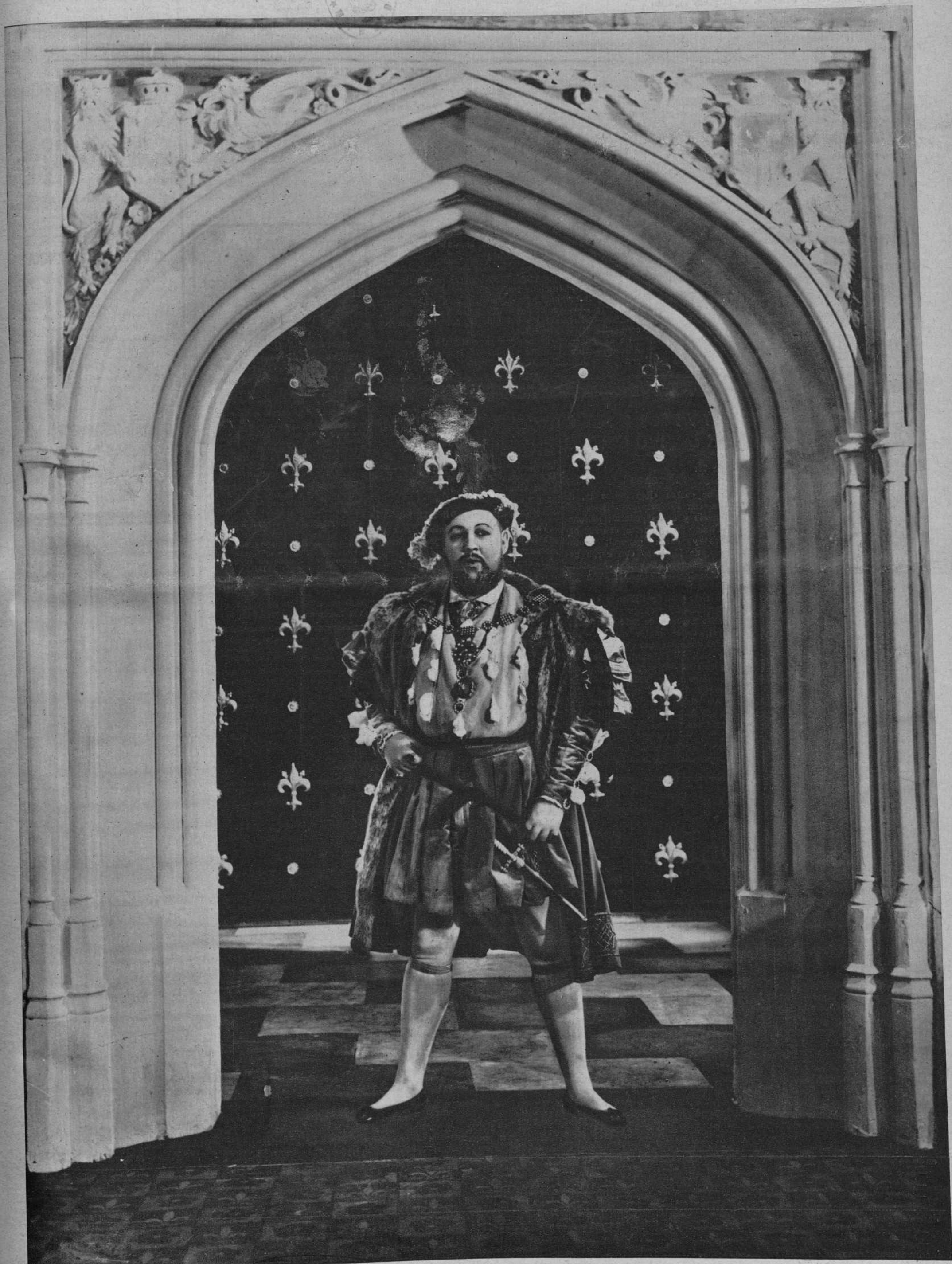
CHARLES LAUGHTON, EL GRAN ACTOR INGLES, QUE SE HA LABRADO YA UN NOMBRE ENTRE LAS GRANDES FIGURAS DE LA PANTALLA, EN UNA ESCENA DEL FILM DE GRAN ESPECTACULO «LA VIDA PRIVADA DE ENRIQUE VIII», DIRIGIDO POR ALEXANDER KORDA Y PRODUCIDO POR LONDON FILMS, QUE PRESENTAN LOS ARTISTAS ASOCIADOS, HOY NOCHE, EN TIVOLI, EN SOLEMNE SESION DE GALA