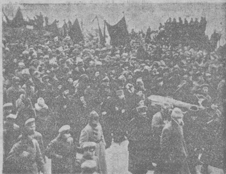
EL FERETRO DE LENIN, AL QUE SIGUIÓ UNA MULTITUD QUE SE CALCULO EN TRES MILLONES DE PERSONAS

Llegados los restos a la capital fueron expuestos en la Casa de los Sindicatos, edificio que perteneció, en