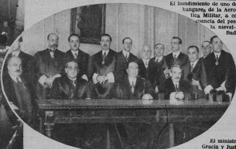
El ministro de Gracia y Justicia, presidiendo la sesión de apertura del curso en la Academia de Jurisprudencia.