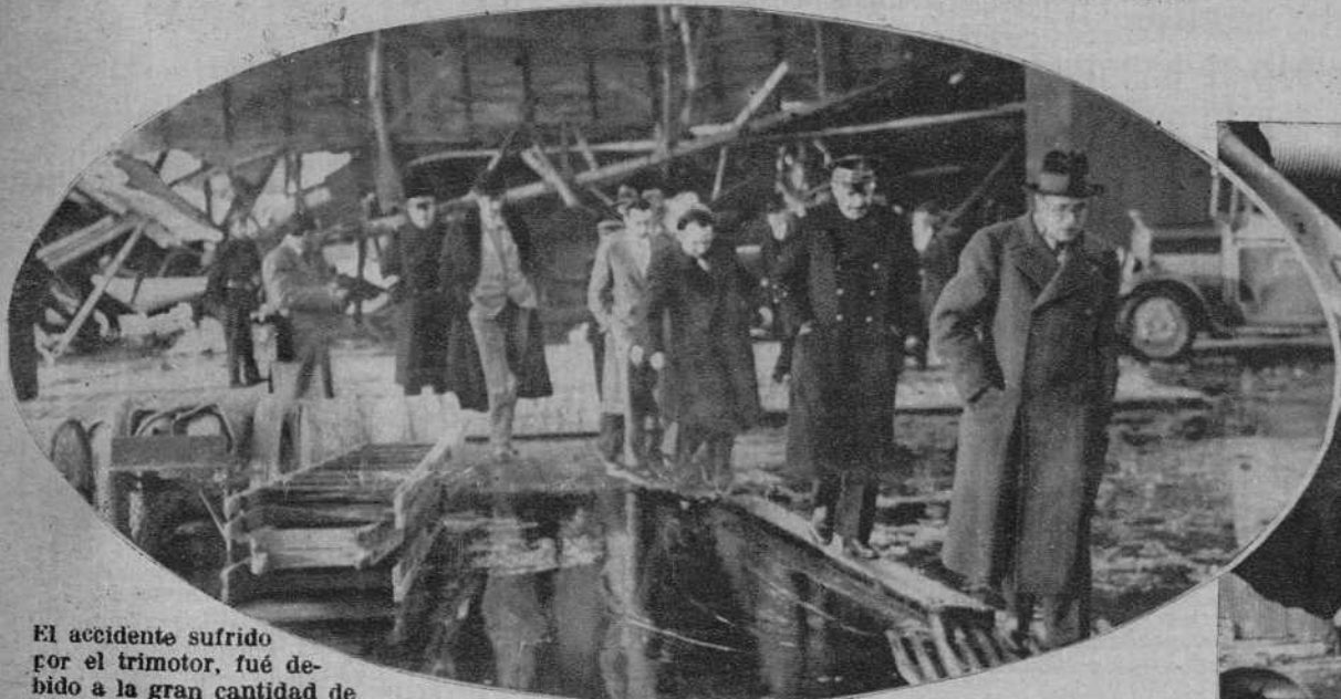
El accidente sufrido por el trimotor, fué debido a la gran cantidad de nieve que había en el aeropuerto, y a encontrarse éste inundado, como puede apreciarse en esta fotografía. M. Cot, saliendo del aerodromo, con el general Devrain y el señor Gassol