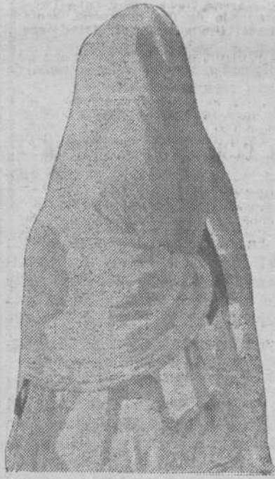
ANTES: Bajo las albas holandas, quedaba oculta la gracia del rostro y se desdibujaban las formas.

La vista de la causa atrajo a muchos abogados, porque los dos informes fueron muy notables, esperándose con interés la sentencia, que se dictará a primeros de año.