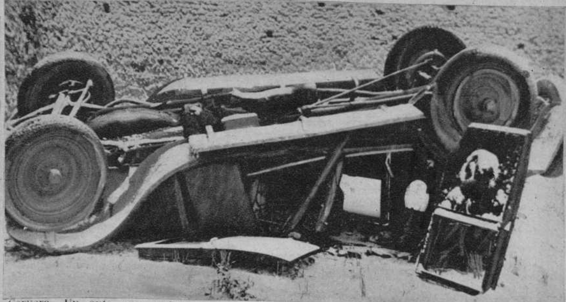
Cervera.—Un auto que, a consecuencia de la nevada, patinó, cayendo desde seis metros de altura, sin que sus ocupantes sufrieran graves daños.