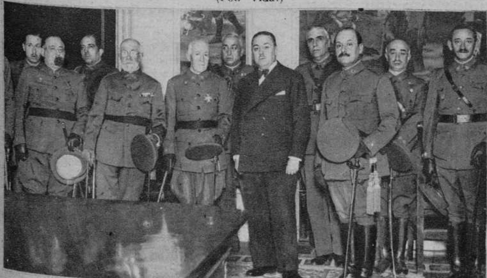
El ministro de la Guerra y el subsecretario, rodeados de los generales que asistieron a la recepción celebrada en el Palacio de Buenavista.