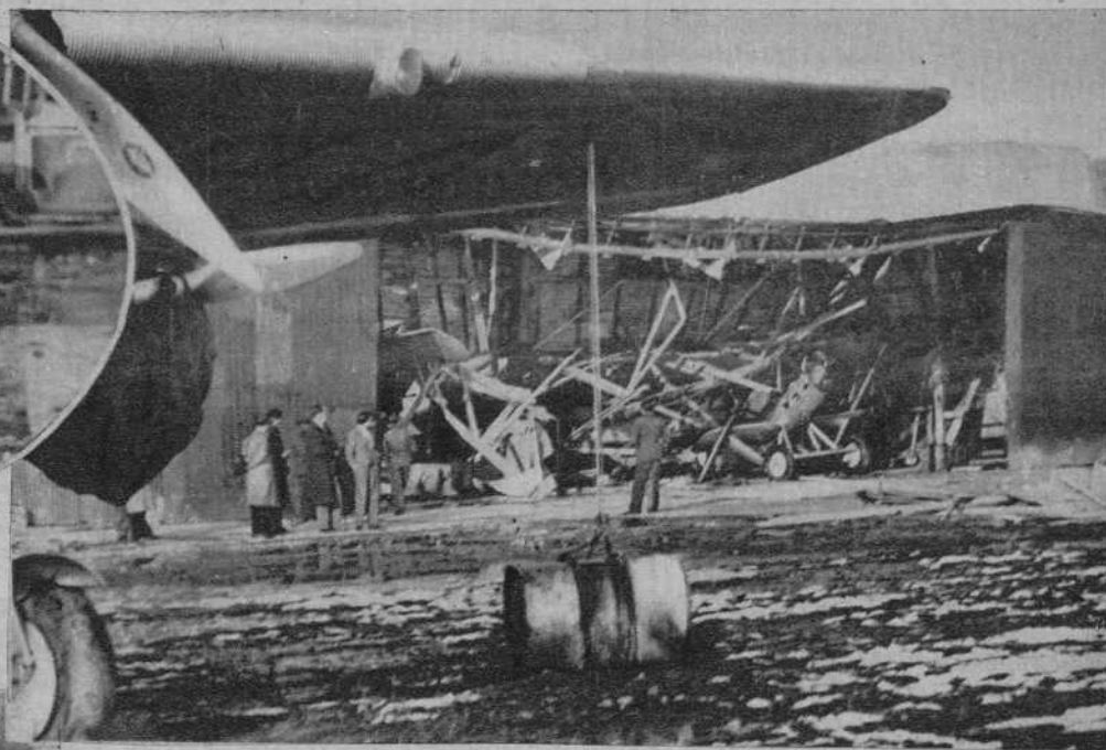
El hundimiento de uno de los hangares de la Aeronáutica Militar, a consecuencia del peso de la nieve.