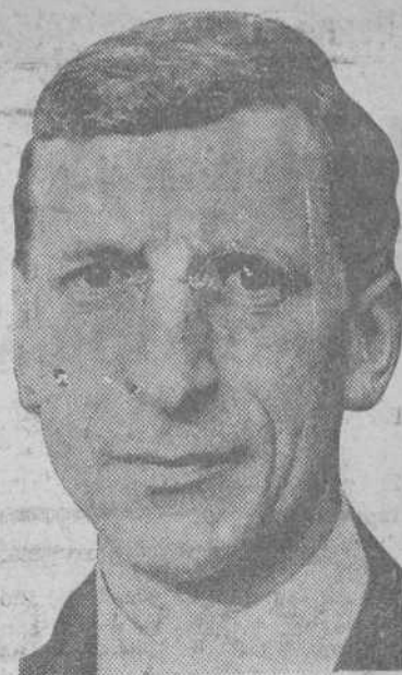
En Irlanda del Norte