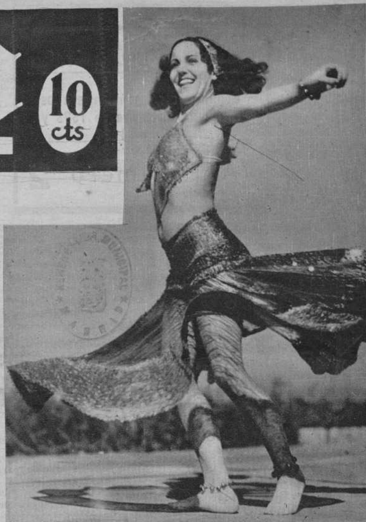
UNA DANZARINA MEJICANA

Movia Lou, la célebre danzarina mejicana, durante su prolongada estancia en las islas de Hawái, ha enriquecido su repertorio coreográfico con algunas danzas pintorescas de las islas del Pacífico, logrando ser la única artista de raza blanca que ha logrado encontrado el secreto del ritmo de las danzas que tanto llamaron la atención en Francia durante la celebración de sus Exposiciones Coloniales.