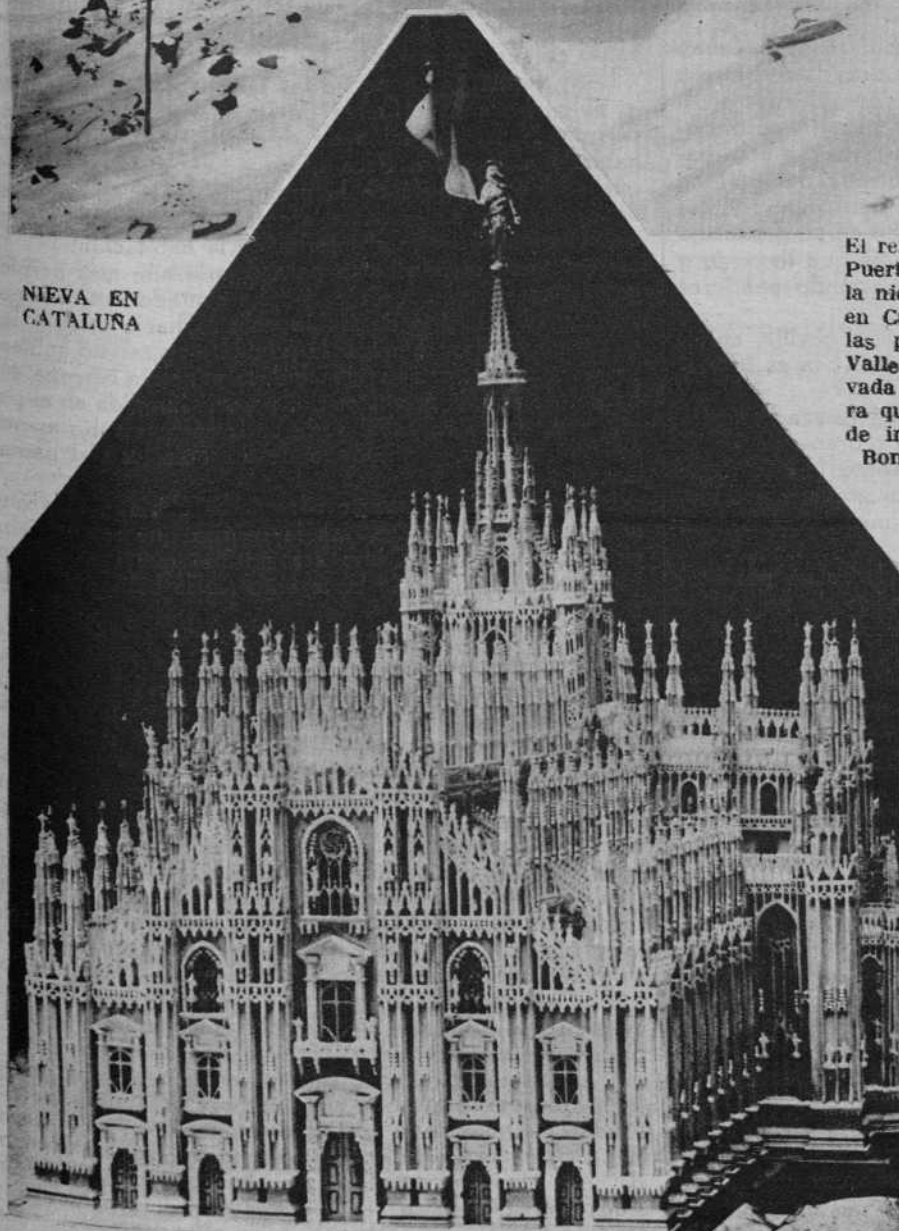
Un artista italiano, el señor Radice, ha tardado más de ocho años en construir, con madera y cristal de color, una reproducción de la Catedral de Milán

El refugio de la «Mare de Deu», en el Puerto de la Bonaigua, bloqueado por la nieve. — Ha aparecido ya la nieve en Cataluña, y, como de costumbre, las primeras fotografías vienen del Valle de Arán, donde la primera nevada ha sido lo bastante copiosa para que los aficionados a los deportes de invierno se hayan dirigido a la Bonaigua para cultivar su deporte favorito