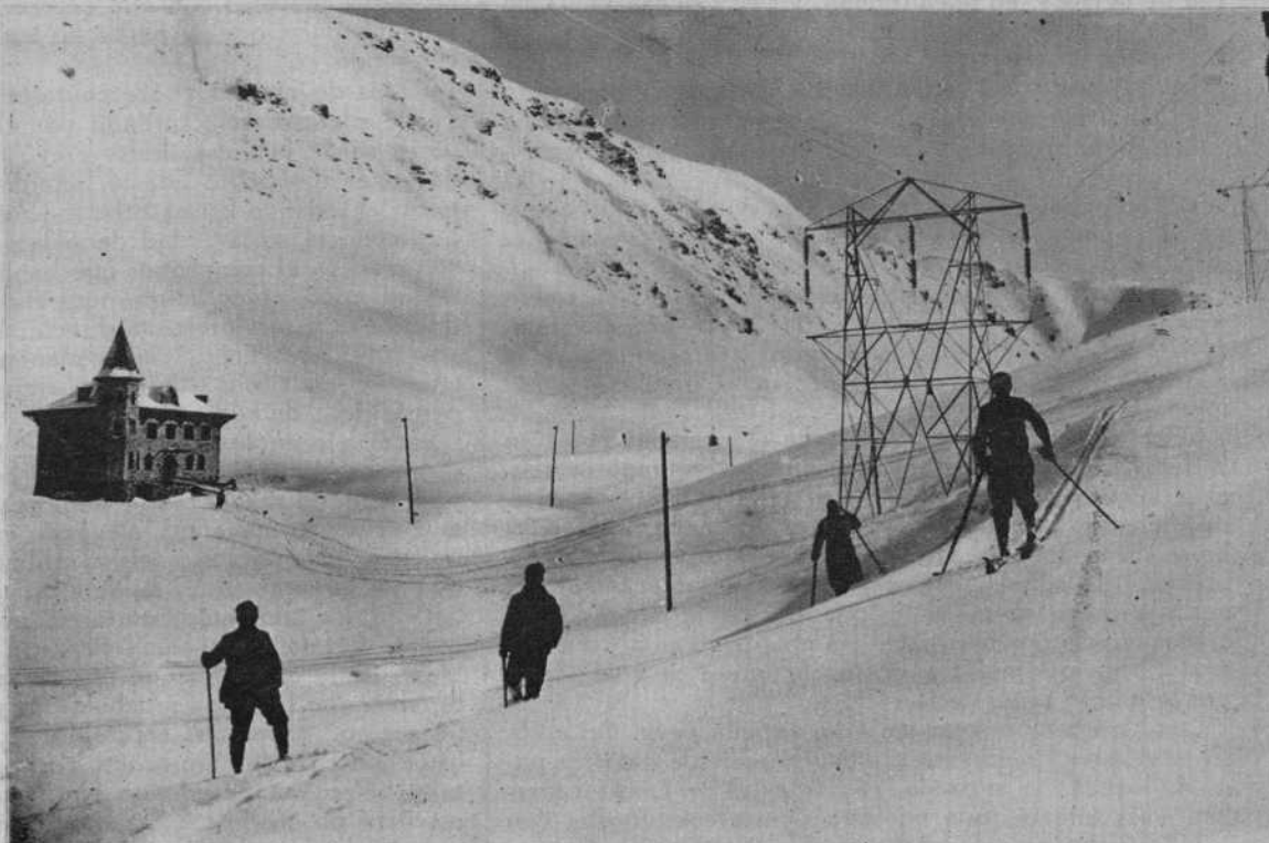
La cumbre del Puerto de la Bonaigua, después de las últimas nevadas.

El canciller Hitler, aunque agobiado muchas veces por las preocupaciones del cargo, aprovecha todos los «intermedios» de descanso para asistir a los conciertos. Últimamente concurreció, en Berlín, a un concierto de música italiana dado por el tenor Benjamino Gigli. En la fotografía aparece el canciller cambiando impresiones con el ministro de la propaganda, Goebels.