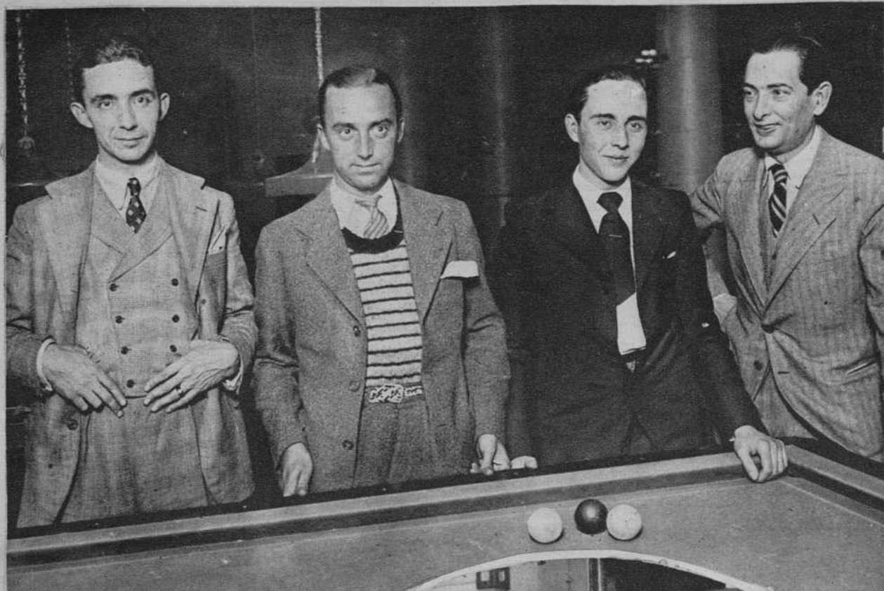
Nuestros billaristas comienzan a tener fama internacional, y cuando participan en concursos internacionales, saben competir con los más destacados e incluso vencerlos. Para participar en el match Francia-España, ha salido para Argel el equipo designado por la Federación Española de Billar.

La crisis económica y los cambios políticos que la Gran Guerra determinó en los países que en ella participaron y fueron vencidos, han sido causa de que los ayer poderosos o bien afortunados con la fortuna, pasaran a ocupar el último rango de la sociedad o a quedar en la miseria. Quienes creyeron haber nacido para gozar de la vida sin ningún esfuerzo para merecer este goce, se ven ahora obligados a ganarse el pan de cada día. Tal es el caso de la condesa Haller, que ejerce el cargo de directora de una orquesta de jazz-band en un café-bar de Budapest.