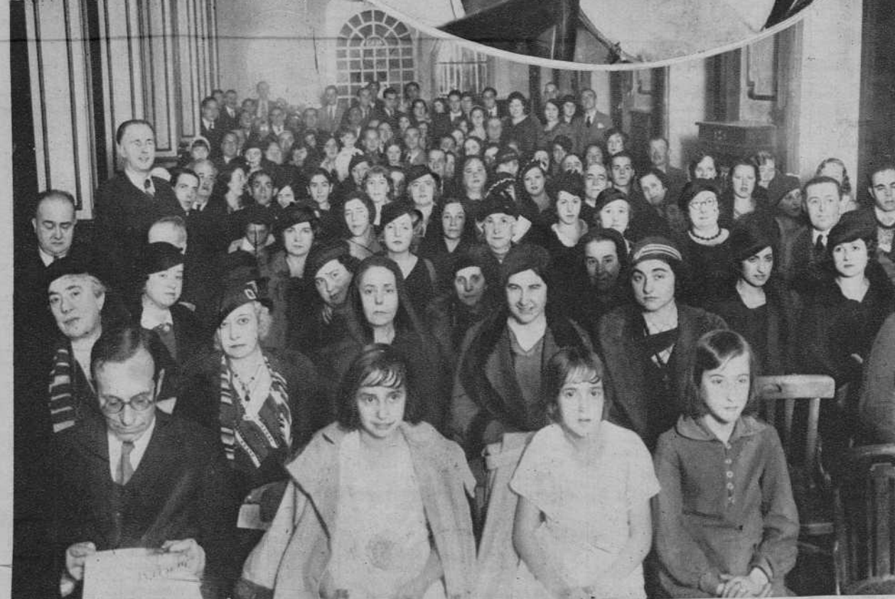
Aspecto del salón del Centro de Hijos de Madrid, durante el acto.