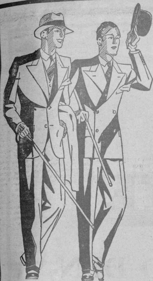
VISITEU ELS NOSTRES APARADORS