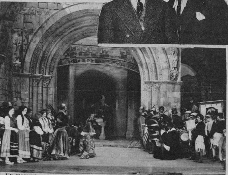
Un momento solemne del primer cuadro del segundo acto de la obra. En el ángulo superior derecho, silueteado, el ilustre dramaturgo don Federico Oliver, y el popular e insigne maestro o Penella, autores, respectivamente, del libro y de la partitura de «El hermano Lobo».