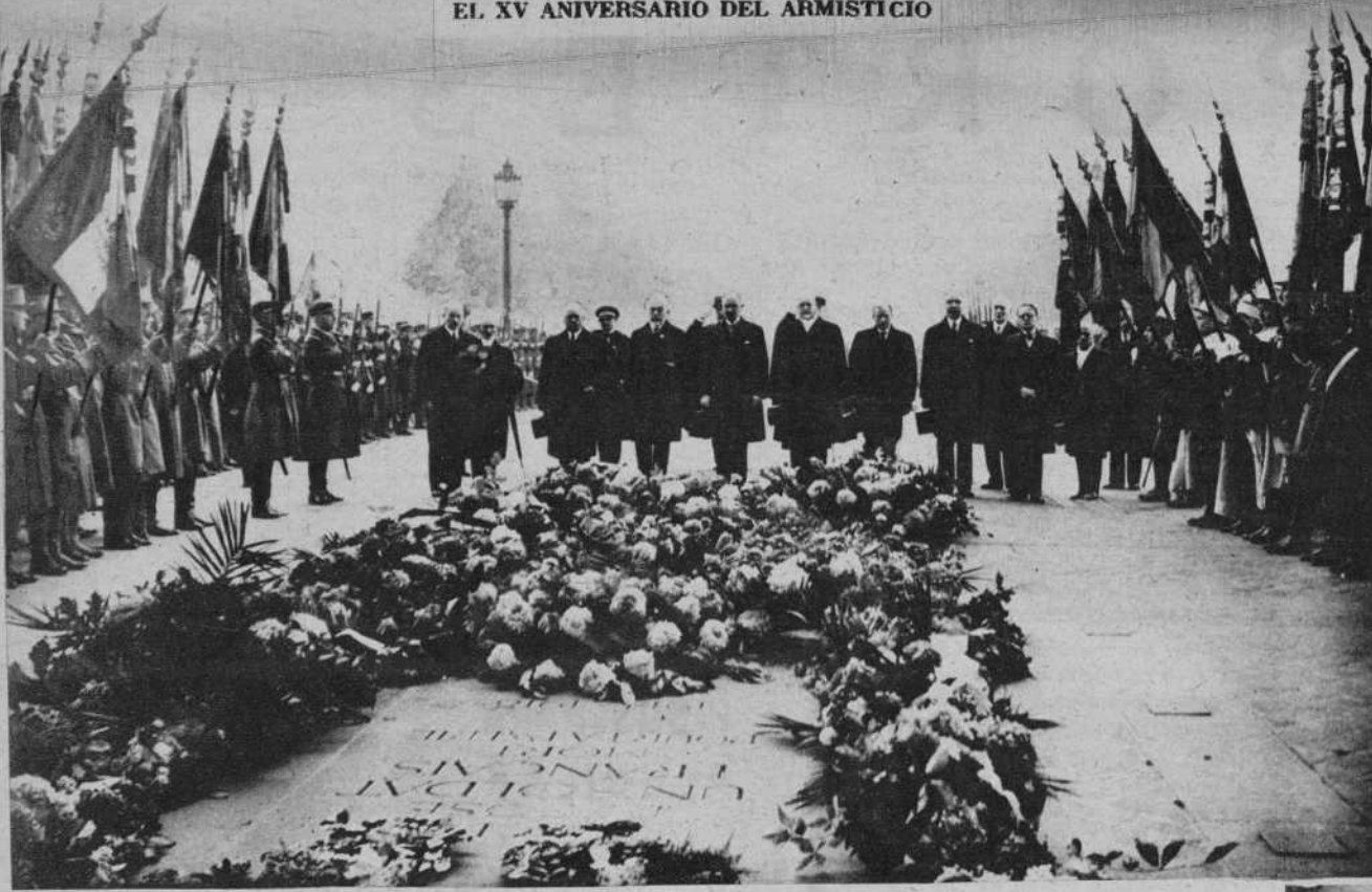
París. — El Presidente de la República, y el Gobierno, ante la tumba del soldado desconocido