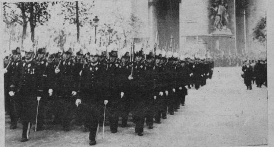
Frente a la tumba del soldado desconocido, desfilaron en París las tropas de la guarnición al frente del gobernador militar, el glorioso inválido Gourand