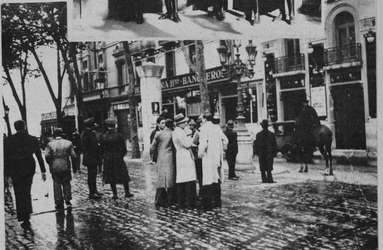
Dependientes mercantiles haciendo comentarios sobre la huelga.