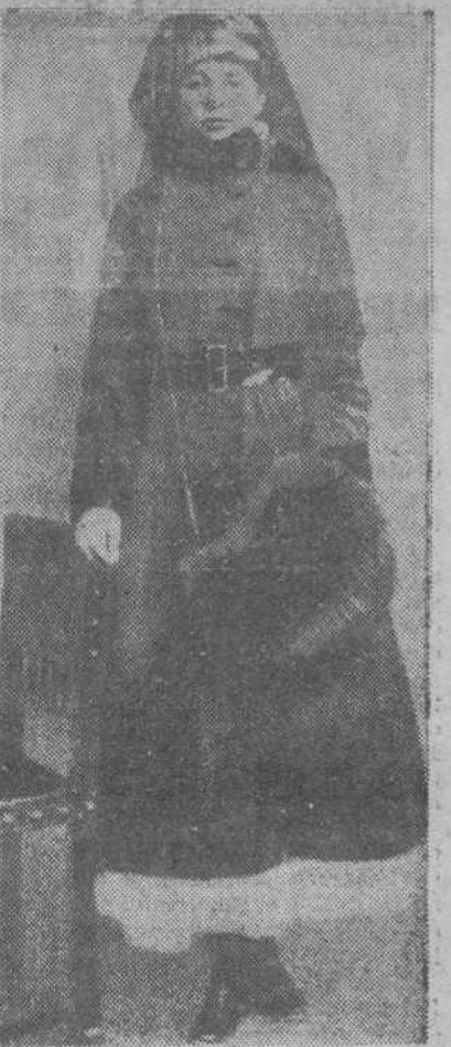
Retrato de Mata-Hari, el día que fué detenida.