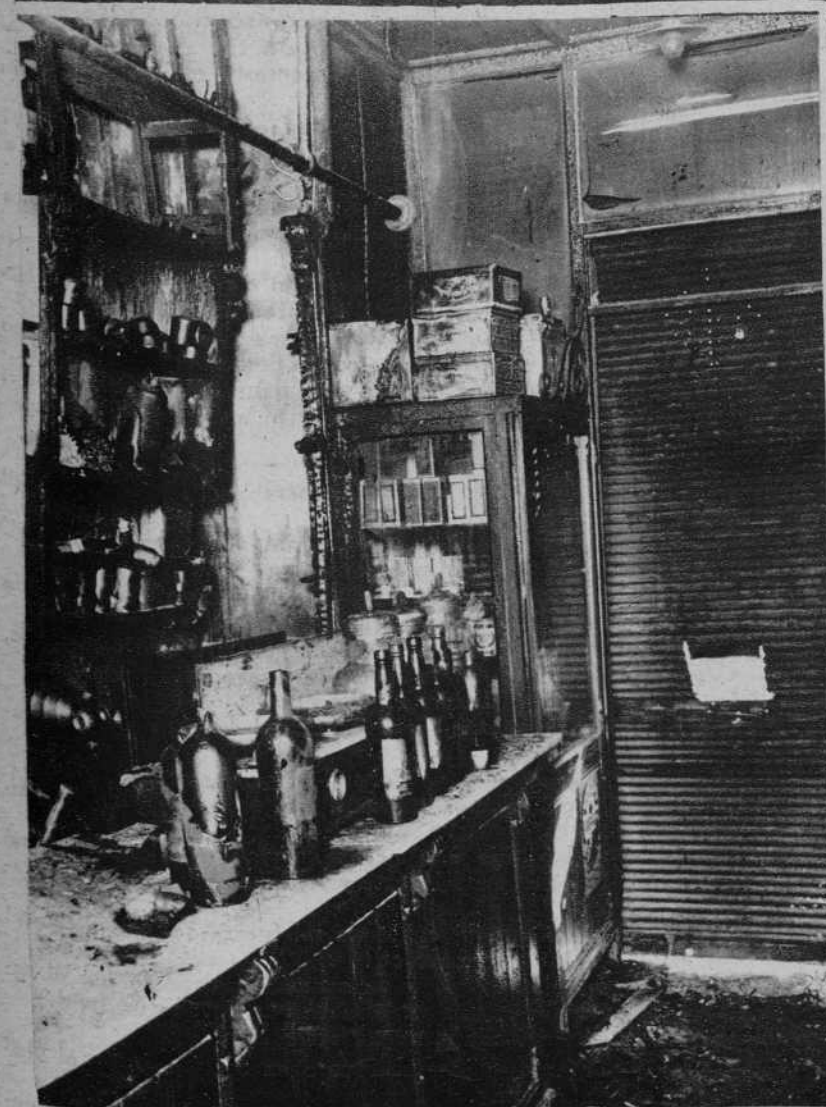
El colmado de la calle nueva de la R ambia incendiado la noche del lunes.