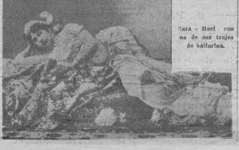
Mata-Hari con uno de sus trajes de bailarina.

Nosotros siempre creímos que el sentido político, instintivo, más que razonador, si se quiere, estaba en Cataluña. Y sigue permaneciendo en ella. En todas partes, hay, más o menos posibles al régimen republicano. Aquí, no. Aquí la pugna electoral, está entre una izquierda, un centro y una derecha republicanas. El domingo se irá a la lucha electoral, como si la República tuviera ya mayoría de edad.—M. A.