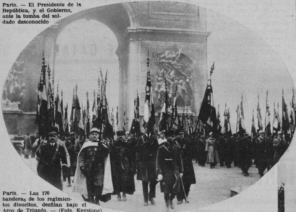
París. — Las 170 banderas de los regimientos disueltos, desfilan bajo el Arco de Triunfo.